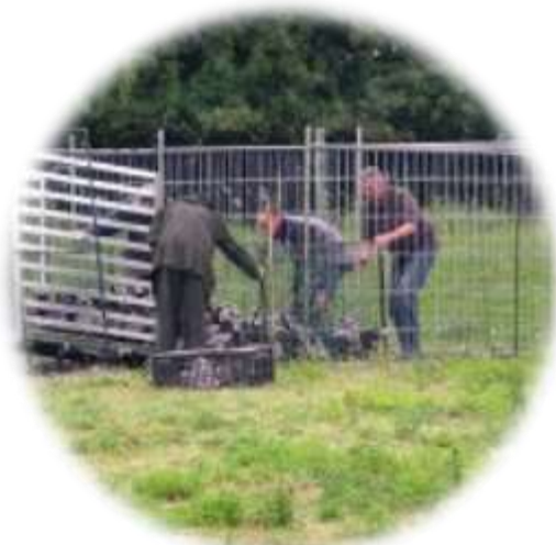
Een boer laat 'lastige' ganzen op zijn veld insluiten en afmaken