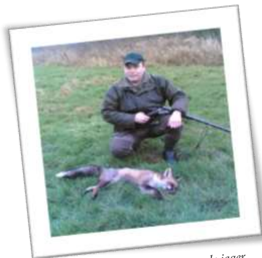
Dit vosje kon helaas de kogel van de jager niet ontwijken