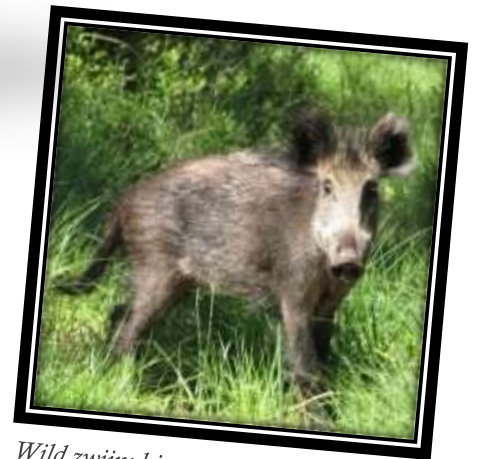
Wild zwijn: hiervan worden onvoorstelbare aantallen afgeschoten. Van alle 5 zwijntjes haalt er maar eentje het volgende jaar.

Alleen, er zijn nooit 'teveel' dieren. De natuur regelt dat zelf. Het aantal dieren van een soort wordt vanzelf kleiner of groter. Dit wordt bepaald door voedselaanbod, ruimte, nest- of broedgelegenheid, onderlinge concurrentie, soorten planten in de omgeving, ziekten, parasieten enzovoorts.