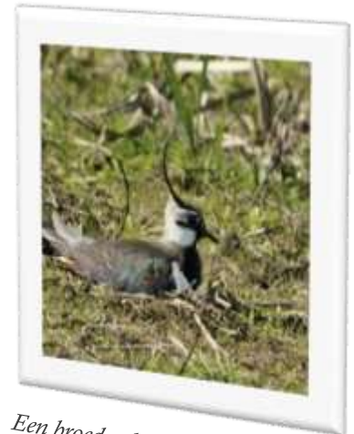
Een broedende Kievit laat je gewoon met rust

Heel vroeger zeiden mensen dat als ze een Kievitseï zagen, de lente begonnen was. Dus gingen ze allemaal Kievitseieren zoeken als ze de winter zat waren. We kijken nu gewoon naar buiten en zien vanzelf of de lente begonnen is of niet. Helaas zijn er nog steeds mensen die het leuk vinden om die eieren te gaan zoeken en mee te nemen. Dat noemen ze traditie. We deden vroeger wel meer dingen die we nu niet meer doen. Dierenleed mag nooit en mag ook nooit een traditie zijn. Zeker nu de Kieviten die eieren zelf heel goed kunnen gebruiken. Een Kievit is een weidevogel en daar zijn er veel te weinig van en ze gaan in aantallen nog steeds heel hard achteruit in de hele Europese Unie, niet alleen in Nederland. Afblijven dus en deze traditie in het verleden laten waar die hoort.