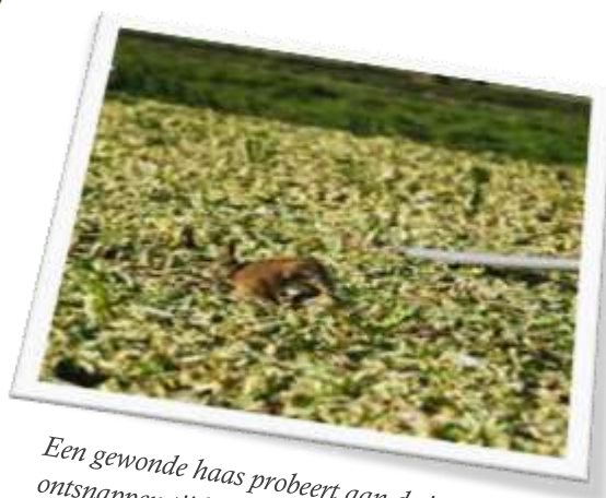
Een gewonde haas probeert aan de jager te ontsnappen tijdens een hazenjacht in Bovenkarspel

In de wet staat dat er zes diersoorten in bepaalde periodes gedood mogen worden. In de wet staat ook dat alle andere dieren pas doodgemaakt mogen worden als eerst door een groepje mensen van de provincie is gekeken hoe de situatie is en of er echt geen andere oplossing dan een vrijstelling om te doden af te geven. Maar ja, provinciebestuurders kunnen zelf ook jager zijn. En jagers schieten nou eenmaal graag. Je kunt je afvragen of deze mensen wel echt genoeg op zoek gaan naar een andere oplossing. Jagers horen dus helemaal niet in een groepje dat over afschot beslist. Daar komt nog bij dat als je iemand tegenkomt die aan het jagen is, je waarschijnlijk zal denken, 'die zal er wel een vergunning voor hebben'. Alleen, hoe weet je dat? Hoe kan je dat goed controleren? Mensen uit andere landen, komen ook graag een weekendje jagen in Nederland en verdwijnen daarna weer. Als jagen gewoon niet zou mogen, weten we ook meteen dat iedere jager illegaal bezig is.