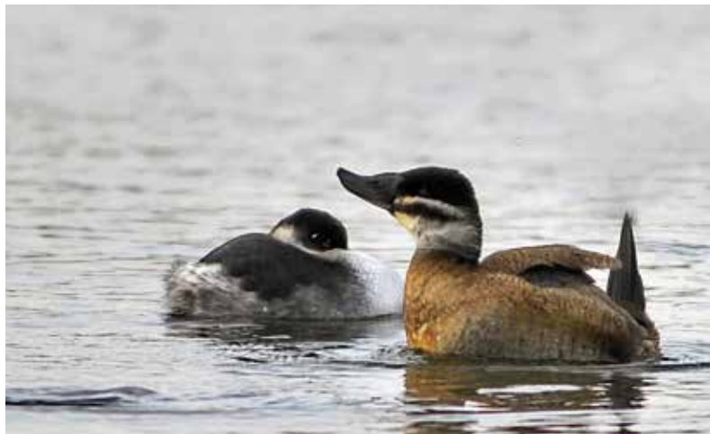
Witkopeend en geoorde fuut

Amerikaanse soort, die met name in Groot-Brittannië op grote schaal uit waterwildcollecties is ontsnapt. In ons land zijn ze het gehele jaar in zeer kleine aantallen te zien, met name bij Lelystad en bij Leiden. Meer dan een stuk of 20 komen er niet voor in ons land en dat aantal is al zo'n 50 jaar constant. Het is dus een exoot. Maar een invasieve exoot, een soort die zich exponentieel uitbreidt en