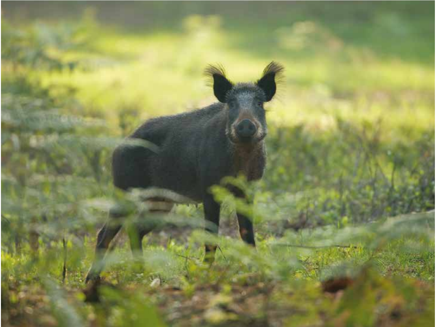
Voor de Veluwe geldt al jaren een doelstelling voor afschot van wilde zwijnen van bijna 80 procent.

wild zwijn 77,8 procent, ree 70 procent, edelhert 70 procent en damhert 70 procent, wat het totaal brengt op 72,5 procent jaarlijks af te schieten dieren. In dezelfde periode bedroegen de gemiddelde sterftcijfers in de Oostvaardersplassen: heckrond 8,4 procent, konikpaard 16,2 procent, edelhert 20,7 procent, wat het totaal gemiddelde op 17,6 procent brengt. Daarbij gaat het niet om proactief afschot van veelal gezonde dieren, maar om reactief afschot, dat erop gericht is dieren uit hun lijden te verlossen. Iemand heeft ooit uitgerekend dat het jaarlijks afschot op de Veluwe te vergelijken valt met een 'plaag' van 1400 wolven gedurende acht maanden. Niet voor niets noemt wildbioloog Geert Groot Bruinderink de Veluwe 'de grootste schiettent van Noordwest-Europa'.