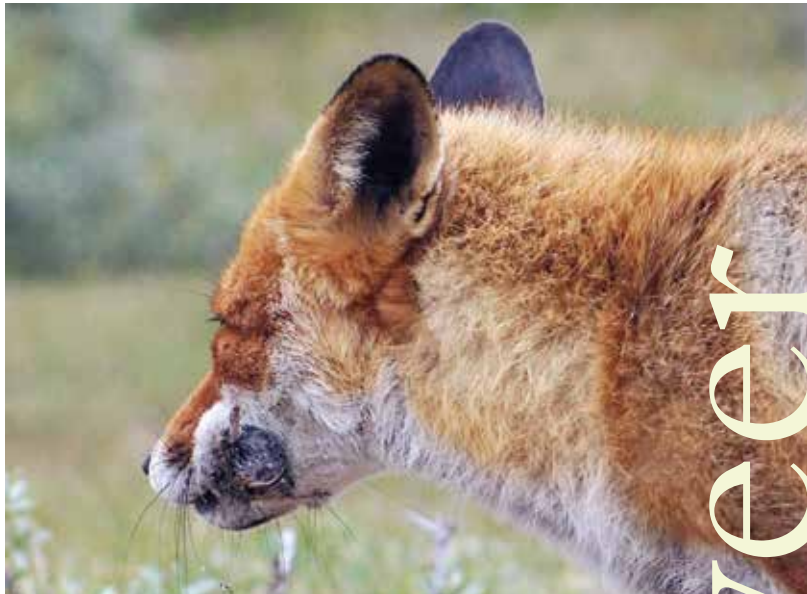
Vossen eten dieren die wortels eten.

V eel van het werk van De Fauna-bescherming gebeurt op de achtergrond, vooral in de vorm van bezwaren en rechtszaken. Op dit moment lopen er 19 zaken. In de nieuwe rubriek 'In het geweer' vertelt Argus over de achtergronden en het verloop van opvallende zaken. Toen De Fauna-bescherming de ontheffing van de provincie Zuid-Holland zag voor het doden van vossen in een wortelveld, was ze verbijsterd. Daarom in deze eerste aflevering: de vegetarische vos.