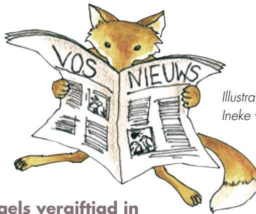
Illustratie: Ineke van den Abeele