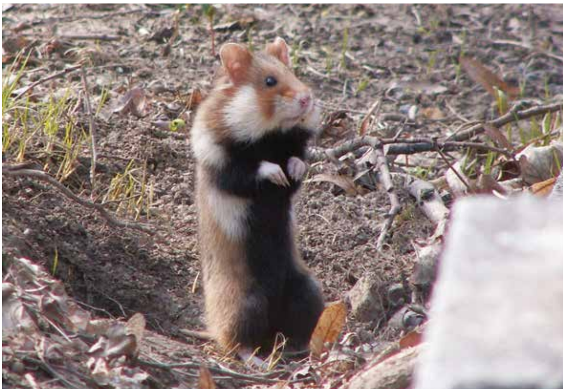
'Hoe gaat het nu met de veldhamster?'

Bij fauna moet je zo min mogelijk sturend optreden