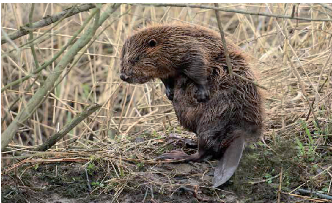
Bevers zijn dagelijks veel tijd zoet met het verzorgen van hun vacht.

In 2012 werden er ruim honderd burchten in de Biesbosch in kaart gebracht. Aangezien er op diverse locaties bevers zijn uitgezet, heeft het knaagdier zich intussen in grote delen van het Nederlandse rivierengebied gevestigd en is de opzet van deze herintroductie meer dan geslaagd. Door de vele projecten (Ruimte voor de Rivier, natuurontwikkeling) in het rivierengebied zijn de vestigingsmogelijkheden voor bevers aanmerkelijk verbeterd. Door de nieuwe inrichtingswerkzaamheden zijn er immers geschikte, natte woongebieden voor bevers (en andere dieren) ontstaan. De totale beverpopulatie in ons land bestaat thans uit minimaal zeshonderd dieren. De kans om het imposante dier in het wild tegen te komen, is er dus zeker. Zijn sporen: vraat aan bomen en struiken, glijbanen en imposante burchten zijn in ieder geval niet te missen.