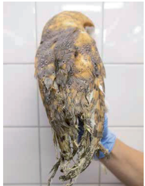
Uil met lijmrusten in de veren door een lijmplank.

'Gevangenschap is misschien wel het ergste wat een wild dier kan overkomen'