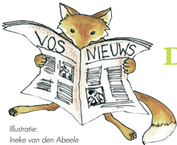
Illustratie: Ineke van den Abeele