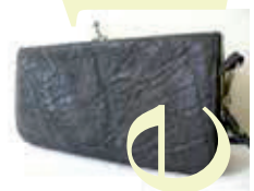
Handtas van olifantenhuid.