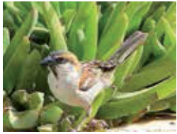
Twee Kaapverdische mussen kwamen per schip aan in Zeeland.

Onze NWWA denkt daar heel anders over; je moet ten slotte je duurbetaalde bestaan ergens mee rechtvaardigen. Haar standpunt was dat alleen invasieve exoten bestreden moeten worden. En invasief hield twee dingen in: in de eerste plaats dat een soort zich exponentieel snel voortplant en in de tweede plaats dat de soort een concrete bedreiging vormt voor inheemse soorten. En hoewel een groei van twee naar vier exemplaren al schaamteloos exponentieel mag