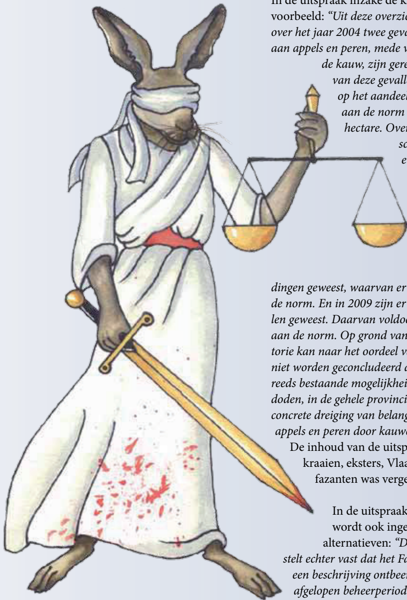
Tekening: Ineke van den Abele.

In de uitspraak inzake de kauw staat bijvoorbeeld: "Uit deze overzichten blijkt dat er over het jaar 2004 twee gevallen van schade aan appels en peren, mede veroorzaakt door de kauw, zijn geregistreerd. Geen van deze gevallen voldoet, gelet op het aandeel van de kauw, aan de norm van € 115,- per hectare. Over 2005 is geen schade aan appels en peren geregistreerd. In 2006 betreft het 10 gevallen, alle onder de norm. Over 2008 zijn er 11 schadegevallen geweest, waarvan er één voldoet aan de norm. En in 2009 zijn er 19 schadegevallen geweest. Daarvan voldoet geen enkele aan de norm. Op grond van deze schadehistorie kan naar het oordeel van de rechtbank niet worden geconcludeerd dat er, gegeven de reeds bestaande mogelijkheid om kauwen te doden, in de gehele provincie nog steeds een concrete dreiging van belangrijke schade aan appels en peren door kauwen bestaat."