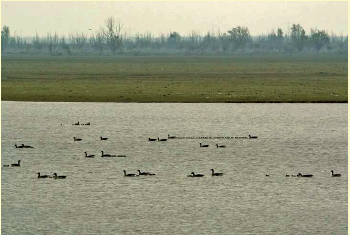
Als je een terrein op een bepaalde manier inricht, krijg je de diersoorten die daar bij horen. Een terreinbeheerder moet dus accepteren dat een ganzenparadijs ganzen aantrekt.

Van Bleker mogen ze vogelvrij verklaard worden. Al deze soorten beter beschermen kost niets, of nauwelijks iets. Een beroep op de onontkoombare bezuinigingen, zoals bij het afschaffen of beperken van de Ecologische Hoofdstructuur (EHS), geldt hierbij dus niet. Inmiddels gooit Bleker zijn tegenstanders af en toe een koekje toe, waardoor het lijkt of hij gevoelig is voor verstandige adviezen. Maar die toezeggingen waren natuurlijk allang ingecalculerd en erger nog: de praktijk zal er niet door veranderen en alleen de boeren profiteren er van. Smient, kolgans en grauwe gans worden niet op de jachtlijst geplaatst. Wordt er dan niet meer op geschoten? Natuurlijk wel, ze staan nu ook niet op de jachtlijst en er worden er jaarlijks misschien wel honderdduizend omgebracht. Het enige voordeel is voor de boeren: die kunnen alleen een schadeclaim indienen voor soorten, waarop de reguliere jacht nooit geopend wordt. Het Faunafonds redeneert dat als er volop geschoten en bestreden mag worden, schade voorkomen moet kunnen worden. Volop