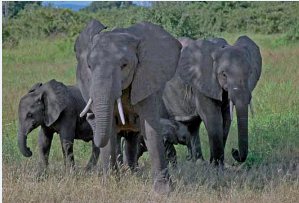
Hobbyjagers scheppen er een duivels genoeg in om dieren zonder enige reden overhoop te schieten en betalen grof om verre reizen te maken alleen om weer eens een ander soort dier te kunnen vermoorden.

Wat zijn dat nu voor mensen? Soms zijn ze van adel en stammen ze dus af van voorouders die ooit met veel succes geroofd en vermoord hebben. Het zit in de genen, die deugen niet. Maar waarom mensen die in het dagelijks leven een keurige en soms menslievende baan hebben in hun vrije tijd prachtige wilde dieren aan flarden gaan schieten, daar kan ik met mijn verstand niet bij. Dan toch maar liever een watje.