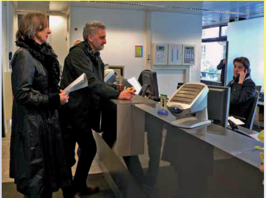
B. en W. van Arnhem bleken niet bereid de zaag van De Faunabescherming in ontvangst te nemen maar lieten dit, met enige tegenzin, over aan een woordvoerder.

Er komen dus nog drukke tijden aan voor de door ons bezochte gemeenten om alle illegale jachthutten te inventariseren en verwijderen. Met alle aandacht van de media voor onze acties beginnen ook de jagers onrustig te worden. De vernieling van een jachthut bij Geesbrug met explosieven en kogels wordt inmiddels door de wildbeheerseenheid Het Grootte Veld met onze actie in verband gebracht. Volgens de secretaris van de WBE is er aangifte gedaan bij de politie en is er sprake van een doelbewuste actie van bijvoorbeeld "anti-jachtmensen". In een reactie heeft De Faunabescherming aangegeven uitsluitend gebruik te maken van legale middelen en er vertrouwen in te hebben dat door het indienen van de handhavingsverzoeken de "illegale bouwwerken" door de gemeentelijke overheid verwijderd zullen worden en de bossen weer vrij toegankelijk zullen zijn.