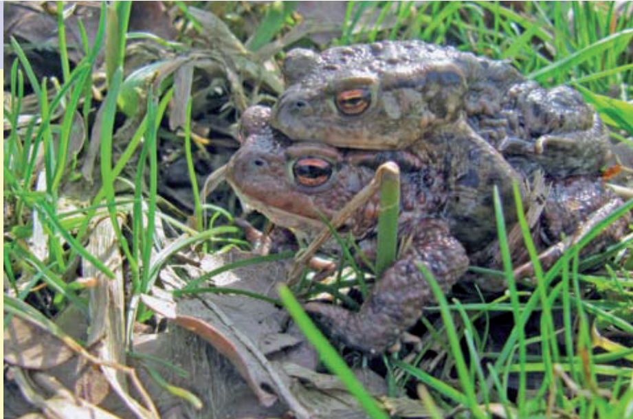
Algemene soorten, zoals egel en gewone pad, zullen onder de nieuwe natuurwet niet meer de bescherming krijgen waar zij recht op hebben.

Het gaat hier om de enige wet waarmee de bescherming van in het wild levende dieren is geregeld. Dat betekent dat deze wet dan ook daadwerkelijk de basisbescherming aan alle in het wild levende dieren zou moeten bieden. Helaas wordt nu zelfs aan deze basisbescherming gemorreld. Op grond van de Vogelrichtlijn is Nederland verplicht alle inheemse vogels als 'beschermd' aan te wijzen. Daar kan de minister dan ook niet onderuit. Voor overige gewervelde dieren als zoogdieren, reptielen en amfibieën wordt er in het concept voor gekozen uitsluitend die soorten als beschermd aan te wijzen die vallen onder de Habitatrictlijn en waarvoor dus ook een verplichting geldt, en soorten die in hun voortbestaan worden bedreigd. Algemene soorten, zoals konijnen, vossen, reeën, egels en bruine kikkers krijgen niet meer de algemene bescherming, waar zij in onze ogen recht op hebben. Voor deze soorten geldt niet meer het algemene verbod om ze opzettelijk te verontrusten of te doden. Voor deze soorten geldt alleen nog een 'zorgplicht'. Dat be-