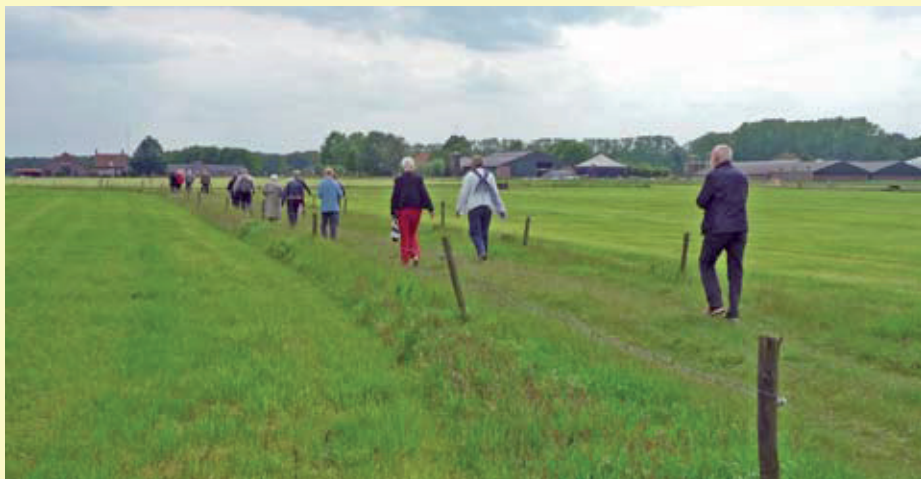
Vast onderdeel van onze jaarvergadering is de excursie, die ons ditmaal door het Brabantse boerenlandschap voerde.