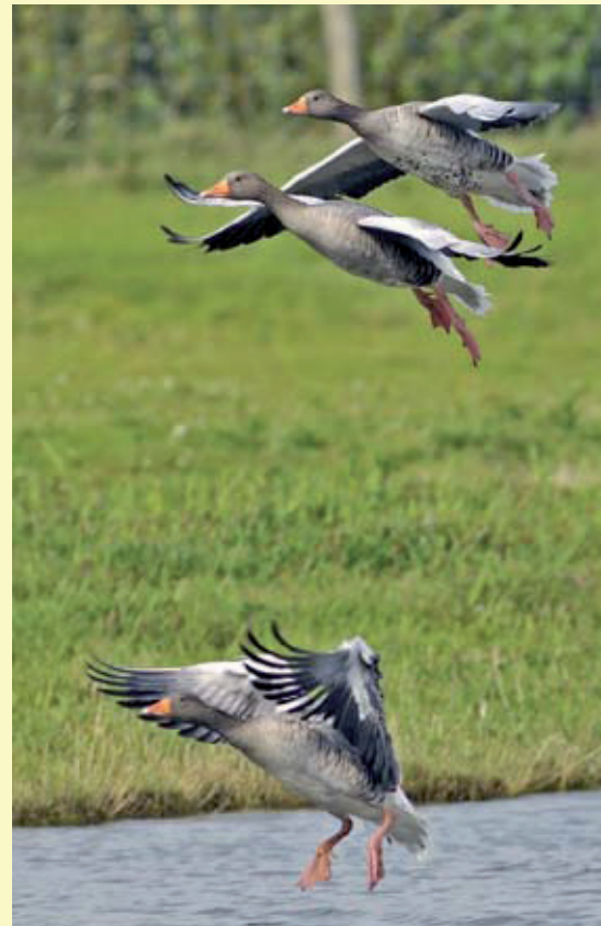
Grauwe ganzen. Harm Niesen.