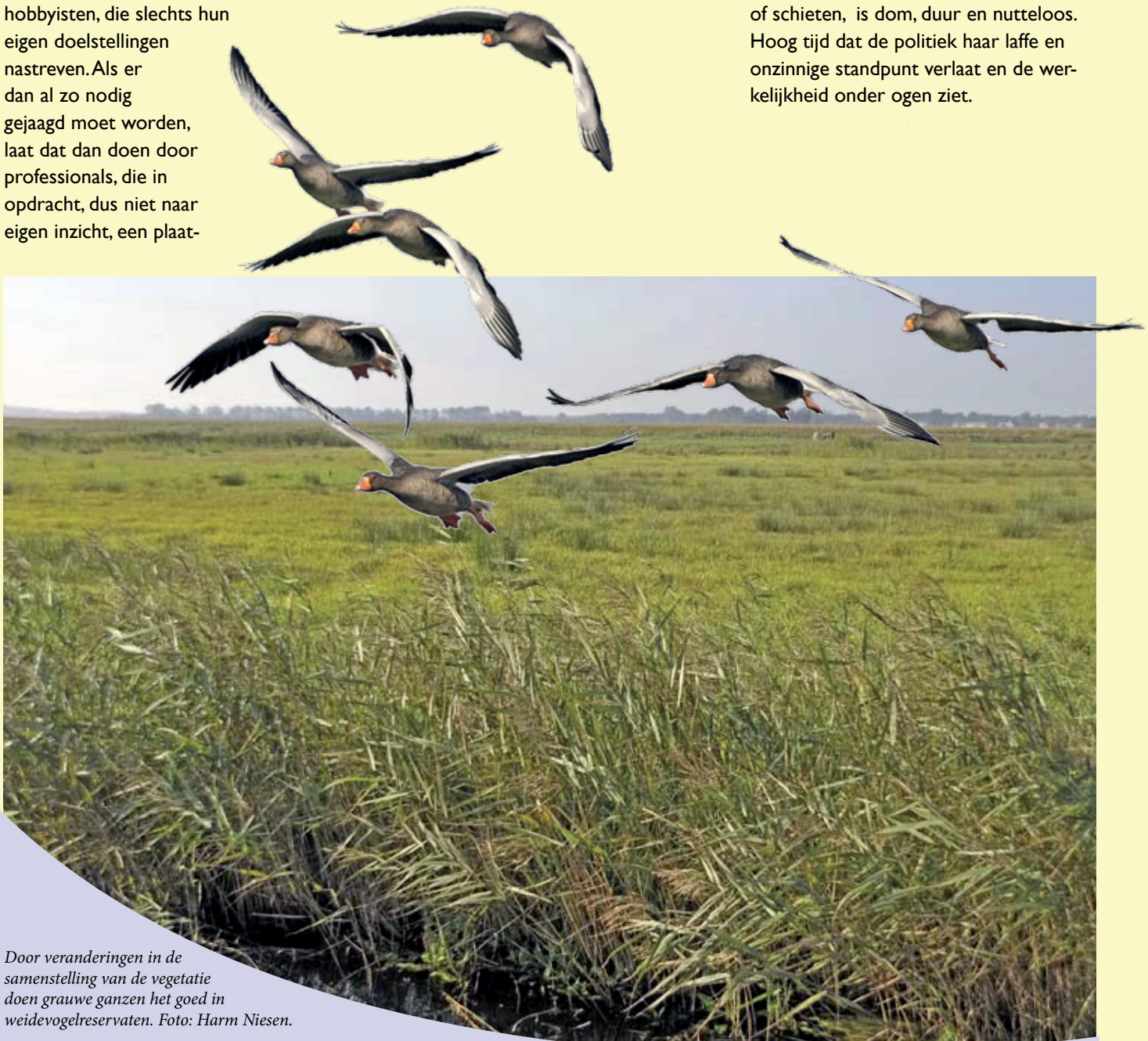
Door veranderingen in de samenstelling van de vegetatie doen grauwe ganzen het goed in weidevogelreservaten.

zijn hamsters het stapelvoedsel voor een groot aantal predatoren en zij varen er wel bij. Weidevogels redden door vossen te bestrijden? Agrarisch natuurbeheer? De waanzin ten top. De meest kwetsbare zogenaamde weidevogels, kempfaan en watersnip, zijn al vrijwel uit ons land verdwenen. Maar doen het uitstekend in de toendra, ondanks de aanwezigheid van veel meer (pool)vossen dan in onze weidegebieden. Onze weidevogelreservaten worden in toenemende mate beheerst door riet en zeggen. Weidevogels hebben daar de pest aan. Maar de grauwe gans voelt zich daar buitengewoon thuis en doet het dus goed. Zou het ooit doordringen tot de verantwoordelijke overheden? Je krijgt de diersoorten die horen bij het landschapstype dat je zelf hebt gemaakt. Beheer, bestrijding of schieten, is dom, duur en nutteloos. Hoog tijd dat de politiek haar laffe en onzinnige standpunt verlaat en de werkelijkheid onder ogen ziet.