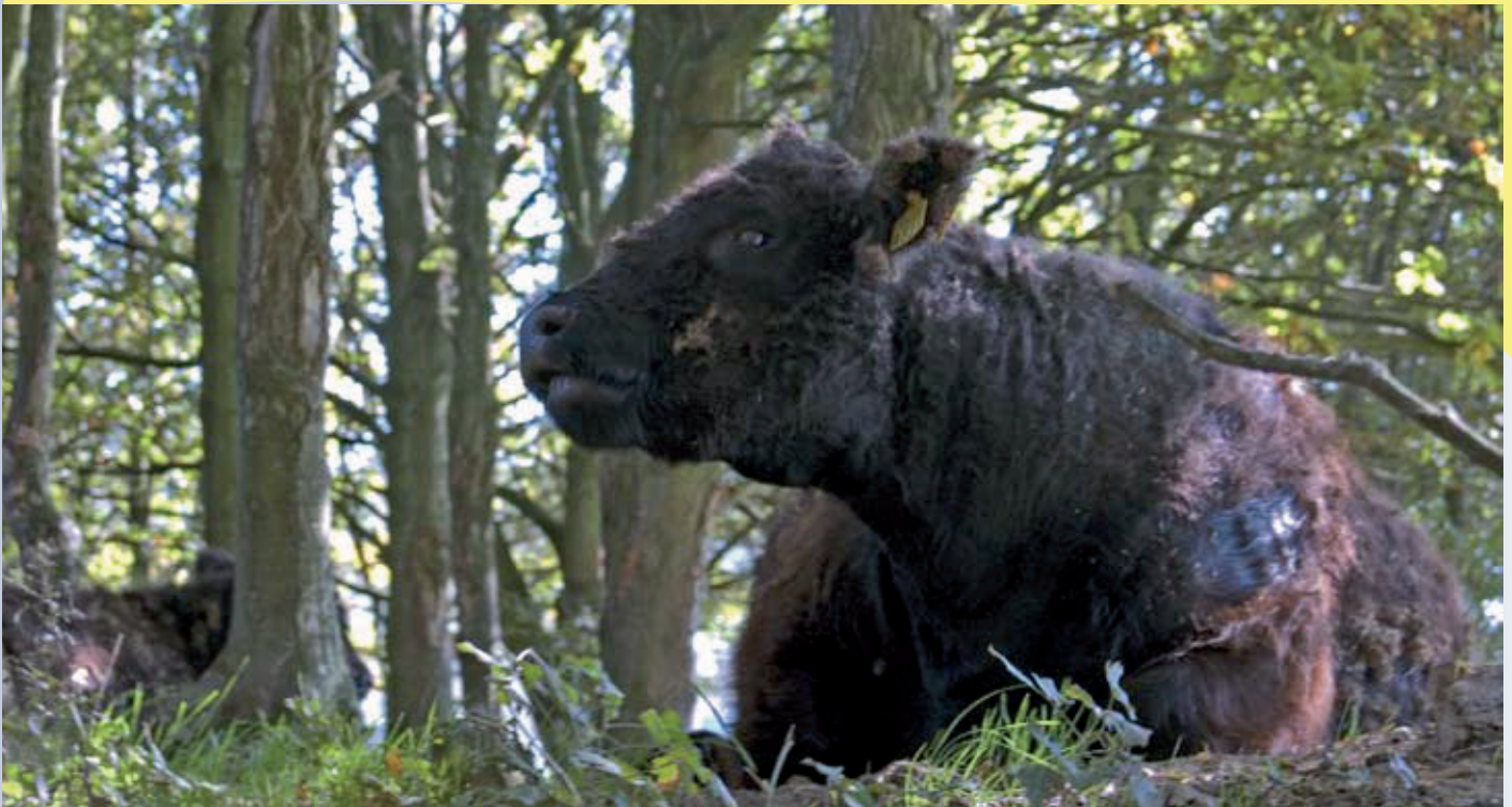
Volgens Natuurmonumenten produceren galloway's het natuurlijkste vlees van Nederland!

mingsorganisaties en vleesconsumenten. En zo worden eters van wild maar ook van wildernisvlees gebruikt om diverse andere hobby's en belangen te rechtvaardigen.