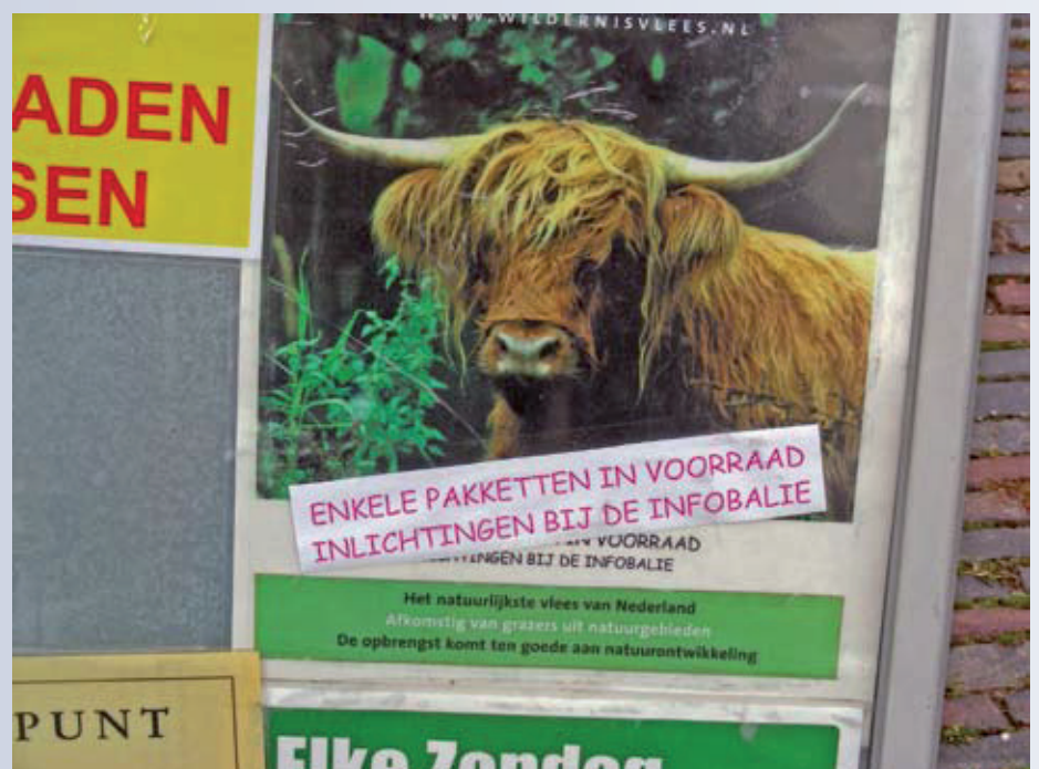
Wildernisvlees te koop...

aldus Hanos 'om haas voor een groter publiek bereikbaar te houden, importeert Hanos een goedkopere variant uit Argentinië'. Heeft de vraag naar wilde zwijnenvlees het aanbod doen stijgen de laatste decennia? En is dat leuk te combineren met de vraag naar jachtgelegenheid? Doet de vraag naar wildernisvlees het aanbod stijgen? En is dat natuurbeheer? U en ik zijn de consumenten. Wij bepalen de vraag. Vindt u dat het aanbod moet stijgen???