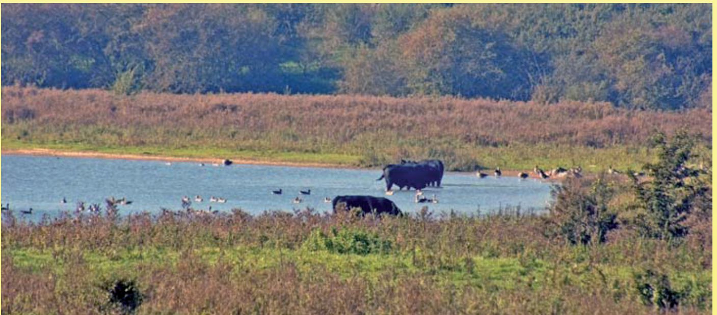
De Blauwe Kamer is één van onze natuurgebieden waar op grond van de Flora- en faunawet de jacht niet is toegestaan.

Wij verzoeken u daarom dit punt als onderwerp mee te nemen bij de besprekingen van een nieuw te vormen kabinet.