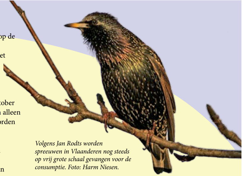
Volgens Jan Rodts worden spreeuwen in Vlaanderen nog steeds op vrij grote schaal gevangen voor de consumptie.

Vogelbescherming Vlaanderen heeft alle informatie omtrent de jachtwetgeving en de regels en jachttijden op haar website gezet