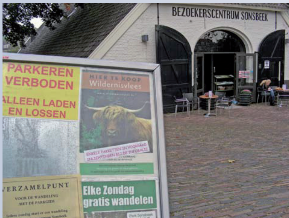
Het bezoekerscentrum Sonsbeek in Arnhem is één van de plaatsen waar het zogenaamde wildernisvlees te koop wordt aangeboden.

Het oudste natuurgebied van Natuurmonumenten rond het Naardermeer herbergt 100 galloway's. Volgens Natuurmonumenten het natuurlijkste vlees van Nederland. Pakketjes Natuurmonumentenvlees zijn af te halen in Nederhorst den Berg. Staatsbosbeheer handelt in hooglander-beef uit het Lauwersmeergebied, brandrode runderen die als grazer worden gebruikt in de uiterwaarden bij Beuningen en zet blaarkoppen