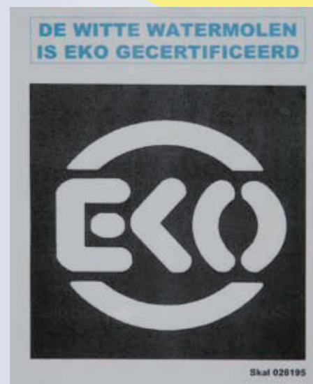
En toch “EKO” gecertificeerd??

Het begon allemaal in de jaren zeventig met het naar Nederland slepen van galloway's uit Schotland en konikpaarden uit Polen