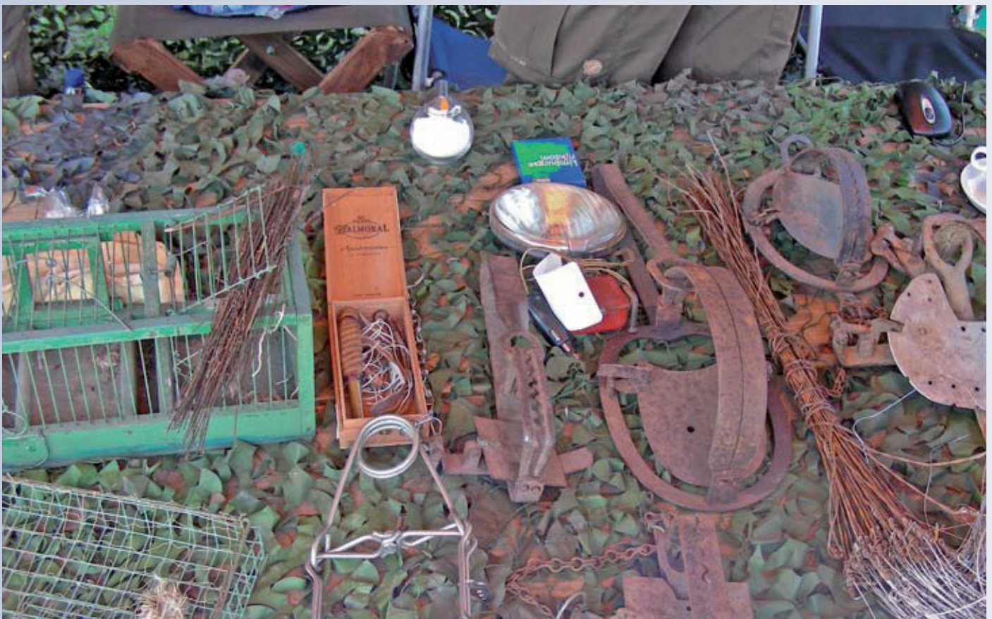
Verbazingswekkend dat in het Nederland van nu dit soort martelwerktuigen tegen dieren gewoon gebruikt mogen worden (zie tekst).

Het is jammer dat op natuurevenementen zoals deze, jagers de mogelijkheid wordt geboden om hun bloedsport te promoten. De kans voor De Faunabescherming om een tegengeluid te laten horen zijn we dus maar aangegaan. Niet gelukkig niet zonder resultaat. De kraam van De Faunabescherming werd druk bezocht door het publiek.