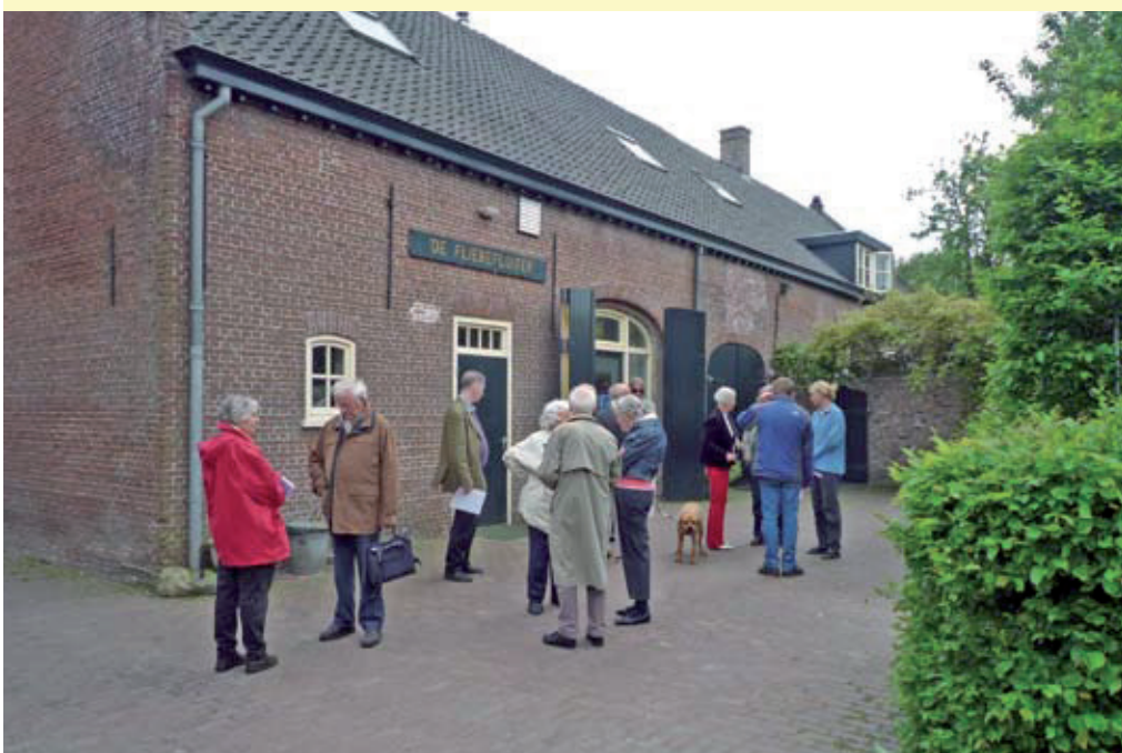
De jaarvergadering 2010 van De Faunabescherming vond plaats op de prachtige locatie De Flierefluit in Hilvarenbeek.

De voorzitter roept de aanwezigen op om het bestuur te steunen en mee te denken over een alternatieve natuurbeschermingswet. De Faunabescherming wil een echte beschermingswet opstellen, waarin vossen weer volledig worden beschermd en waarin geen ruimte wordt geboden voor groot-scheepse bestrijding van ganzen.