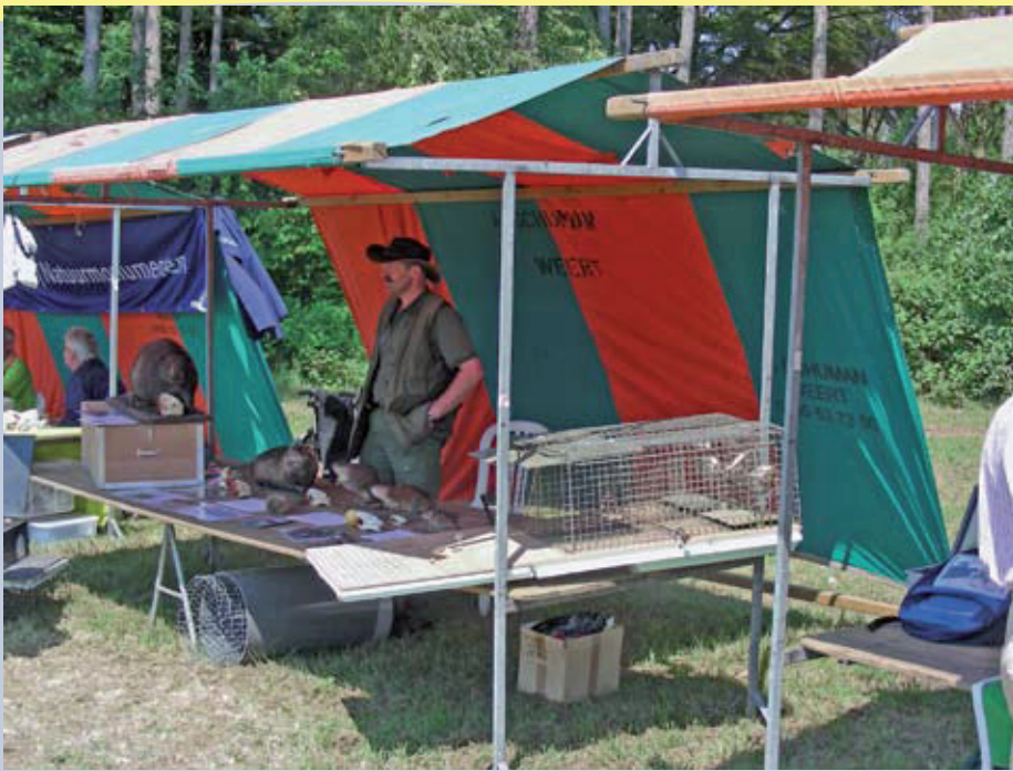
De stand van de muskusrattenbestrijders.

Ook De Faunabescherming was door de organisatoren uitgenodigd om deel te nemen aan Festa Natura. Op deze uitnodiging gingen we graag in en we hadden voor onze kraam het nodige informatie- en promotiemateriaal van onze stichting meegenomen. Want het gaat er natuurlijk om je boodschap zo duidelijk mogelijk aan het publiek