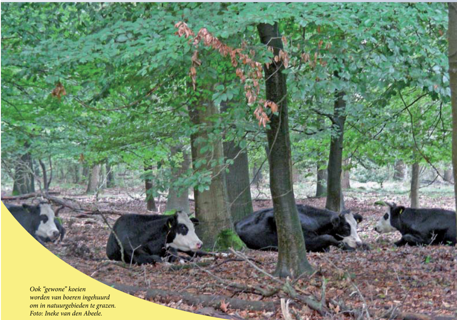
Ook “gewone” koeien worden van boeren ingehuurd om in natuurgebieden te grazen.

En dan de wilde zwijnen. Destijds naar Nederland gehaald door de Koninklijke familie als jachtwild. Nog steeds zijn de jagers eropuit om de drijfjacht, die sinds 2002 verboden is, met allerlei smoesjes weer legaal te maken. Afgezien van het jachtgenot is het wilde zwijn inmiddels als culinair evenement niet meer weg te denken uit restaurants op de Veluwe, althans, dat zeggen de belanghebbenden zoals jagers en restauranthouders, natuurbescher-