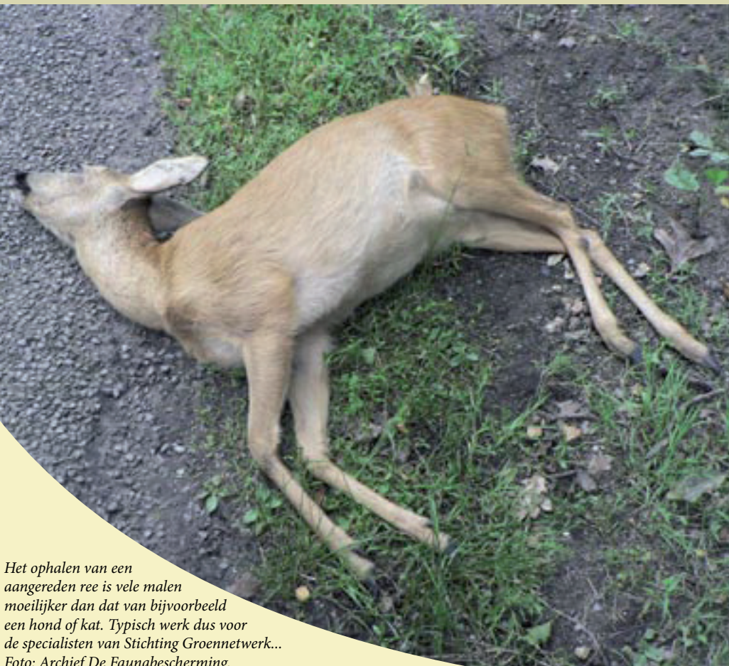
Het ophalen van een aangerezen ree is vele malen moeilijker dan dat van bijvoorbeeld een hond of kat. Typisch werk dus voor de specialisten van Stichting Groennetwerk...

De Faunabescherming heeft het ministerie van LNV met klem verzocht de onderhavige ontheffing met de meeste spoed in te trekken.