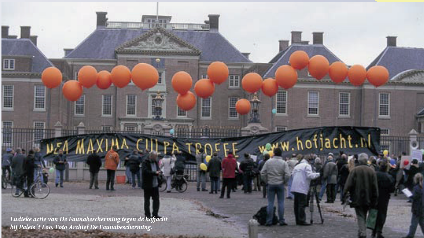
Ludieke actie van De Faunabescherming tegen de hofjacht bij Paleis 't Loo.