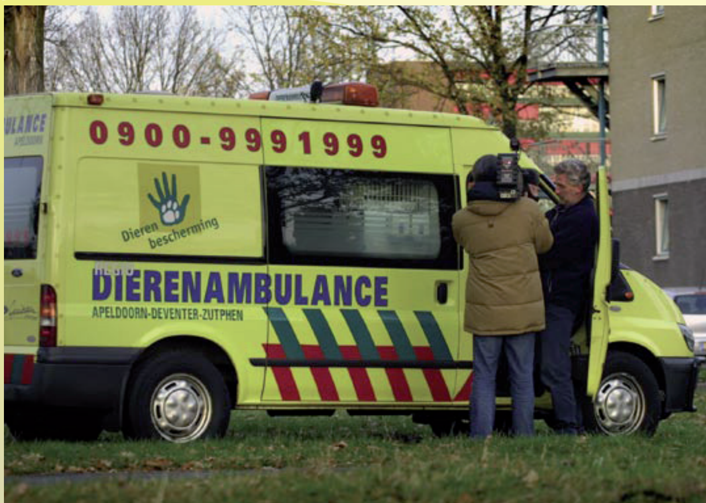
Dierenambulances, die vaak als eersten bij gewonde dieren worden geroepen, hebben te verstaan gekregen dat zij geen wild mogen vervoeren of helpen.

speet, Elburg, Oldebroek, Hattem, Heerde en Epe hebben zich aangesloten bij de stichting evenals particuliere terreineigenaren, aldus Groennetwerk.