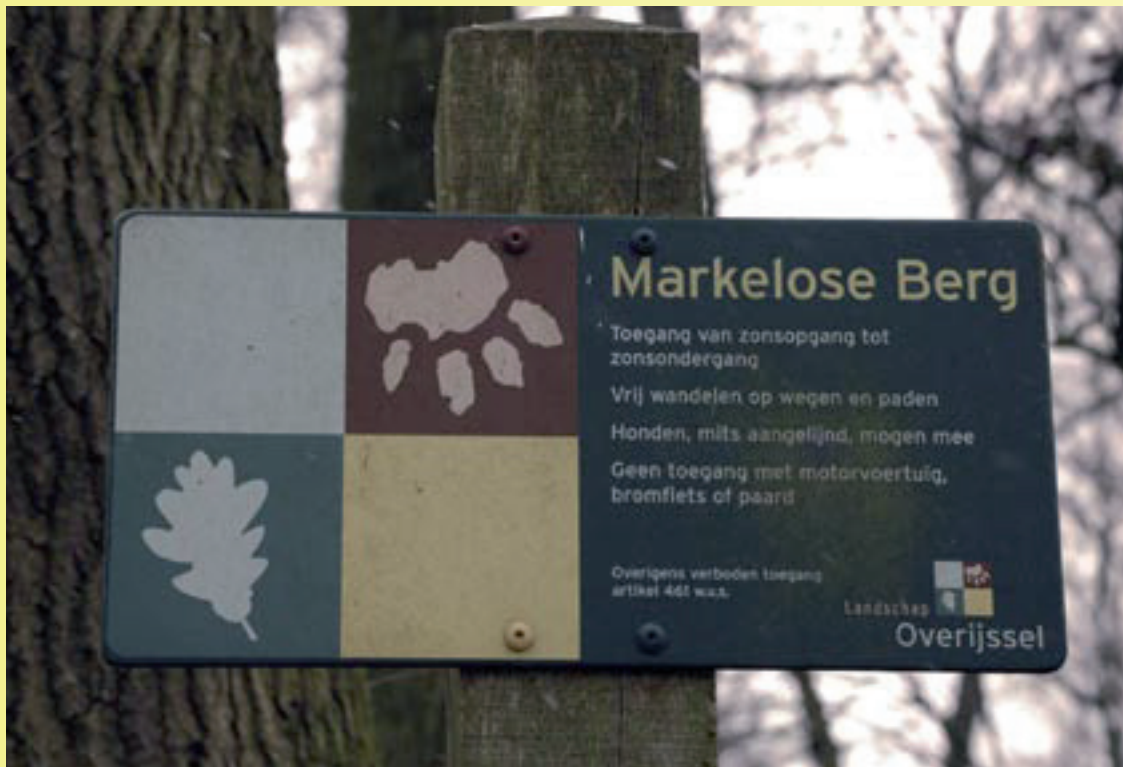
Natuurgebied De Markelose Berg wordt beheerd door Landschap Overijssel.

gronden van het Landschap. Desondanks is er op 8 november vorig jaar toch weer in dit gebied bejaagd. De werkgroep heeft het Landschap Overijssel om opheldering gevraagd en haar nogmaals verzocht zich te houden aan de gemaakte afspraken. Daarnaast heeft de werkgroep het het Landschap gevraagd om het huurcontact jacht op de Markelose berg, dat volgend jaar afloopt, niet meer te verlengen.