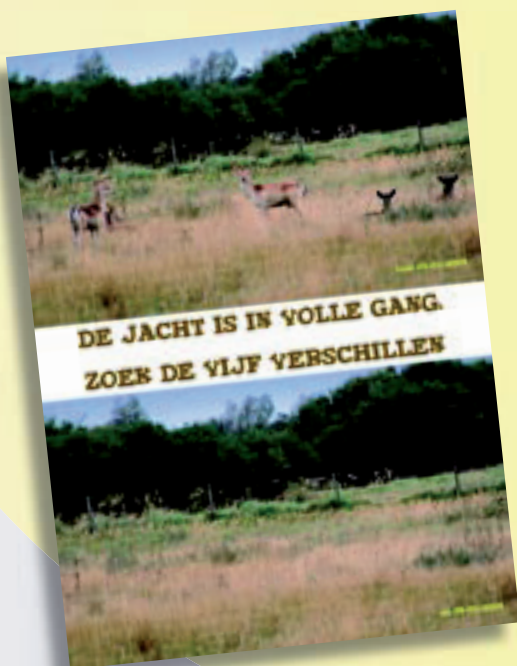
Flyer Partij voor de Dieren, afdeling Zeeland, naar aanleiding van de afschotvergunning voor damherten in de Kop van Schouwen. Het ontwerp is van Deen Guldemond.

De jagers beweerden echter dat er in het voorjaar precies 768 damherten aanwezig waren en dat het er inmiddels 1037 moeten zijn. Dit aantal komt namelijk mooi overeen met de stelling van de jagers dat damhertpopulaties zich elke twee jaar, ongeacht de