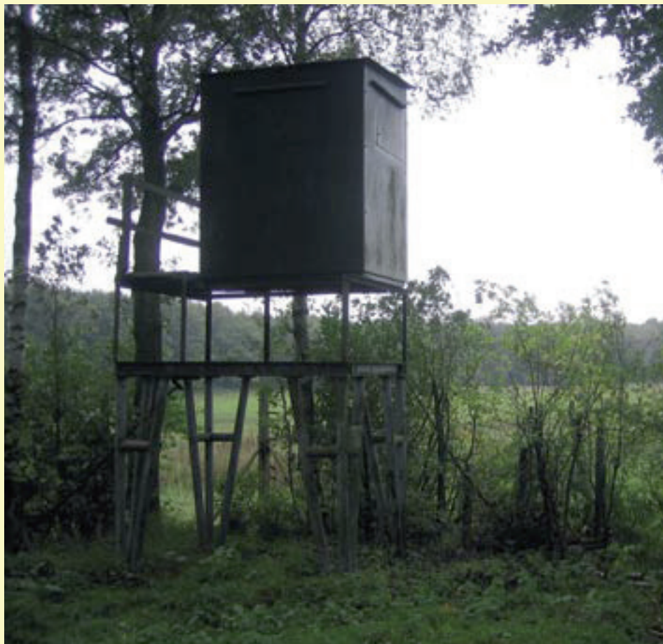
Jachthut van de DSM-jagers op het Meinwegplateau, Midden-Limburg.

Het meest ernstig is misschien nog wel dat jagers met opzet een ander genetisch type everzwijn in de natuur brengen dan dat er van oorsprong voorkomt. Zo is het Meinwegzwijn een inheems en genetisch uniek type. Vermenging met gefokte ondersoorten tast dit ecotype aan. Daarnaast zadelen de jagers de boeren op met een probleem door moedwillig everzwijnen uit te zetten in en nabij het boerenland. Door 'tamme' dieren uit te zetten veroorzaken zij opzettelijk onveilige situaties voor weggebruikers. Uit de afschotcijfers in de 0-optiegebieden blijkt ook dat de jagers niet doen aan shade beheer maar aan jacht beheer. Zo zijn de afschotaantallen al enkele jaren redelijk stabiel terwijl jagers en boeren in 2007 groot alarm sloegen over de enorm hoge aantallen everzwijnen in Midden-Limburg 1 . Een teken dat ze bewust