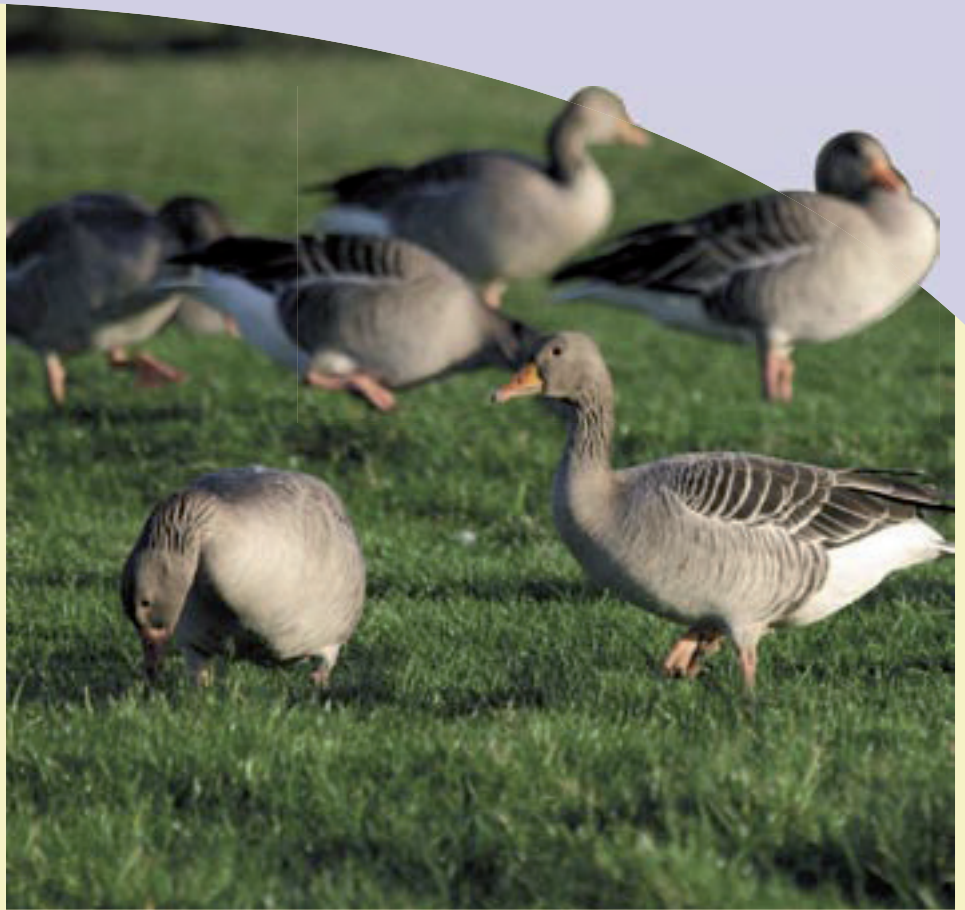
Als ze met rust worden gelaten zullen grauwe ganzen zich veel meer over de graslanden verspreiden. Verjagen kost energie en is dus contraproductief als het gaat om schadebestrijding in landbouwgebieden.

Wie nu denkt dat alles naar wens verloopt, heeft geen idee van de wensen van boeren en jagers én van de ganzen. Allereerst is de opvangcapaciteit volkomen verkeerd ingeschat en veel te beperkt. Daarnaast zijn er provincies, zoals Noord-Holland, die het vertikken gevolg te geven aan de noodzaak voldoende verspreid in de provincie gedooggebieden aan te wijzen. Daar moet een gans in de kop van de provincie 50 km vliegen naar het dichtstbijzijnde opvanggebied! Maar ook in de opvanggebieden is het chaos. Vanaf de