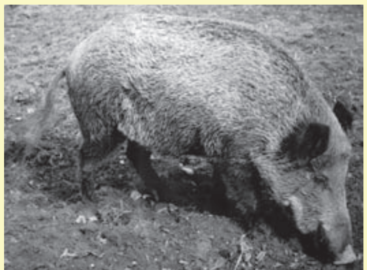
Alterra toont met genetisch onderzoek aan dat er in de 0-optiegebieden andere varianten van het wild zwijn rondlopen dan in het Meinweggebied. Het 'Stassenzwijn' (links) vertoont andere uiterlijke kenmerken dan het Meinwegzwijn.