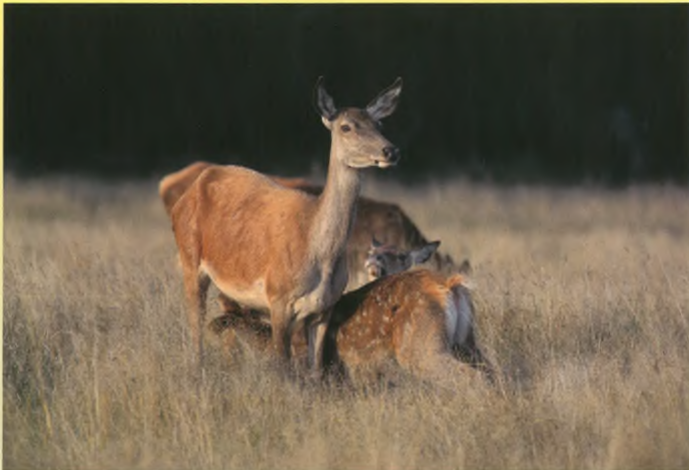
Hinde met kalf.