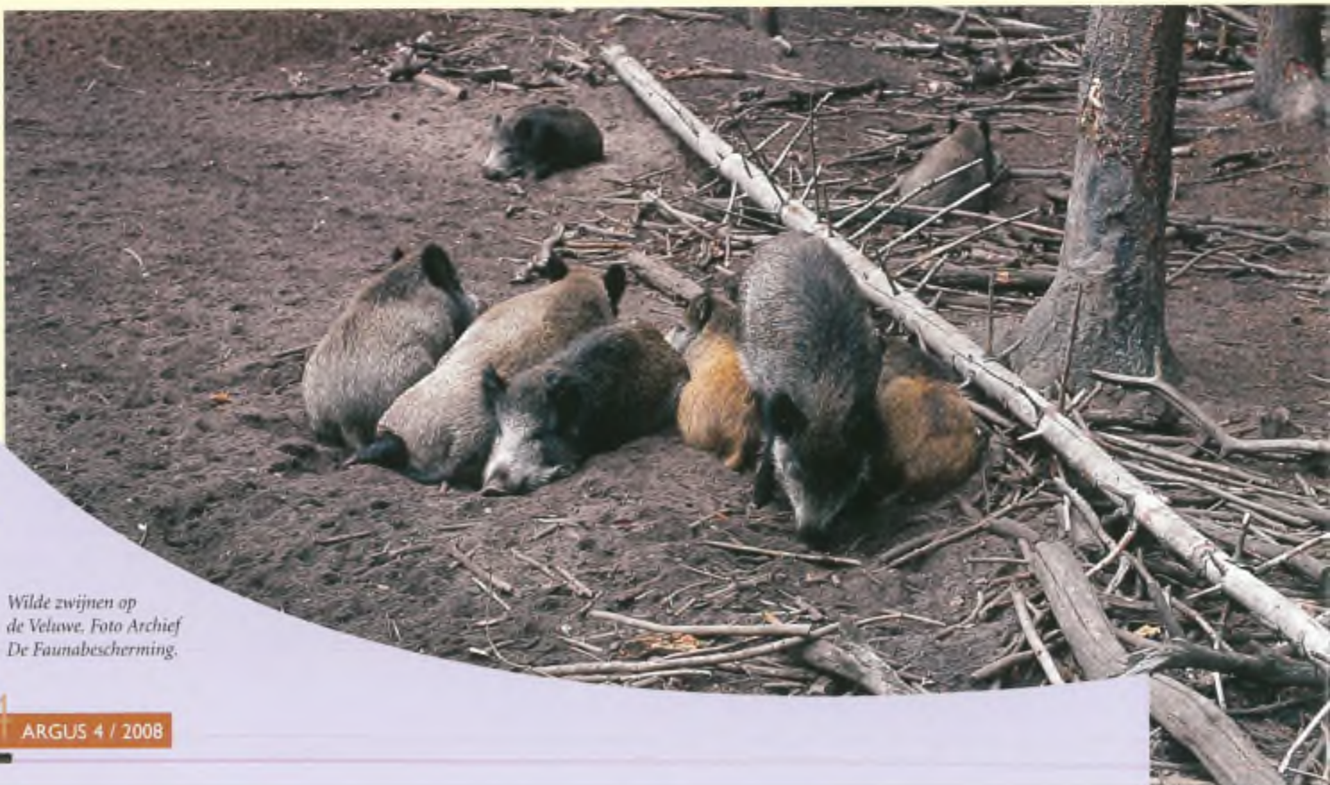
Wilde zwijnen op de Veluwe.

Op de Veluwe zou plaats zijn voor 860 wilde zwijnen. Dit is sinds 2004 het gevoerde beleid in de provincie Gelderland. Dat betekent dat er in een gebied ter grootte van 2.000 voetbalvelden minder dan 20 wilde zwijnen mogen leven. Dat is natuurlijk absurd. Daarnaast is gebleken dat vrijwel zeker 3.500-4.000 wilde zwijnen de afgelopen winter hebben overleefd. Als er geen plaats zou zijn voor veel dan meer 860 dieren dan zou dat nooit mogelijk zijn geweest. Ook onderzoeksinstituut Alterra geeft aan dat op de Veluwe zeker 2.500 wilde zwijnen kunnen overleven en dat het getal 860 is gebaseerd op niet representatieve aannames (Alterra, 2002). Staatsbosbeheer is zelfs van mening dat er op de Veluwe nog genoeg leefruimte is voor de wilde zwijnen, ook als de populatie groeit. Ecologen uit Groningen en Wageningen achten een natuurlijke draagkracht van de Veluwe van tenminste 7.000 wilde zwijnen heel goed denkbaar. Overigens wordt het afschot bepaald op basis van telgegevens die worden aangeleverd door jagers. Dat de telcijfers erg onbetrouwbaar zijn blijkt wel uit het feit dat er in juni 2007 zeker 6.500 wilde zwijnen op de Veluwe moeten zijn