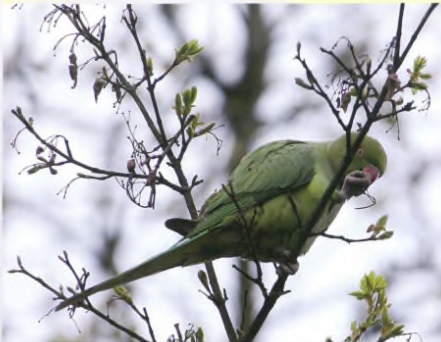
De halsbandparkiet heeft zich sinds enkele decennia als broedvogel in Nederland gevestigd. Net als bij andere exoten is de bestrijding ervan zinloos en kan de energie beter worden gestoken in het aan banden leggen van de handel in uitheemse diersoorten.

één van de vele predatoren draagt dan ook op geen enkele manier bij aan het verhogen van het broedsucces van de weidevogels. En dan hebben wij het nog niet eens over het feit dat deze landelijke vogelvrijverklaring niet zal bijdragen aan het daadwerkelijk verlagen van de aantallen vossen. Als er lokaal al een probleem zou zijn met predatie dan zal er door middel van maatwerk op moeten worden gereageerd en daar draagt een landelijke vrijstelling in ieder geval helemaal niets aan bij.