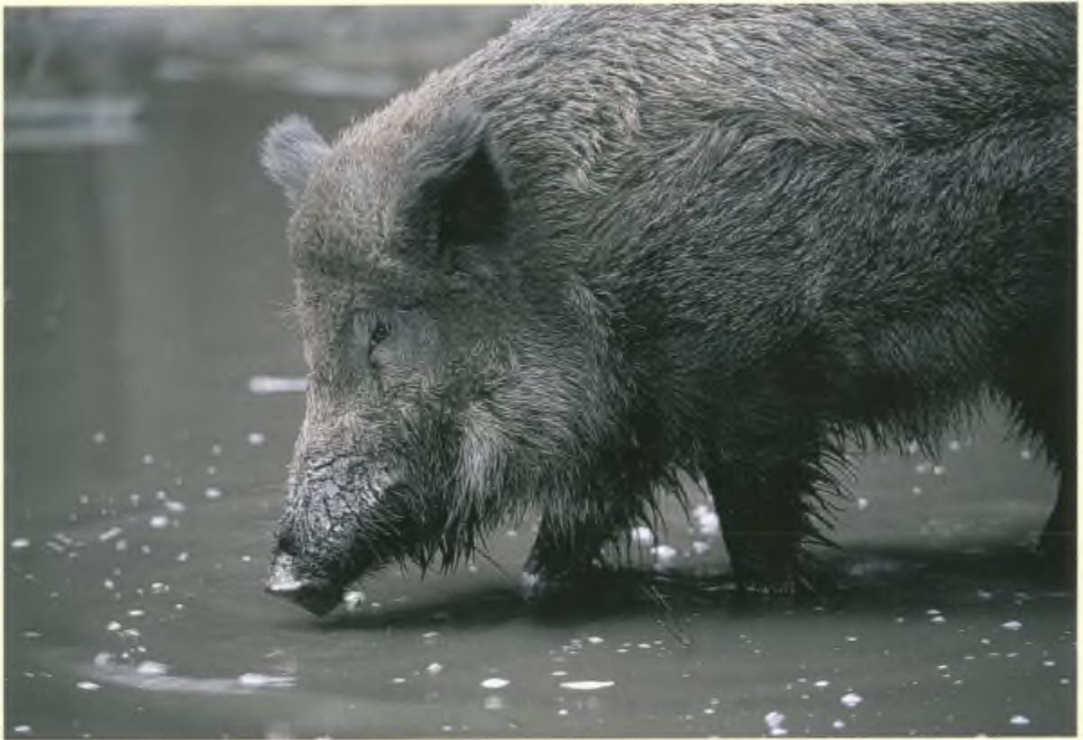
De jachtdruk op de wilde zwijnen op de Veluwe is zo hoog, dat de dieren niet meer de rust hebben om op hun gemak een modderbad te nemen.

Wilde zwijnen zijn sociale dieren die het liefst in groepsverband leven. Op basis van 'weidelijkheidsregels' worden jagers aangespoord om het verstoren van sociale verbanden waar mogelijk te voorkomen. Maar door wie wordt dat gecontroleerd? Het is niet bekend wat de sociale gevolgen van het afschot voor de wilde zwijnen zijn. Maar door de huidige jacht trekken wilde zwijnen nu meestal alleen of als twee- of drietal rond. Sinds anderhalf jaar laten wilde zwijnen ook