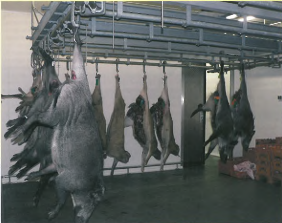
De wilde zwijnen slagerij, de "wildfabriek", van de Hanos in Apeldoorn.

De provincie Gelderland doet flink mee aan dit succesverhaal door jaar in jaar uit genoeg te nemen met volstrekt onbetrouwbare, door jagers geproduceerde tel- en afschotcijfers en deze klakkeloos goed te keuren. Vervolgens verleende de provincie op grond daarvan ontheffingen voor afschot. Waar