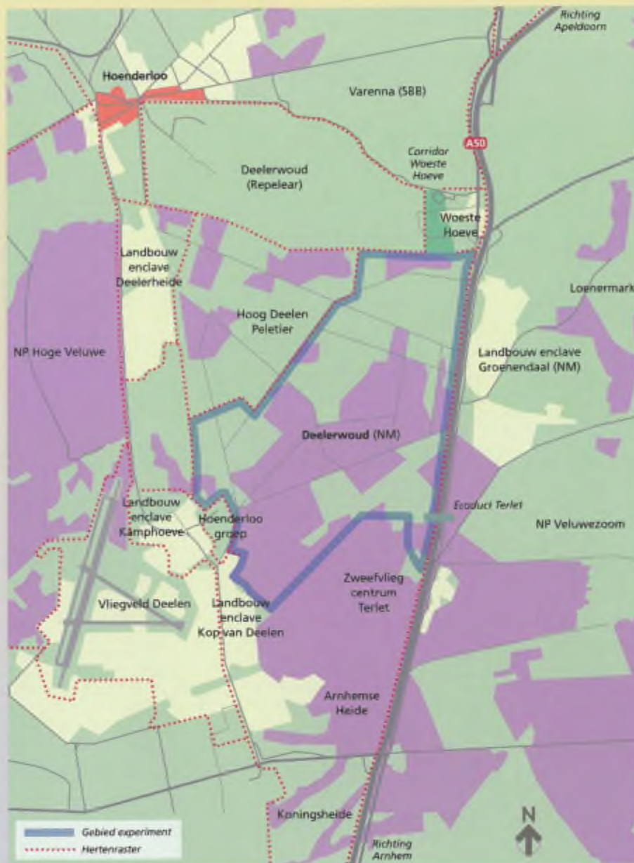
Figuur 1. Het Deelerwoud bestaat uit bos- en heidelandschap. Het leefgebied van herten wordt grotendeels begrensd door hertenkerende rasters.