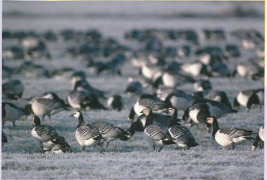
In het vorige nummer van Argus is uitgebreid ingegaan op de ganzenvangacties op Texel en in de provincie Utrecht, waar onder meer brandganzen het slachtoffer van waren.

De provincie Noord-Holland heeft inmiddels een nieuw beleidsplan gemaakt, waarin alsnog alle ruimte wordt geboden voor bestrijding van broedpopulaties ganzen inclusief vangen en vergassen. Hiermee negeert de provincie halsstarrig de publieke opinie. Wij begrijpen nu ook op welke manier deze provincie gaat voorkomen dat de toestem-