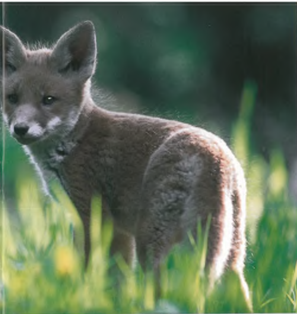
Van de volledige bescherming, die de vos krachtens de Flora- en faunawet zou moeten gemeten, is vrijwel niets meer over.

kele partij na is politiek Den Haag van mening dat we in Europa lang genoeg voorop gelopen hebben met de wetgeving op het gebied van de natuurbescherming. Daarom wordt er nu geïnventariseerd hoe het precies in andere landen van de EU geregeld is. En moeten we ons gaan aanpassen aan het beschermingsniveau in die andere landen. Zonder veel tegenspraak drong een meerderheid van de 2 e kamer er op aan de regels uit Brussel te respecteren, maar ook niet meer dan dat. Nederland kan niet om de eisen van de Vogelrichtlijn en de Habitatrichtlijn heen en zal zich daar aan houden. Ook met Rode Lijst-soorten zal, voor zover dat niet al in de Richtlijnen gebeurt, rekening worden gehouden. Maar die Rode Lijst moet wel regelmatig geëvalueerd worden, want mocht de bescherming resultaat afwerpen, dan moet een soort er ook snel weer af kunnen worden gehaald. En moet zijn speciale bescherming vervallen. De Vogelrichtlijn is nu 30 jaar oud en is volgens de Kamerleden hard aan een herziening - lees: versoepeling van de voorschriften - toe. Nu is het gelukkig vrijwel onmogelijk de status van een vogelsoort ingrijpend te veranderen. Soorten die indertijd in een land niet als bejaagbaar zijn aangemeld, kunnen dat ook niet snel meer