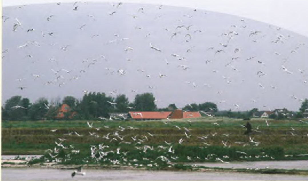
De vredige rust wordt wreed verstoord en grote sterns vliegen massaal op zodra de eerste faunabeheerders' van Duke het natuurgebied binnenstampen.

rist gedragende, "Handhaver" van de provincie Noord-Holland. Ingevolge de verleende ontheffing dient er bij het vangen en doden van de dieren namelijk overheidstoezicht aanwezig te zijn. Wat dat onder het zoveelste kabinet Balkenende dan ook nog voor moge stellen! Want het zal nu al wel duidelijk worden dat hun normen ónze waarden niet zijn. En omgekeerd uiteraard! Maar wij houden ons in elk geval wél aan de wet!