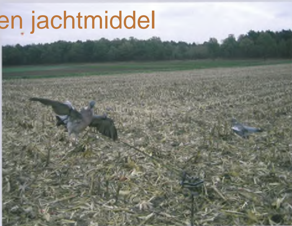
Duivencarrousel met geprepareerde houtduiven.

Alleen lokvogels zijn toegestaan, lokinstrumenten zijn verboden. Ook het argument dat de carrousel zou worden ingezet voor schadebestrijding en niet voor jacht wordt door het Gerechtshof Benelux van tafel geveegd. Het Gerechtshof laat weten dat de scheiding die de huidige Nederlandse wetgeving aanbrengt tussen jagen en schade-