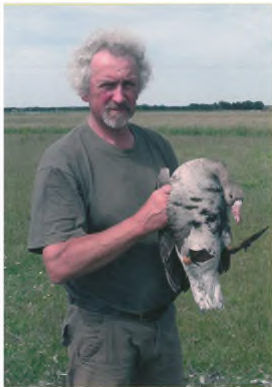
Na het vertrek van Duke worden door ons meerdere gewonde ganzen aangetroffen. Van nazoeken door vangers en beheerders bleek geen sprake te zijn!

verhoeds kijken we tegen de woorden LEBENDE TIERE aan! Als we het al niet dachten! Sinds het aantreden van boer Veerman heerst er bij Natuurmonumenten kennelijk dezelfde onverbloemd totalitaire sfeer die destijds tekenend was voor de Wageningse Universiteit en haar instellingen. En voor het ministerie van LNV! De tractor stopt vlak naast de kraal, waar-