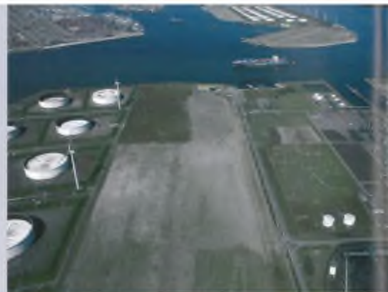
De brede strook grond in het midden van de foto van ruim 60 ha. is één van de belangrijkste broedlocaties. Deze wordt nu aan alle kanten bedreigd.