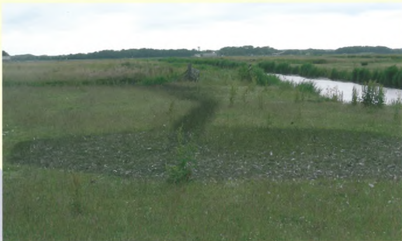
De ganzen werden door een diepe, stinkende moddersloot gedreven, waardoor er een baggerzwart spoor achterbleef op de Plaats Delict.

Van enig cachet was echter in het geheel geen sprake meer zodra de daadwerkelijke verlading van de gevangen dieren een aanvang nam. Alsof het een reeds dode berg afval betrof werd er met de weerloos en ziek van angst aan gewetenlozen opruimers