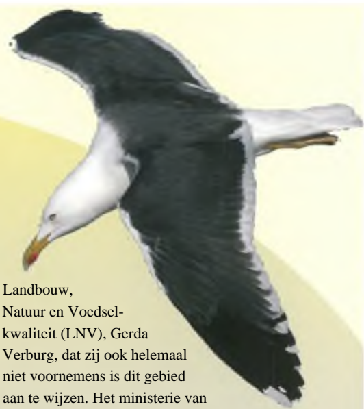
Kleine mantelmeeuw, paartje, op de 2e Maasvlakte.

Het argument van het ministerie om dit 100 hectare criterium te hanteren is dat daarmee wordt voorkomen dat gebieden worden aangewezen waarvan de bescherming niet kan worden gegarandeerd. De minister doelt daarbij bijvoorbeeld op een tijdelijk zanddepot of een bouwrijp gemaakt terrein. Tijdens de zitting bij de Raad van State hebben wij gesteld dat dit door het ministerie gehanteerde extra criterium van 100 ha natuurgebied strijdig is met de jurisprudentie van het Europese Hof en tevens strijdig is met de uitgangspunten en het doel van de Vogelrichtlijn. De bedoeling van het aanwijzen van de belangrijkste gebieden als SBZ is uiteraard om de vogels die van deze