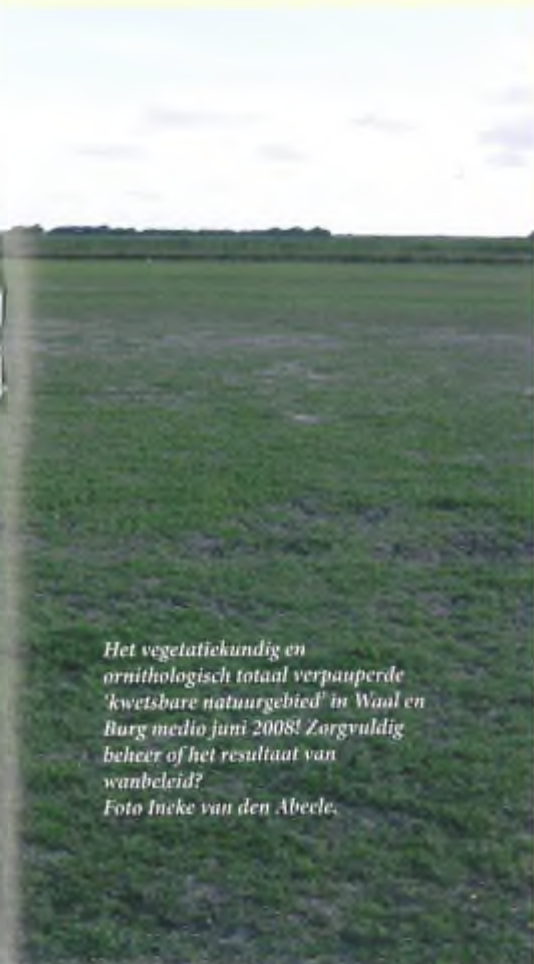
Het vegetatiekundig en ornithologisch totaal verpauperde 'kwetsbare natuurgebied' in Waal en Burg medio juni 2008! Zorgvuldig beheer of het resultaat van wanbeleid?

Over de veldweg komt een tractor met een hoge, lange veewagen aanrijden, die met een wijde boog het natuurgebied in draait. On-