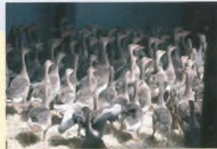
In de schuren waar de dieren na het vangen worden opgesloten, blijken ze soms dagenlang zonder eten en drinken op hun dood te moeten wachten.

Vrijdagmiddag 13 juni 2008, rond de klok van vier uur. In het volgens bordjes 'kwetsbaar natuurgebied' in het zuidoosten van de Polder Waal en Burg op Texel lopen drie mannen rond, terwijl er zich bij enkele terreinauto's en twee personenwagens die langs de smalle polderweg geparkeerd staan, nóg een vijftal personen bevindt. Merendeels in stemmig veldgroen gekleed. Daar zal het dus wel gaan gebeuren! Wij zijn met een kleine delegatie van De Faunabescherming naar Texel gereisd vanwege de mens- en dieronterende vergassingsacties waarmee Staatsbosbeheer, Natuurmonumenten en de provincie Noord-Holland zich willen ontdoen van duizenden grauwe ganzen. De Texelse Entlösung dient als proefballon om te onderzoeken of er tot in de uithoeken van ons vaste land niet ook met grof geweld tienduizenden van deze vogels kunnen worden geruimd. Bestuurlijk laat het zich gemakkelijk raden hoe Natuurmonumenten en het geprivatiseerde Staatsbosbeheer tot deze on geciviliseerde 'beleidslijn' zijn gekomen. Maar daarover later méér.