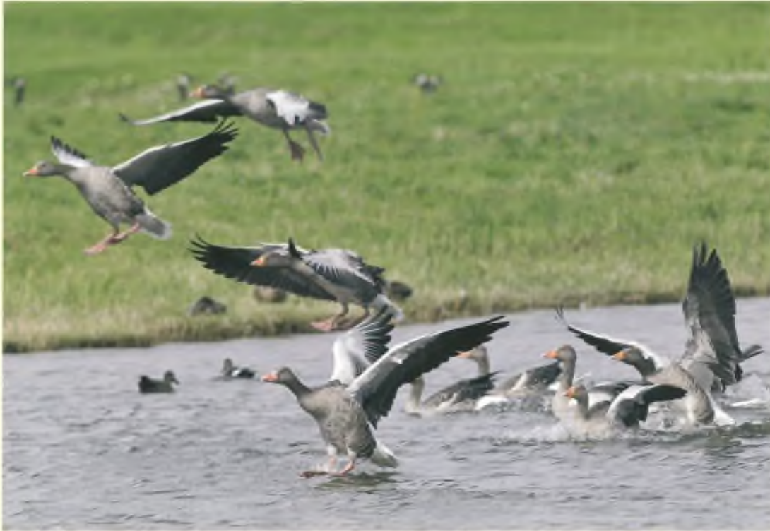
Grauwe ganzen strijken neer in het natuurgebied.

de lurven te vatten en breeduit aan de kaak te stellen. Dit alles uiteraard op verbale of ludieke wijze. Dat zullen de diervijandige verantwoordelijken al snel ondervinden!