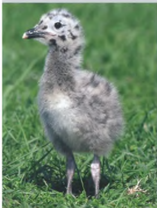
Mantelmeeuw, kuiken.

Wij waarschuwen het Havenbedrijf echter voor het feit dat hoewel ze kennelijk liever geen rekening willen houden met de aanwezigheid van deze vogelsoort ze daar wel toe gedwongen zullen worden. Ondanks het gebrek aan bescherming heeft de kleine mantelmeeuw zich stevig gevestigd in dit havengebied. Dat is ook logisch gezien de binding van deze vogel met de zee als foerageergebied. Als gevolg van de aantasting van de oorspronkelijke broedlocaties die zich in de open ruimte tussen de bedrijven in bevonden, hebben grote aantallen meeuwen inmiddels al hun toevlucht gezocht op de bedrijventerreinen zelf. Een deel van de vogels is zelfs uitgeweken naar de stad Rotterdam en broedt daar op de daken. Op dit moment wordt de hele toekomstige 2e Maasvlakte volgepland met bedrijven en infrastructuur. Wij voorspellen dat zodra er ruimte op de 2e Maasvlakte ontstaat de kleine mantelmeeuwen deze ongetwijfeld zullen gaan benutten. Om te voorkomen dat de vogels de bedrijfsvoering gaan hinderen of op plaatsen gaan zitten waar zij tot overlast zouden kunnen leiden is het alleen maar verstandig om ook ruimte te creëren voor deze vogels en andere diersoorten die ongetwijfeld zullen verschijnen. Daar zal bij de inrichting van dit gebied nu al rekening mee moeten worden gehouden.