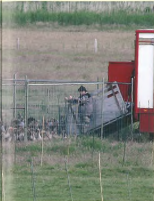
De grauwe ganzen worden in een veewagen gedreven om elders vergast te worden.

overgeleverde dieren omgesprongen. De ganzen dromden samen in een hoek van de nauwe kraal en poogden tegen het hoge gaas op te klimmen. Veren en dons stoven in het rond. Bloedspoen van de weke ruiveren braken en sprongen duizendvoudig open. Dik zeshonderd vijftig dieren beleefden hun laatste momenten vóór de gaskamers van het "Natuurbeheer Nieuwe Stijl" zodoende op een wijze die men zelfs zijn grootste vijanden niet zou toewensen. En de hartverscheurende doodskreten van oude ganzen die zelfs toen nog hun jongen poogden te beschermen tegen de door Natuurmonumenten, Staatsbosbeheer en provincie Noord-Holland ingehuurd ruimers, deden mij twijfelen tussen een spontane en