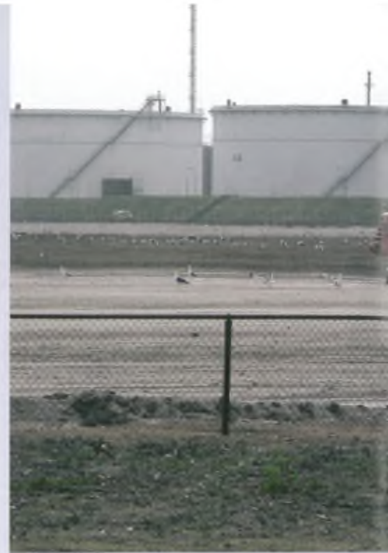
Onthutst blijven de meeuwen achter op hun kaalgeschoren broedterrein.

was dat de paarden de aanwezige vegetatie zouden begrazen en door betreding meer variatie in de vegetatie zouden aanbrengen. Daarmee zou het terrein minder geschikt worden gemaakt voor de meeuwen en zouden de vogels uiteindelijk verdwijnen. Dat was uiteraard het uiteindelijke doel. De Faunabescherming heeft hiertegen heftig geprotesteerd. Wij hebben aangifte gedaan bij de politie, waarbij wij aangaven dat het opzettelijk verontrusten van deze vogels en het vertrappen en verstoren van hun nesten en legsel op grond van de Flora- en faunawet verboden is. Het Havenbedrijf had voor deze verboden handelingen geen ontheffing van de minister van Landbouw, Natuur en Voedselkwaliteit ontvangen. Na verloop van tijd bleek echter dat de meeuwen zich niet veel van de paarden aantrokken en gewoon doorgingen met broeden en dat deze actie dus niet het gewenste effect had. De paarden werden uiteindelijk verwijderd.