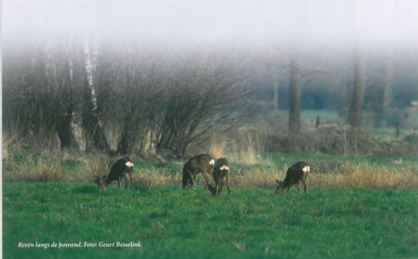
Reeën langs de bosrand.

H oeveel reeën er in Nederland leven weet niemand. Zelfs de jagers weten het niet hoewel ze dat wel pretenderen. Maar elke ree die zich in ons land bevindt behoort de jager toe. Zoveel is zeker. Levend vormen ze de stoffering van het landschap, waar menige jager natte dromen van krijgt, vooral gedurende de bokkenjacht. Dood vinden ze gretig aftrek op gewei en plankjes boven de open haard of voor de culinaire trek. Kortom, Nederlandse reeën zijn geprivatiseerd.