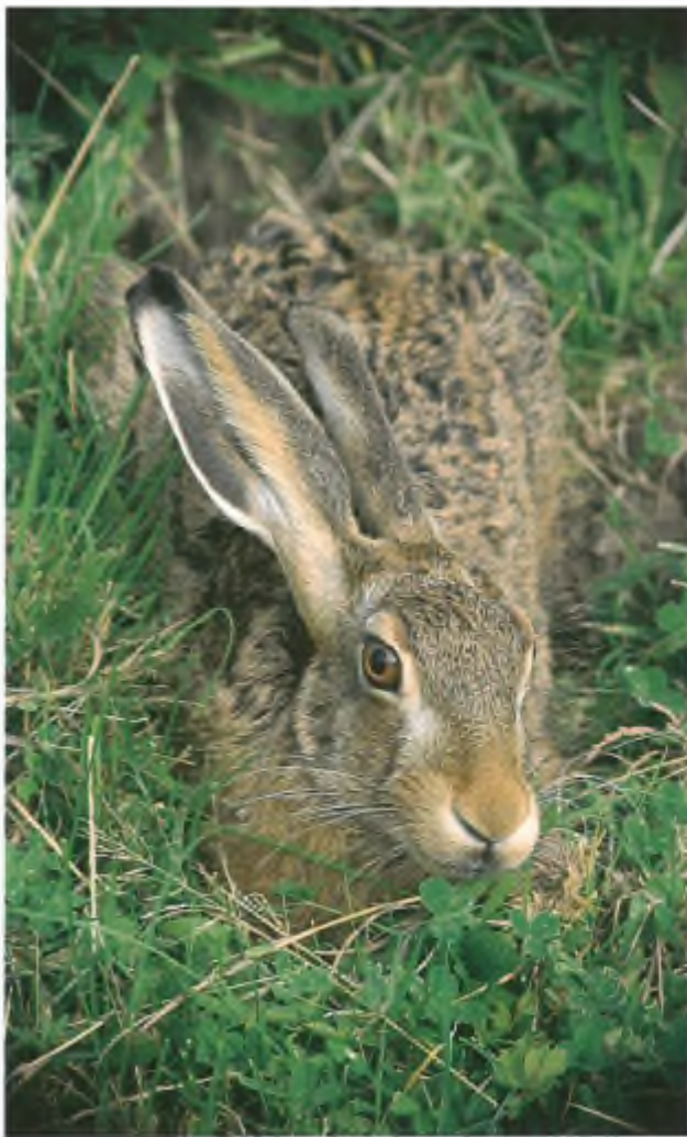
In een groot deel van Noord-Holland zijn ontheffingen verleend om hazen te schieten.

Noord-Holland met betrekking tot ganzen en smienten in de winter heel anders. De vogels mogen overal buiten de aangewezen foerageergebieden direct worden geschoten. Dat betekent dat niet aan de voorwaarden van 'belangrijke schade' en 'geen andere bevredigende oplossing' is voldaan. Voor de goede orde vermelden wij hier dat de totale oppervlakte van de aangewezen foerageergebieden ongeveer 2% bedraagt van het totale grondgebied van de provincie Noord-Holland. Bovendien maken graslanden ongeveer 95% uit van alle landbouwpercelen in deze provincie.