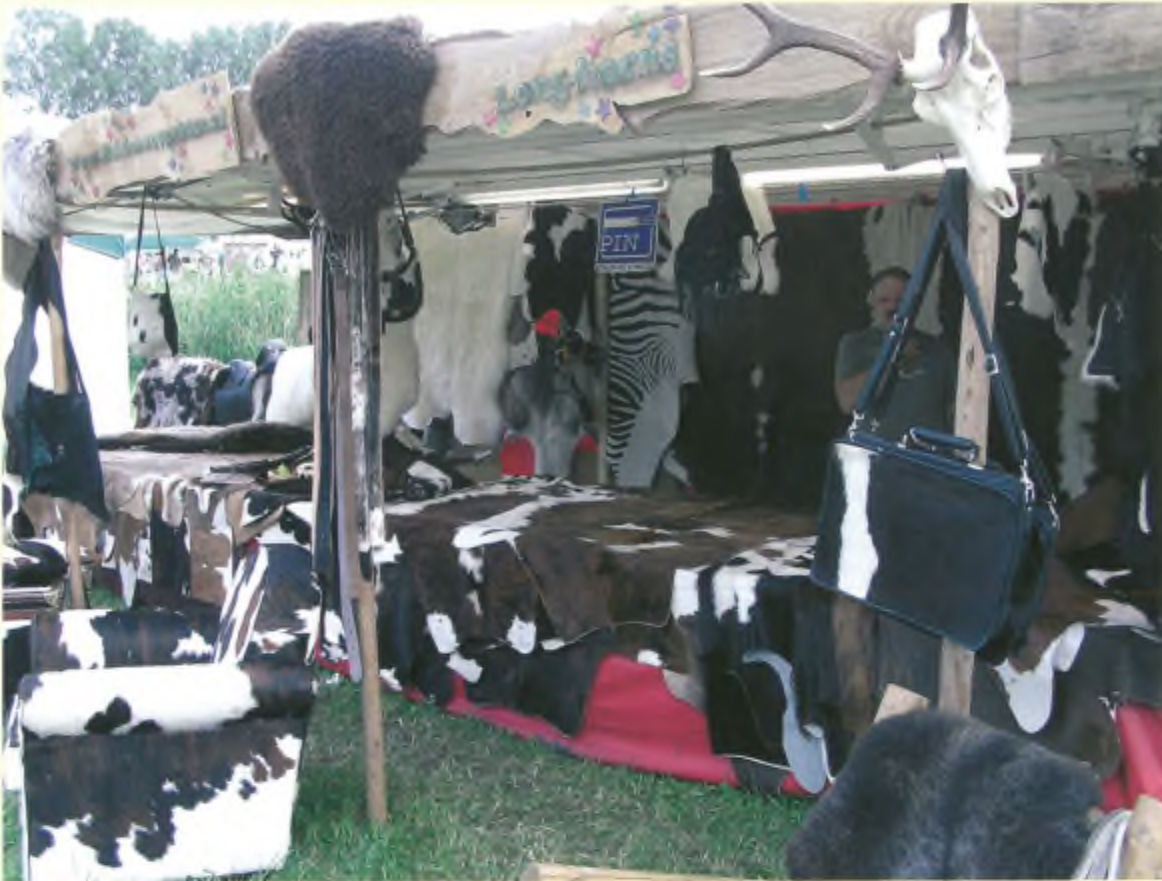
Over bont gesproken. Huiden van dieren te kust en te keur te koop, waaronder ijsbeer-, giraffe- en zebra's, Foto: Heinz Stockmann.

Een verplaatsbare hoogzit. Geen enkel risico nemen ze meer de jagers van de Veluwe.