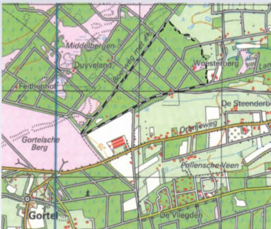
Kaartje van het gebied (7 km wzw van Epe). Het bewuste natuurterreintje is met zwarte arcering aangegeven. De terreinen links van en boven de arcering zijn van het Geldersch Landschap. Gortel en de Gortelsche Berg liggen op het gebied van het Kroondomein. Een hokje op de kaart is 1 x 1 km.

Over het bijvoeren van wild valt nog veel meer te zeggen, want de vraag is wat je vinden moet van de aanleg van voerakkers (vaak grootschalig), zoals bij Planken Wambuis (Natuurmonumenten) en op de Hoge Veluwe. Ze voeren daarvoor argumenten aan als zouden ze oude graansoorten of