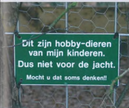
'Ludieke' teksten op een fazantenkooi moeten voorkomen dat bezoekers argwaan krijgen...

Hoe zit het met de vergunningen? Voor het afgraven van gronden en het aanleggen van poelen is een ontgrondingsvergunning van de provincie nodig. Het oprichten van jachtstallages is onderhevig aan plaatselijke regels. De gemeente Epe is wat dat betreft echter nogal laks. Zo staan er bij een laatste telling meer dan 50 schiethutten op de gronden van de gemeente, die allemaal zonder toestemming zijn geplaatst. Over het bijvoeren straks meer, maar op de manier zoals dat in het bewuste gebied wordt gedaan, is het zeker niet toegestaan!