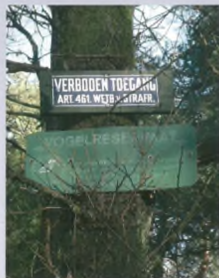
Door gebruik te maken van bordjes met weinig uitnodigende teksten worden nieuwsgierige wandelaars op afstand gehouden.

Niet alleen bij Winterswijk of Haaksbergen (of waar dan ook in het oosten van ons land), maar ook op de Veluwe - een gebied waarvan het er steeds minder naar uitziet dat het ooit nog eens een samenhangend nationaal park gaat worden - vinden we zaken die ons niet alleen verbazen, maar die zelfs aanleiding zijn om direct naar de politie te stappen om aangifte te doen van een overtreding. Zoals in de in dit artikel beschreven situatie in de gemeente Epe, waarmee wij afgelopen najaar werden geconfronteerd. Wat is er aan de hand? Een particulier bosterrein bleek doelmatig (maar illegaal) ingericht te zijn om wild uit omliggende natuurterreinen te lokken en ter plekke af te schieten.