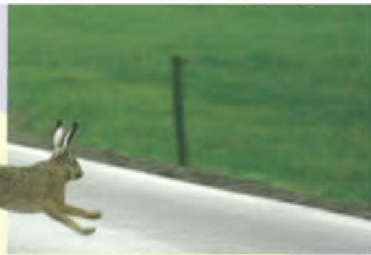
Vluchtende haas.

B ij de Vogel- en Egelopvang in Delft, waar ik als vrijwilliger werk, wordt jaarlijks een klein aantal hazen gebracht. In de periode van 2001 t/m 2005 ging het in totaal om 26 hazen. Hiervan waren er 22 onvolwassen. De leeftijd van de jonge hazen varieerde van enkele dagen tot weken oud. De jonge dieren verschenen van maart tot en met oktober bij de opvang. Dat is vrijwel de gehele periode waarin jonge hazen worden geboren (R. Lange et al., 1994).