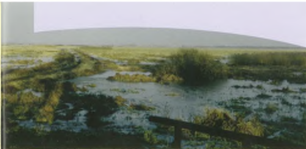
Het reservaat Stonsk bij de samenvloeiing van de Wartz en de Oder in het westen van Polen meet ca. 8x15 km 2 en is een slaappleaats voor meer dan 200.000 ganzen.

partijen, die werkelijk niet meer van deze tijd behoren te zijn. Men zou dus denken, dat het Europese Parlement zich hier allang intensief mee zou bezighouden. Men is immers nooit te beroerd om ons de minimale en maximale binnen- en buitenafmetingen van de grote en de kleine paperclip of de decibellimiet van de dubbelwandige fluitketel te verordonneren! Maar niets lijkt helaas minder waar te zijn. Terwijl er toch wel degelijk goede voorbeelden op te lepelen zijn die tot een genuanceerd beleid betreffende de omgang met het gemeenschappelijke Europese natuurbezit zouden moeten kunnen leiden.