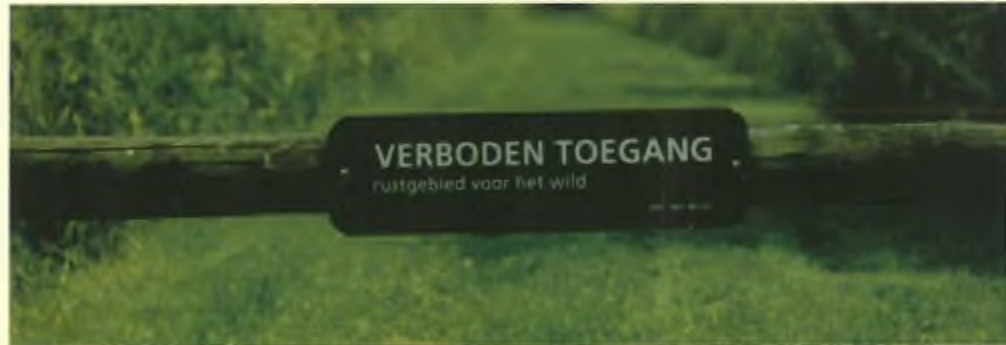
Achter deze bordjes speelt zich bij voorkeur het "weidwerken" af. Voeren en schieten is hier het motto.

FBE bestuurders zoals boven vermeld. Van de overige respondenten meldde 5% gedeputeerden te zijn, 13% ambtenaar bij de provincie, 11% bestuurder van een FBE en 14% was medewerker van een FBE. Het is dan ook niet verbazend dat op de vraag "Hoe (on)tevreden bent u over de samenwerking met de jagers?" 68% aangaf tevreden te zijn en slechts 5% ontevreden. Uitsplitsing van de beantwoording naar organisatie werd op dit onderdeel niet in het rapport opgenomen. In totaal werden de antwoorden van 25 van de 55 vragen anoniem, dus niet uitgesplitst naar organisatie maar alleen in procenten, weergegeven.