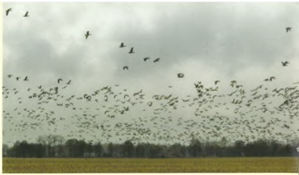
Akkers met oogstresten van maïs zijn een belangrijker voedselbron voor honderdduizenden ganzen, maar ze worden tgegenwoordig vaak al in de herfst omgeploegd.

De omvorming van een politiek-bestuurlijk pluriform continent naar een situatie waarin gesproken kan worden van de Verenigde Staten van Europa, lijkt zoetjesaan haar beslag te krijgen en de blikken zijn zelfs al geruime tijd gericht op verdere uitbreiding op Aziatisch grondgebied. Echter nét als een te gulzige aalscholver of visarend zal ook de Europese Unie zich op een goede dag absoluut en definitief verslikken in de eigen schrokop-mentaliteit! Men zou er goed aan