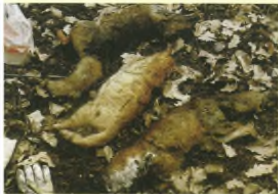
Wie met jagers samenwerkt moet het onacceptabele accepteren. Twee geschoten vossen en een rode kater als oud vuil achtergelaten in het bos.