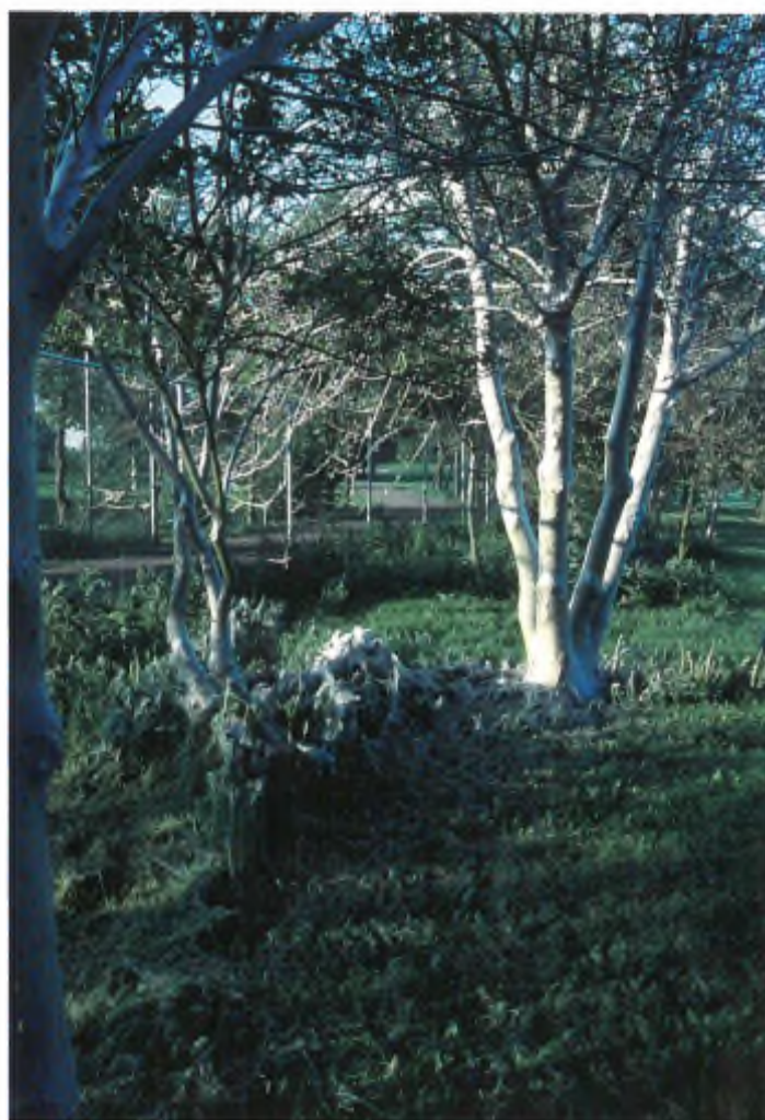
Ook de Vogelkers ( Prunus padus ) wordt in sommige jaren in de voorzomer geheel kaal gegeten door de Vogelkersstippelmot ( Yponomeuta evonymellus ), zoals de boom op deze foto op de golfbaan in Alphen a/d Rijn (juni 2003). Het spinsel van de rupsen

Het is dus vooral belangrijk dat, voordat je met een of andere bestrijdingsactie begint, je eerst goed gaat nadenken. Want is er werkelijk sprake van een gevaarlijke aantasting, of zit het probleem vooral in je hoofd (zoals het probleem met die luizen op de vlier)? Op de dag dat ik deze regels schrijf, zorgt een combinatie van een stevige wind en een - overigens dringend gewenste - meiregen ervoor dat de bloemen van de paardenkastanjes massaal afvallen. Vorig jaar werd alarm geslagen omdat deze bomen in grote aantallen de nieuwe bloedingsziekte vertoonden, waarvan de oorzaak mogelijk een bacterie uit de groep van de Pseudomonas