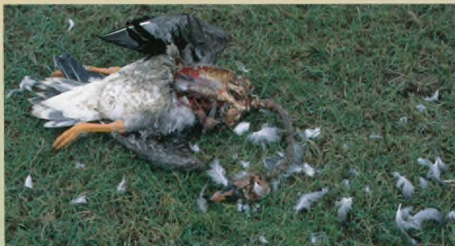
Nog meer ongeoorloofd vossenvoer. Ook deze toendrarietgans viel ten prooi aan fauna-beheerders en werd door de vos en andere predatoren in dank opgepeuzeld.