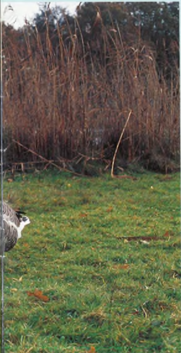
Grauwe ganzen en een brandgans in de uiterwaarden van de IJssel.