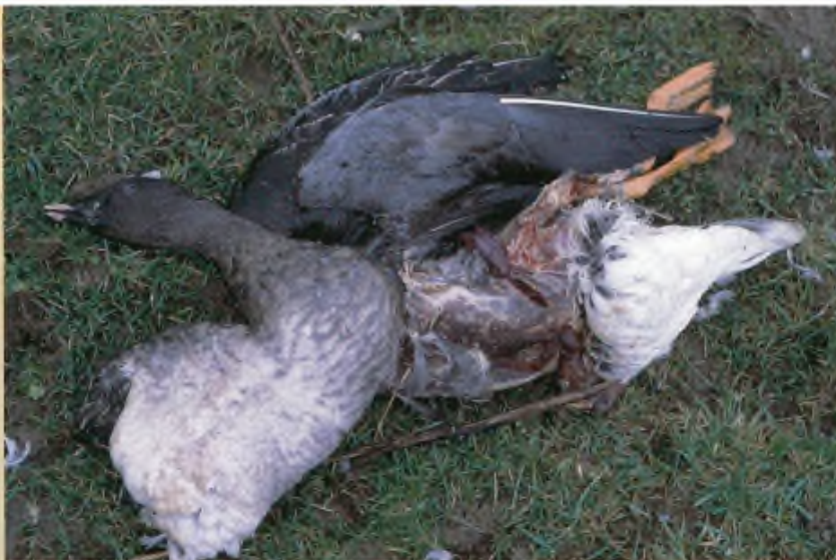
Onwettig afschot. In de winter van 2005/2006 werd vastgesteld dat er ook op beschermde toendrarietganzen werd geschoten. Deze vogel van de ondersoort rossicus is aangevreten door een vos.