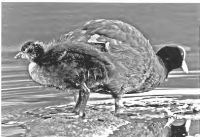
Meerkoet met jong