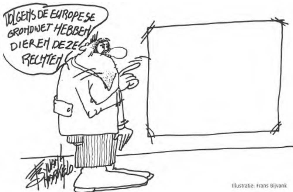
Illustratie: Frans Bijvank

De regering tracht met man en macht voorstanders voor de Grondwet te werven. Dat ze het zich daarbij aan niets gelegen laat liggen, blijkt uit het feit dat de overheid niet alleen gekleurde, propagandistische 'voorlichting' geeft, maar ook gewoonweg aperte onwaarheden verkondigt in de voorlichtingscampagne rondom de grondwet. De Stichting Dierenrechten Europa heeft medio april een klacht bij de Reclame Code Commissie ingediend en richt zich op de website www.grondwetu.nl waarin de Nederlandse regering 'mythen rond de Grondwet' zegt te ontzenuwen. Hiernaast kunt u lezen in welke bochten de regering zich in de voorlichtingscampagne voor de Europese Grondwet probeert te draaien om het dieronvriendelijke karakter van de Grondwet te verdoezelen.