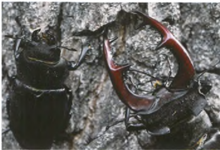
Links: Vrouwtje en de kop van een mannetje op een boomstam.