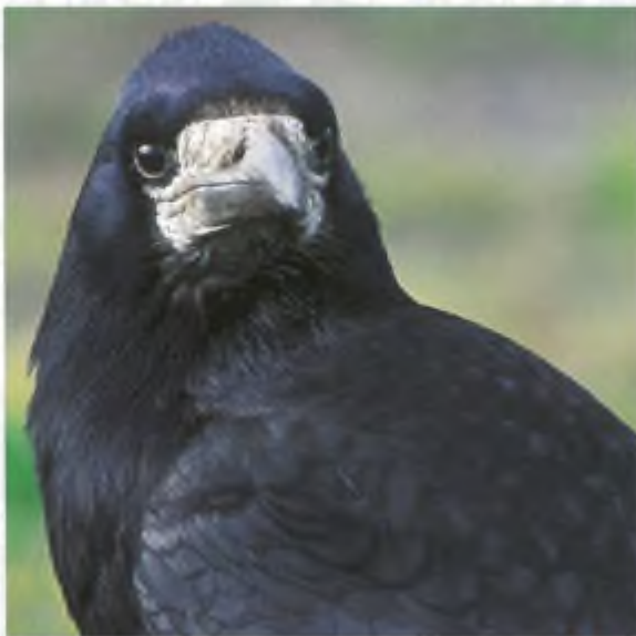
Een oplettende roek.

en de werkgroep Avifauna Drenthe nesten geanalyseerd. We weten op grond hiervan redelijk waar nesttakken aan moeten voldoen. We weten ook dat roeken volop takken van elkaar stelen tijdens het nestbouwen en dat ze takken uitbreken. Ze doen dus veel moeite om aan takken te komen, terwijl de bodem bezaaid kan zijn met takken. Je zou dan ook denken dat roeken met een goed aanbod van takken gediend zouden kunnen zijn. We hebben dat volop geprobeerd: takken op maat op de grond bij de kolonie gelegd, verschillende soorten takken naast elkaar gelegd, takken in een mandje hoog in de boom aangeboden, enzovoort, maar het resultaat is teleurstellend. Het aanbod wordt niet of nauwelijks geaccepteerd. Dit heeft ook weer iets kostelijks. We gaan dit verder uitpluizen en houden ons dan ook aanbevolen voor elk goed idee om roeken met takken of anderszins te lokken. Als we dat weten, kan dat niet alleen voor het lokken naar de alternatieve nestelplaatsen van belang zijn, maar ook om te voorkomen dat roeken takken uit fruitbomen breken.