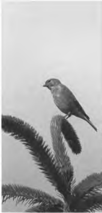
Geheel links: Grauwe gors Links: Kneu Linksonder: Geelgors Onder: Velduil Op rechterpagina: Veldleeuwerik