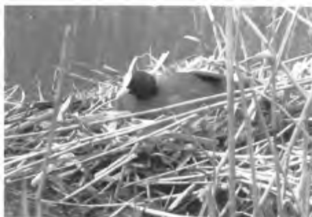
Meerkoet op het nest.