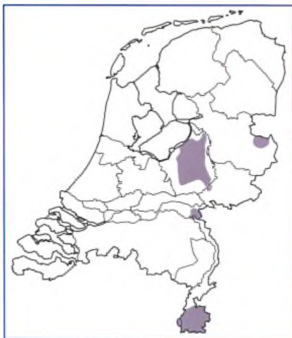
Huidige verspreidingsgebied van het vliegend hert in Nederland.