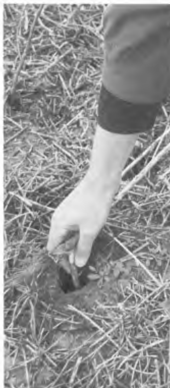
Valpijp met een diepte van circa veertig centimeter.

Bij het maken van een burcht beginnen hamsters meteen met het graven van een pijp die onder een hoek van ongeveer vijfenvieftig graden schuin de grond in gaat. Zodra het dier op voldoende diepte zit, maakt het horizontale zijgangen en een nestkamer. Vanuit de zijgangen worden op één of meerdere plekken pijpen loodrecht omhoog gegraven; de vrijkomende