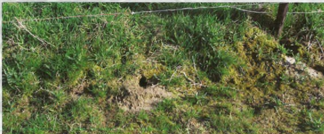
Schuine ingang van een hamsterhol met uitgeworpen aarde.