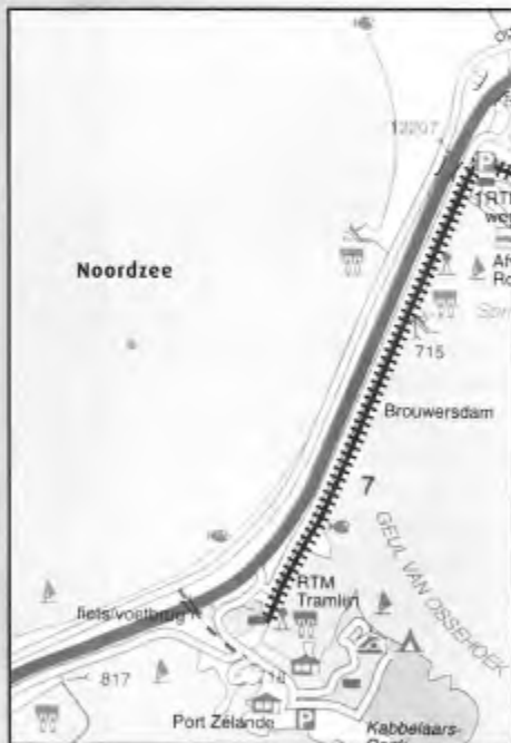
Ligging van de Brouwersdam tussen Goeree-Overflakkee en Schouwen-Duiveland.

Vanwege het verlopen van het Waterbeheersplan moest dit jaar opnieuw een besluit worden genomen. En gezien het feit dat de staatssecretaris van Visserij in 2002 in een brief aan de Kamer expliciet had aangegeven dat 'het sluis- en stuwbeheer gericht op het (binnen)houden van schieraal' moest worden beëindigd, hadden wij er alle vertrouwen in dat het vissersvriendelijke beheer van de Brouwerssluis