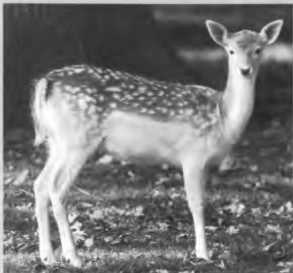
Damhert (hinde)