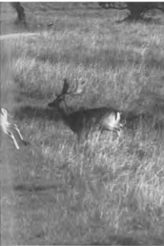
Damherten in de Amsterdamse Waterleidingduinen.