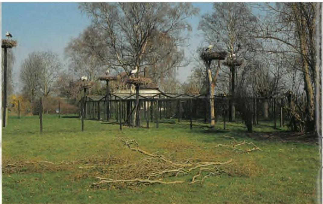
Het ooievaars- buitenstation in Gorssel.

De oorzaken van deze sterke achteruitgang moeten vooral worden gezocht in de grootschalige ruilverkavelingen die in het midden van de twintigste eeuw het uiterlijk van het platteland sterk veranderde en daarmee verdwenen vele geschikte leefgebieden van de ooievaar. Het op grote schaal toepassen van bestrijdingsmiddelen en de vele hoogspanningskabels versterkten de negatieve ontwikkeling. Maar het was niet alleen de mens die de problemen veroorzaakte. Als het voorjaar koud en nat is, zijn de broedresultaten soms heel slecht en zullen er maar weinig jonge ooievaars