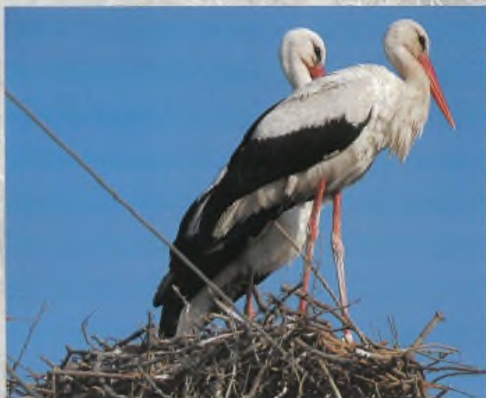
Ooievaars op hun nest (foto: Geurt Besselink).

Dorpen en steden waren of zijn nog vaak erg gehecht aan 'hun' ooievaars. Zo was tot ver in de twintigste eeuw het stadje Oudewater bekend vanwege het ooievaarsnest op het dak van het stadhuis. De terugkeer aldaar van de vogels in het vroege voorjaar - eerst het mannetje en enkele weken later het vrouwtje - kwam in de landelijke pers. Maar net als op veel plekken in Nederland verdween ook uit Oudewater de ooievaar. Het mij laatst bekende nest in Nederland van een paartje 'wilde' ooievaars (dat is: van ongeringde, niet bij een herintroductieprogramma gefokte vogels) bevond zich in de jaren tachtig in het Gelderse dorp Voorst tussen Apeldoorn en Zutphen, vlak bij de IJssel. Ik weet nog goed hoe fotografen zich langs het grasveld in de buurt van het nest verzamelden om de zeldzame vogels te 'kijken'. Maar ik weet ook nog van de opschudding toen bleek dat enkele ooievaars, die waren uitgebroed in een buitenstation in het nabijgelegen Gorssel, het nest van hun ongeringde soortgenoten wilden inpikken en zo de laatste 'wilde' broedpoging hebben verstoord. Einde verhaal?