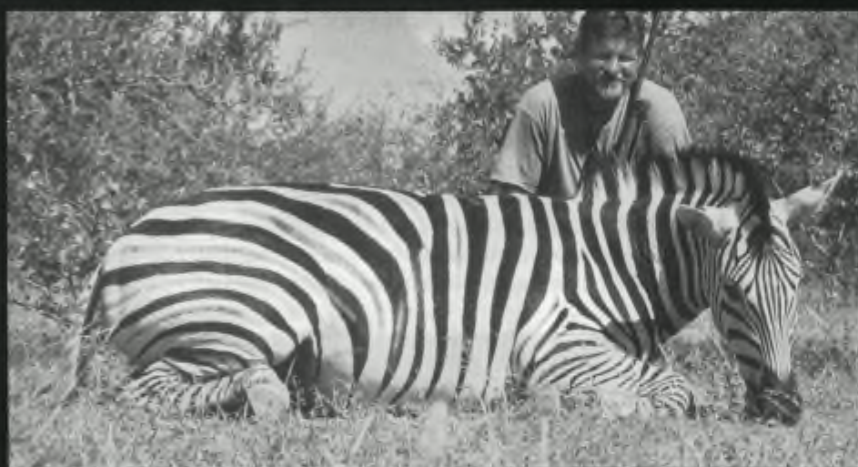
Trotse schiettoeristen in Afrika met hun geschoten slachtoffers.

shot kan komen. Veel jachtreisorganisaties hebben zich er in gespecialiseerd elk type jagersdroom te vervullen. Vanzelfsprekend moet na zo'n inspannende jachtdag de broodnodige ontspanning daarbij ook niet worden vergeten.