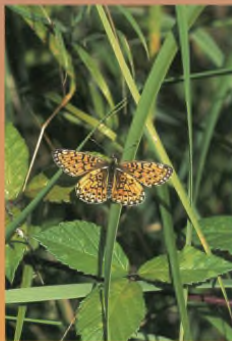
Zilveren maan