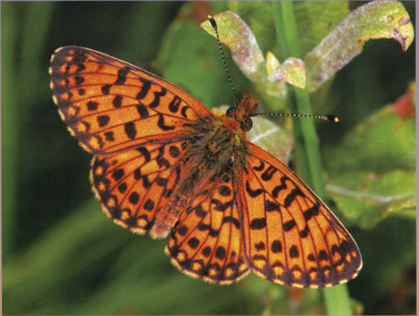
Zilveren maan

klein om levensvatbaar te zijn of kon er geen uitwisseling met andere populaties in de omgeving plaatsvinden. Deze soort, waarvan de rupsen vooral foerageren op hengel ( Melampyrum pratense ), komt in Nederland alleen nog maar op de Veluwe voor.