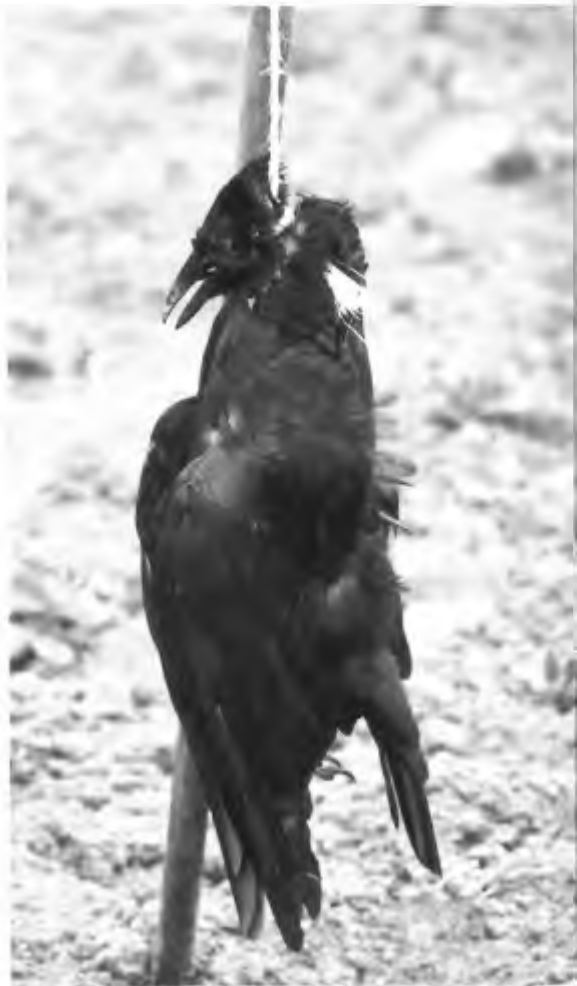
Geschoten zwarte kraai, misbruikt als afschrikking voor andere kraaien.