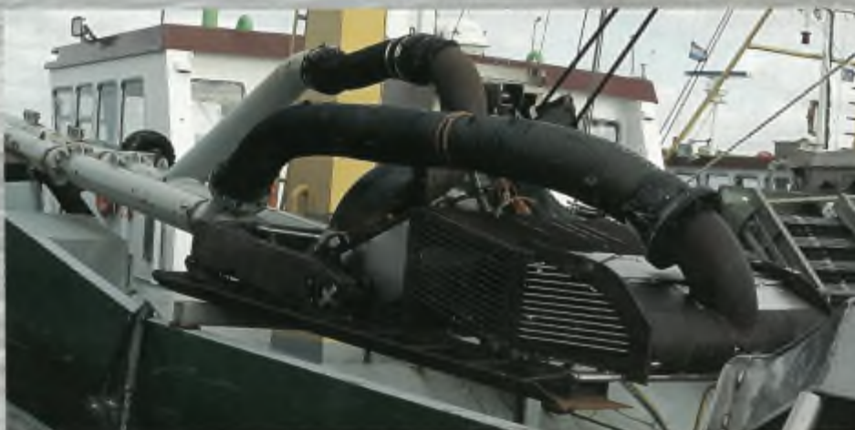
Alle maatregelen om het unieke natuurgebied van de Waddenzee te behouden zijn zinloos als er niet heel snel een einde komt aan de mechanische kokkelvisserij.

Voor (verplichte) opgave en meer informatie zie de website van het ministerie van LNV op www.eva2.nl