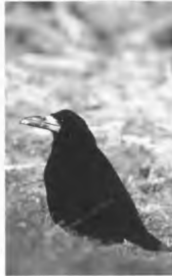
De bescherming van de roek en de vos zal ook na invoering van de Flora- en faunawet veel te wensen over laten.