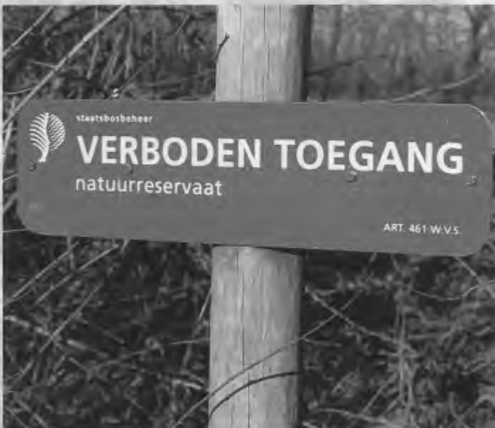
Grootgrondbezitters als Staatsbosbeheer zouden meer rekening moeten houden met de eisen die weidevogels aan hun leefgebieden stellen (foto: Rob Busser).