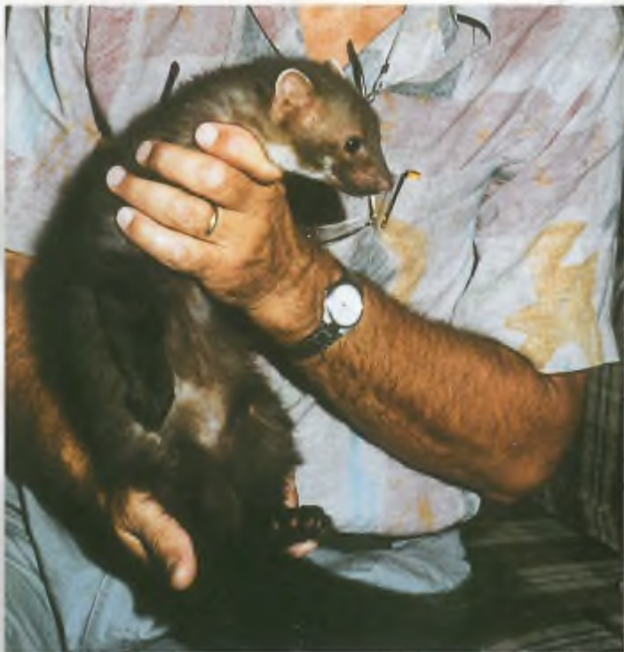
Steenmarters waren onder de Jachtwet beschermd. De Flora- en faunawet zet de deur wijd open voor ontheffingen op basis van overlast.

enkele sportclub is vervolgens met bewijsmateriaal gekomen waaruit blijkt dat konijnen inderdaad gaten en kuilen in sportvelden veroorzaken laat staan dat ze hebben aangetoond dat als direct gevolg daarvan sporters geblesseerd zijn geraakt. Dat dit bewijs ontbreekt is ook logisch aangezien het op grond van het gedrag en de terreinkeuze van konijnen bijzonder onaannemelijk is dat dergelijke schade aan sportvelden inderdaad door konijnen zou worden aangericht. Een aantal rechtbanken (Maastricht, Zutphen, Almelo) deelden dan ook de mening van het ministerie dat de schade niet was aangetoond. Bovendien meenden de betreffende rechters dat zelfs wanneer konijnen eventueel wel kuilen in sportvelden zouden veroorzaken dit niet kan worden beschouwd als een gevaar voor de volksgezondheid. Toch meenden een rechter in Den Haag en later één in Leeuwarden, zelfs bij het volledig ontbreken van enig bewijs, wel dat hierbij de volksgezondheid in het geding zou zijn.