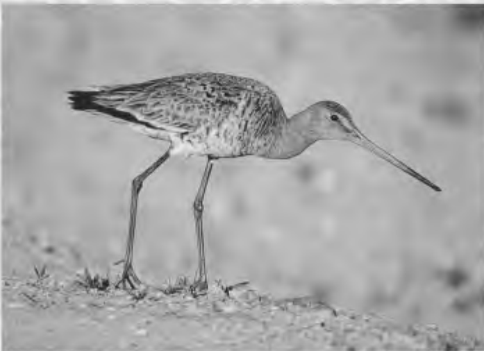
Grutto (foto: Norman van Swelm).