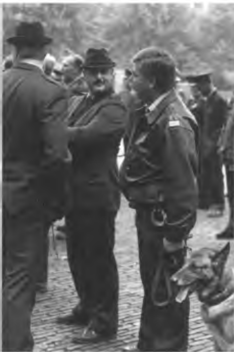
jachtopzichters zijn door belangen- verstremgeling vaak het verkeerde aanspreekpunt als het om jacht- overtredingen gaat (foto: Rob Busser).