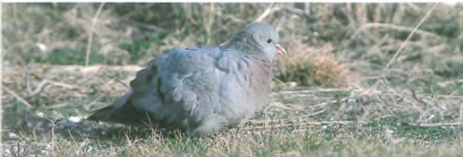
Holenduif (foto: Arnoud v.d. Berg).