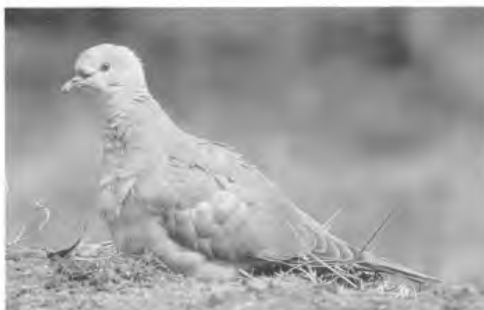
Turkse tortel