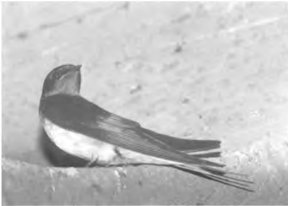
Striktere hygiënische regels op het boerenbedrijf hebben negatieve gevolgen voor het broedsucces van de boerenzwaluw.

toch vooral in Nederland worden gezocht. Het lijkt daarbij zo te zijn dat de huiszwaluwen zich hebben geconcentreerd in grotere kolonies, die zich in ons telgebied vrijwel uitsluitend bij boerderijen bevinden. Daar is vochtige klei of leem voor de nesten voorhanden en er zijn ook meer grotere insecten. Met een paar vette bromvliegen is een zwaluwenkrop sneller gevuld dan met een zwermpje vedermuggen!