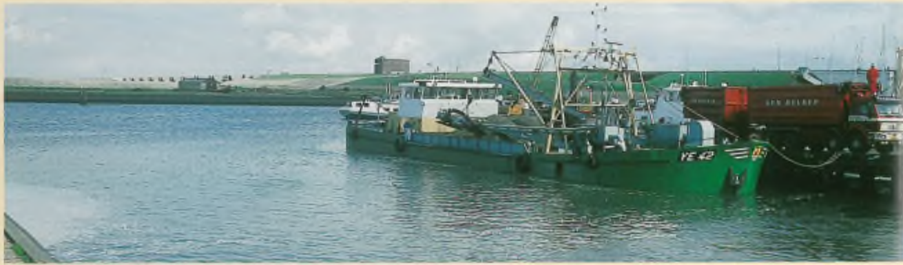
Koken en afleveren van kokkels afkomstig van de Hinderplaat (Stellendam, oktober 1992).