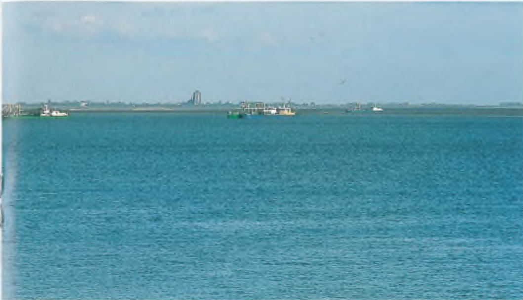
Kokkelvissers op de Roggenplaat in de Oosterschelde. (augustus 2001).