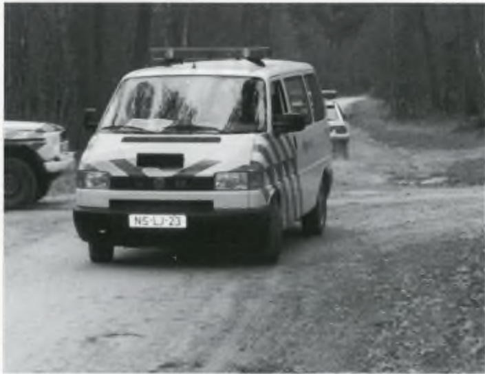
Faunabeschermers die zich een meter van het pad begeven worden onherroepelijk op de bon geslingerd.

te stammen uit hetzelfde verre verleden toen ook de drijfjacht bedacht werd.