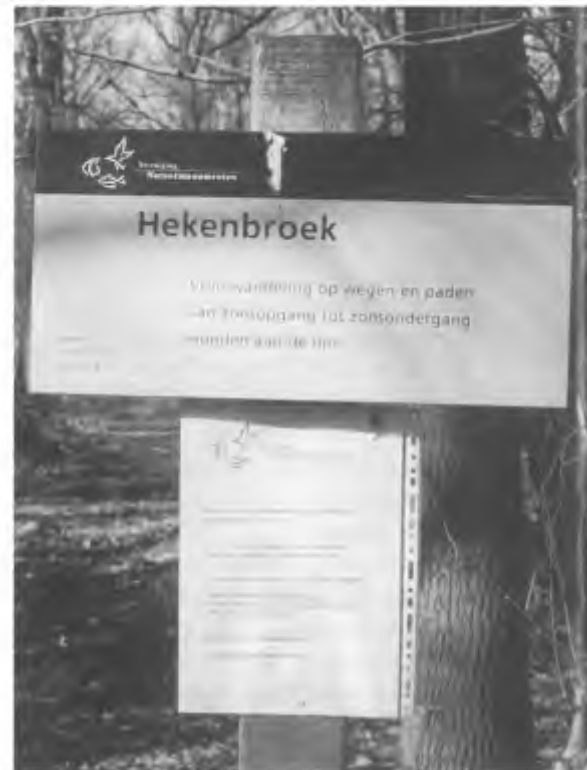
Waarschuwing voor MKZ-besmetting in natuurmonument Hekenbroek bij Hoog Keppel.

Een aantal in het wild levende diersoorten, zoals reeën, edelherten en wilde zwijnen, kunnen de ziekte eveneens krijgen. Ook voor deze dieren geldt dat de meeste exemplaren een eventuele uitbraak zullen overleven. Bovendien ontwikkelen de dieren die de ziekte hebben doorgemaakt een resistentie tegen het virus. Mocht MKZ uitbreken onder de in het wild levende dieren dan is niet-ingrijpen vanuit het oogpunt van natuurbeheer de enige juiste keuze. En het is uiteraard onacceptabel wanneer in het wild levende dieren worden gedood met als argument dat zij een risico zouden vormen voor de landbouwhuisdieren. De uitbraak van MKZ onder het vee, die het gevolg is van politieke en economische keuzes, vormt daarentegen wel een onnodig risico