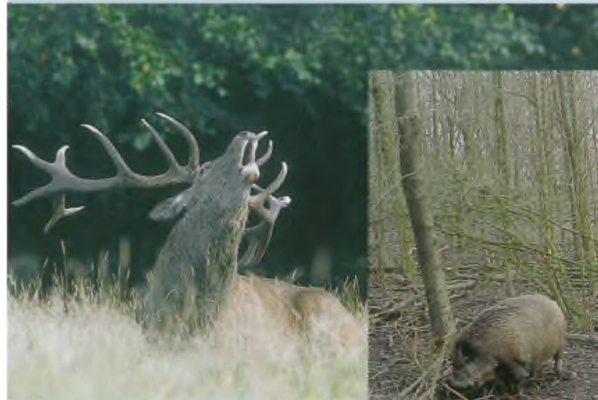
Zowel edelherten als wilde zwijnen zijn in het verleden als 'jachtwild' in diverse natuurgebieden in Nederland uitgezet.