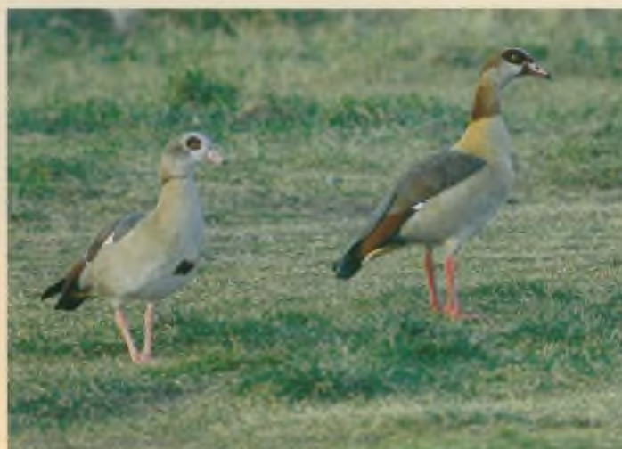
De Nijlgans is een voorbeeld van een verwilderde, exotische diersoort.

Het is duidelijk dat er uiteenlopende doelstellingen bestaan met betrekking tot het uitzetten van bovengenoemde dier(soort)en. Desondanks is het algemeen beleidsuitgangspunt van De Faunabescherming met betrekking tot het uitzetten eenduidig: het planmatig uitzetten van niet-inheemse (exotische) soorten, voor welk doel dan ook, moet worden afgekeurd, omdat vrijwel steeds de gevolgen voor de oorspronkelijke flora en fauna onvoorspelbaar en veelal negatief zijn. Bij herintroductie van (plaatselijk) uitgestorven soorten is ons standpunt als volgt: het is ongewenst dat het initiatief en de uitvoering van (her)introductieprogramma's in de handen ligt van particuliere organisaties. Elke (her)introductie moet passen in een adequaat, door de overheid opgesteld en gecontroleerd