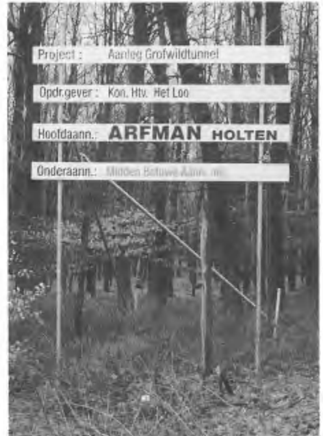
Er wordt met groot materieel gewerkt aan de grofwildtunnel tussen het noordelijk en het zuidelijk deel van het Loo.

onder het regime van de Flora- en faunawet zouden vallen, waardoor ook de uitzonderings-bepalingen van die wet hen geen angst meer zou hoeven in te boezemen. Gelet op de nieuwe samenstelling van de Tweede Kamer waarin tachtig parlementsleden zich gebonden weten aan een partij-programma dat geen ruimte laat voor de hobbyjacht (PvdA, D66, GroenLinks, SP en RPF/ GPV), zou deze AMvB zonder veel problemen zijn aangenomen. Helaas heeft het Ministerie van Landbouw het voorstel inmiddels afgezwakt. Onder druk van de sterke lobby van de grofwildjagers is in de laatste versie van de AMvB de oppervlakenorm voor herten en zwijnen teruggebracht tot 5.000 hectare.