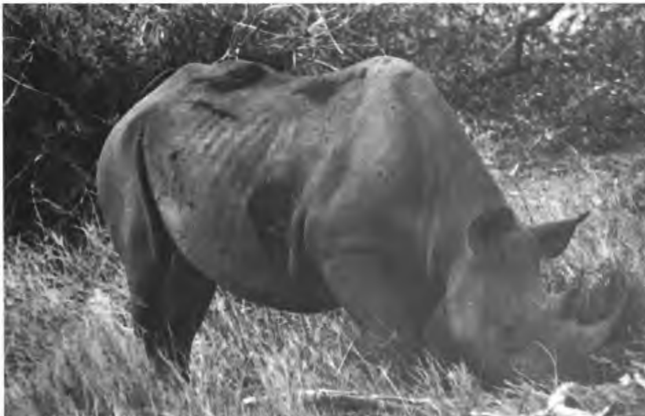
Puntlipneushoorn, in Kenia.

het savanne- en woodlandsgebied kunnen worden gemaakt. Voor veel van deze diersoorten geldt, dat ze zeer sterk in aantal zijn teruggegaan en eigenlijk alleen nog maar in natuurreservaten voorkomen (naar Drost, 1966).