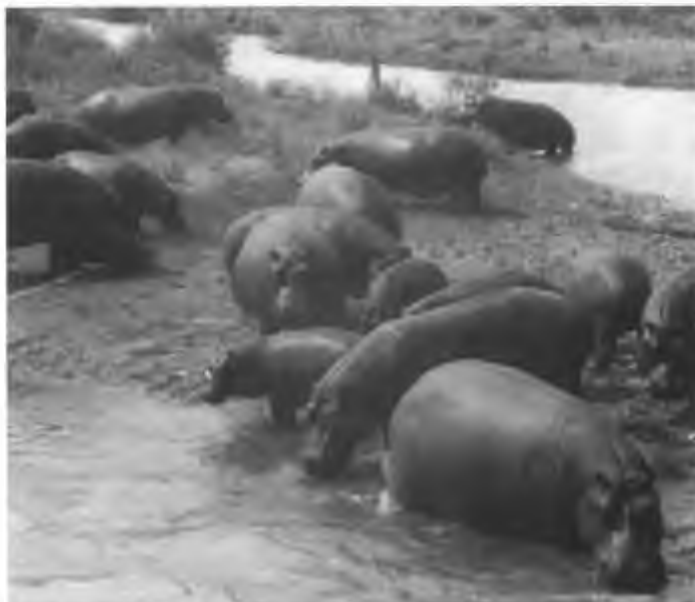
Nijlpaarden komen ook buiten de nationale parken vrij veel voor.

Het dwergnijlpaard, Choeropsis liberiensis , is onregelmatig verspreid over west Afrika en is een bewoner van dichte, vochtige bossen langs de rivieren. Door de bevolkingsdruk en door de intensieve jacht die er door de lokale bevolking op dit schuwe dier werd, gemaakt om zijn vlees, is het dwergnijlpaard zeer zeldzaam geworden. Hoewel de soort in gevangenschap vrij gemakkelijk tot voortplanting komt, en er daardoor in verschillende dieren-tuinen goed mee gefokt kan worden, is het maar de vraag of er voor dit dier ooit weer een redelijke overlevingskans in de natuurlijke omgeving zal bestaan. De 'grote broer' van het dwergnijlpaard, het nijlpaard, Hippopotamus amphibius , is één van de weinige grote Afrikaanse zoogdieren die ook buiten de nationale