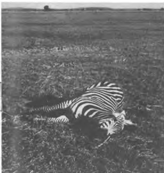
Stervende Zebra. Kafue Flats, Zambia.

Blüchel, K. De ondergang der dieren. Uitgever De Haan, Bussum.