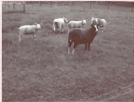
Een moederschaap is zeer goed in staat om haar lammeren tegen een vos te beschermen.