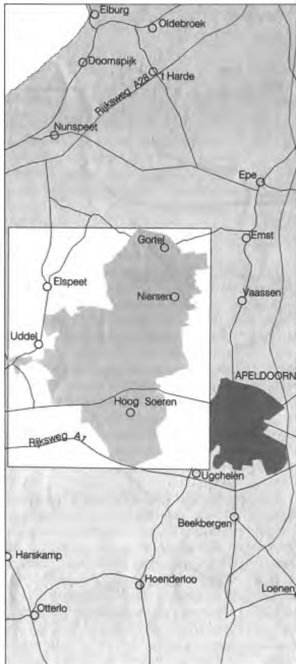
Kaart van de Midden-Veluwe met de ligging van de Kroondomeinen