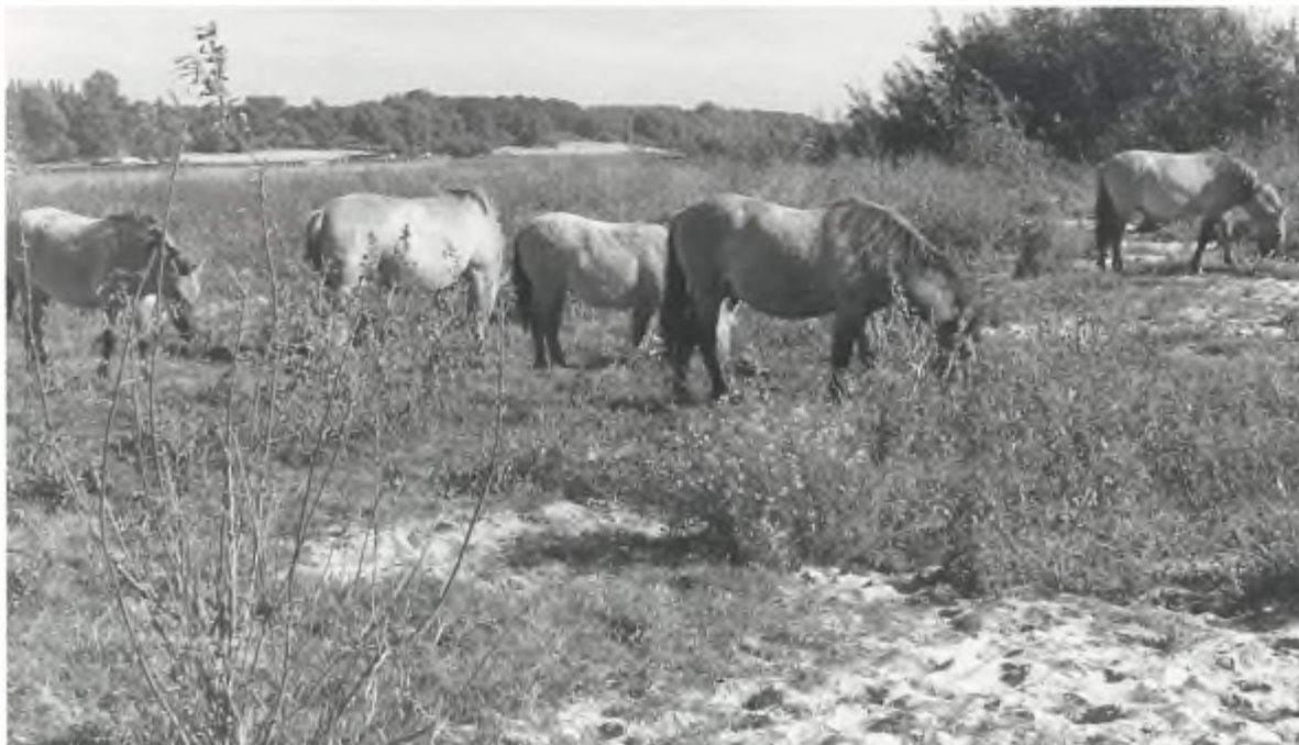
Konikpaarden in de Oostvaardersplassen.