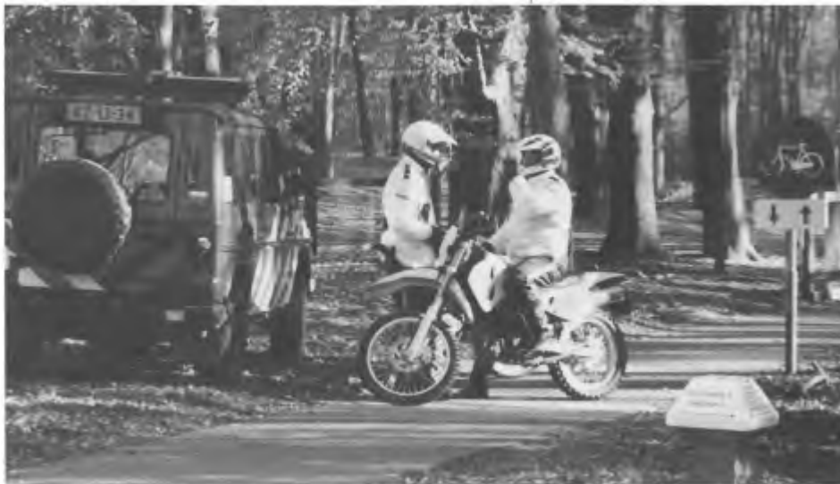
Faunabeschermers krijgen bij hun waarnemingen tijdens de Hofjacht voortdu- rend gezelschap van politie, marechaussee of parkwachters.

de gesprekken worden afgeluisterd en ze vrezen voor hun baan. Daarnaast wordt aan elke waarnemer of journalist een vaste ploeg begeleiders gekoppeld die de gehele dag aan de betreffende persoon blijft 'kleven'.