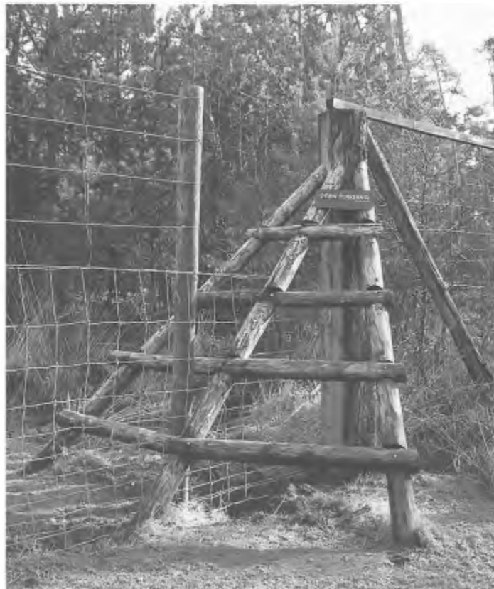
De 'prinselijke overstap' in de Espeterstruiken.

De Prins verlegde zijn jachtactiviteiten meer en meer naar het veilige Kroondomein zelf, naar de uitdrukkelijke wens van zijn moeder. Op 22 december 1995 waren waarnemers van De Faunabescherming door insiders aan het Hof getipt over het feit dat Willem Alexander een Koninklijke drijfjacht op zwijnen zou aanvoeren. Het bestuur van De Faunabescherming had inmiddels besloten haar aanvankelijke terughoudendheid in publiciteit rond de Hofjacht te laten varen, omdat de Oranjes overduidelijk leken te kiezen voor voortzetting van de verfoeide traditie via een nieuwe generatie van Hofjagers. Toen de Prins en zijn jachtgezelschap de lunch gebruikten in het (tegen opdringerige zwijnen) omrasterde Boshuis aan de Boshuisweg in Gortel, posteerden waarnemers van De Faunabescherming en enkele journalisten zich bij de enige twee toegangshekken tot het Boshuis. Er ontstond paniek bij de beveiligers van het Koninklijk huis en diplomatieke dienst, omdat er geen mogelijkheid voor de Kroonprins was om ongezien te ontsnappen. Om die reden werd gekozen voor een wel zeer opmerkelijke afleidingsstrategie. Er werd met auto's ingereeden op alle aanwezigen die camera's droegen op een zodanige manier dat het hanteren van de camera's levensgevaarlijk zou zijn. In de commotie die daarop ontstond ontsnapte de Kroonprins weggedoken onder een