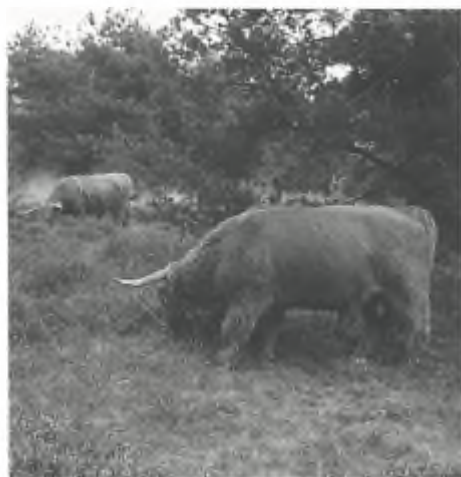
Schotse Hooglanders in de Veluwezoom (foto: Rob Busser).

In opdracht van het Ministerie van LNV bereidt de vakgroep Toegepaste Filosofie van de Landbouwniversiteit Wageningen een wetenschappelijk rapport voor over het onderwerp 'ethiek bij geïntroduceerde dieren'. Op 28 januari 1998 hield de vakgroep in dit kader een workshop over de achtergronden en ethische beweegredenen bij beleidskeuzes rond het uitzetten van dieren in natuurterreinen. Voor de workshop waren ongeveer veertig personen en instellingen uitgenodigd.