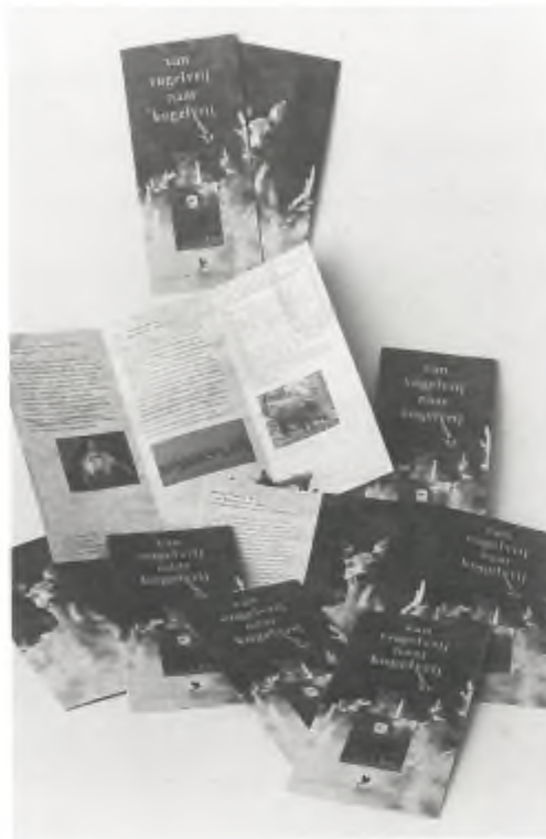
Promotiefolder in vier kleuren Van vogelvrij naar kogelvrij. Op aanvraag gratis verkrijgbaar.