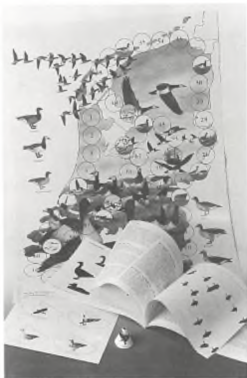
Ganzenbordspel in vier kleuren, met spelregels en pionnenvel f 12,75.