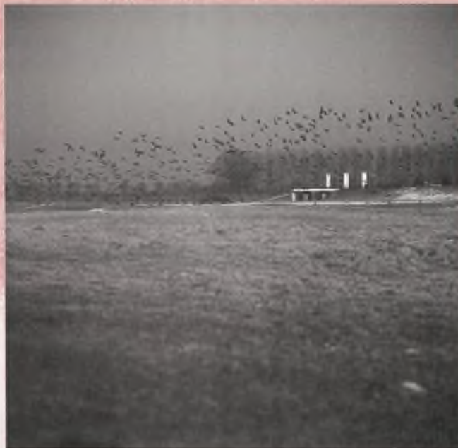
Wilde ganzen in de uiterwaarden.

Begin februari ontvangen wij eindelijk officieel bericht van de minister. In deze brief geeft de minister aan, de sluiting van de jacht onder winterse omstandigheden te hebben gemandateerd naar Gedeputeerde Staten van de provincies. Wel blijft de minister bevoegd om desnoods zelf te beslissen. Hij meent dat een algemene jachtsluiting niet nodig is en heeft de provincies slechts aangeraden om te overleggen met de plaatselijke Wildbeheereenheden en de KNJV verzocht haar leden op te roepen terughoudendheid te betrachten.