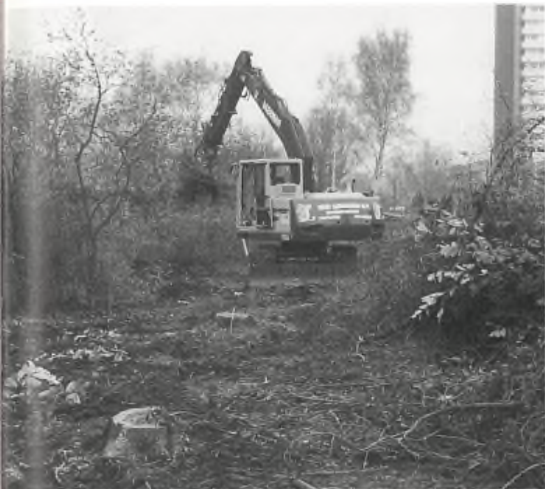
Voorburg aan 't werk

broedseizoen, het laatste deel van het park door de gemeente aangepakt. Verstoring van broedvogels was weer het gevolg. Actie van de Officier van Justitie leidde in 1995 tot een rechtszaak.