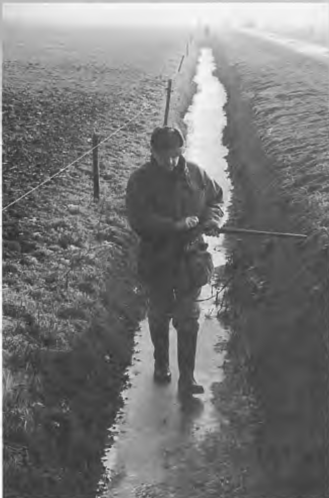
Op zoek naar een goeie plek in de bevroren loopgraaf.