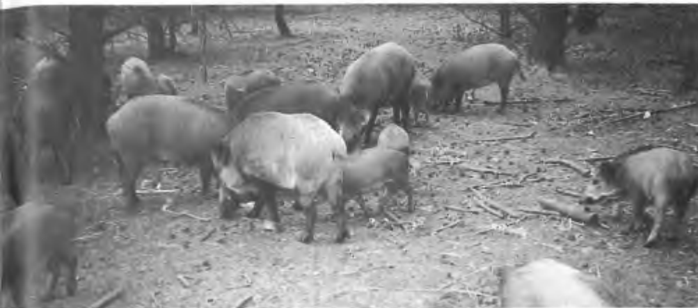
Wilde zwijnen.