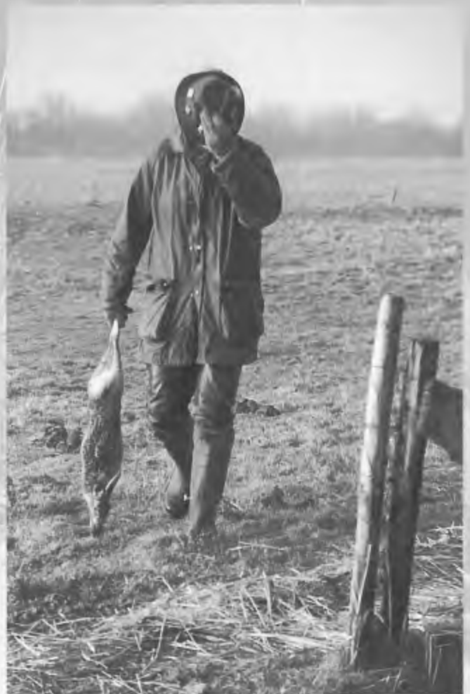
Zo koud was het... (foto: Jan van Dieren).

geen enkele aanleiding om terughoudend om te gaan met de jacht, de volgende dag gingen de jagers (met de pers) op pad om wakken open te maken en om de arme hongerige dieren te voeren. Afgezien van het vrijwel in alle gevallen bewijsbaar ongefundeerd afwijzen van ons verzoek door de meeste provincies zijn wij verbolgen over het feit dat de reactie van sommige provincies heel lang (meer dan drie weken) op zich liet wachten. Onder extreem winterse omstandigheden telt elke dag en is een snelle beslissing voor veel dieren van