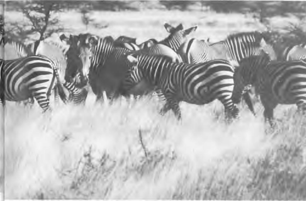
Gewone & grévy zebra's.

Wat betreft de ecologische consequenties van een en ander; men is natuurlijk niet gek, voor een volwassen mannetjesolifant moet een jager meer betalen dan voor een