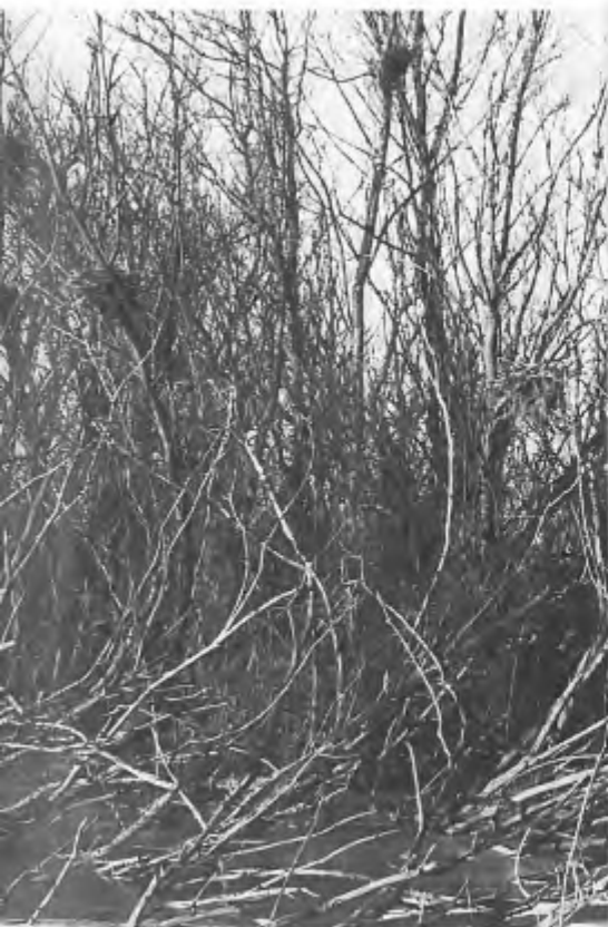
Oostvaarders- plassen.