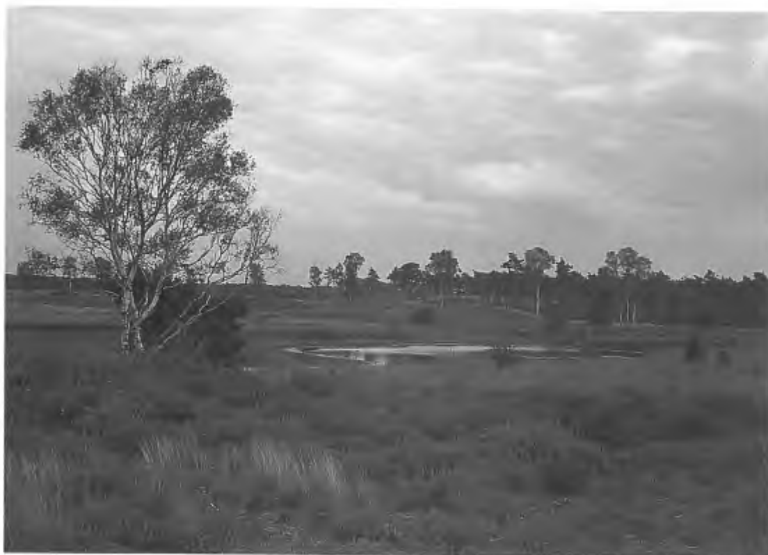
Natuurgebied 'De Hamert' (foto: Pieter Eibers).