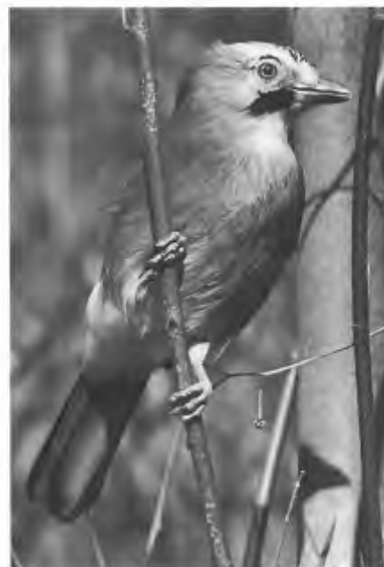
Vlaamse Gaai.