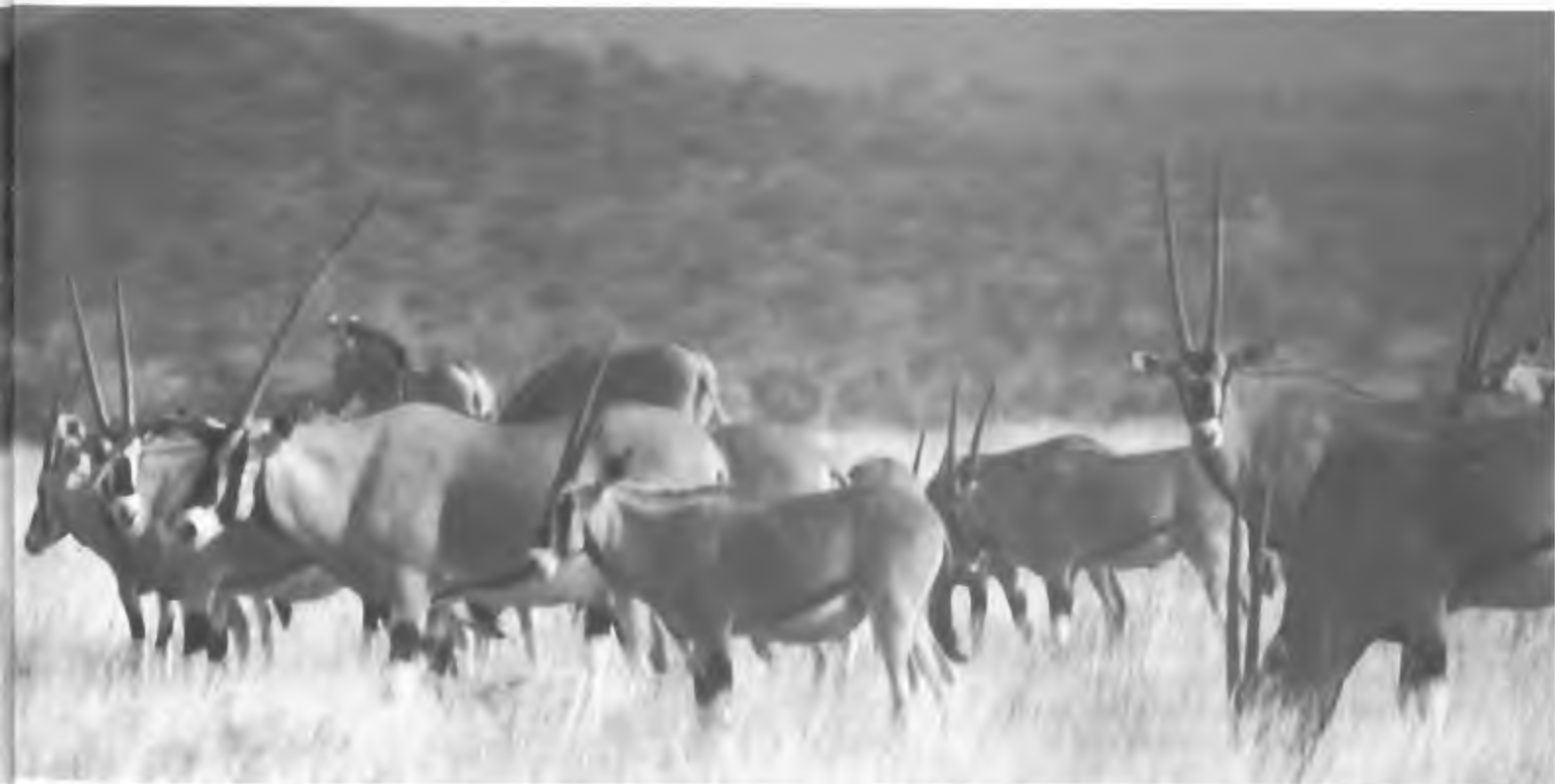
Oost Afrikaanse spiesbokken.