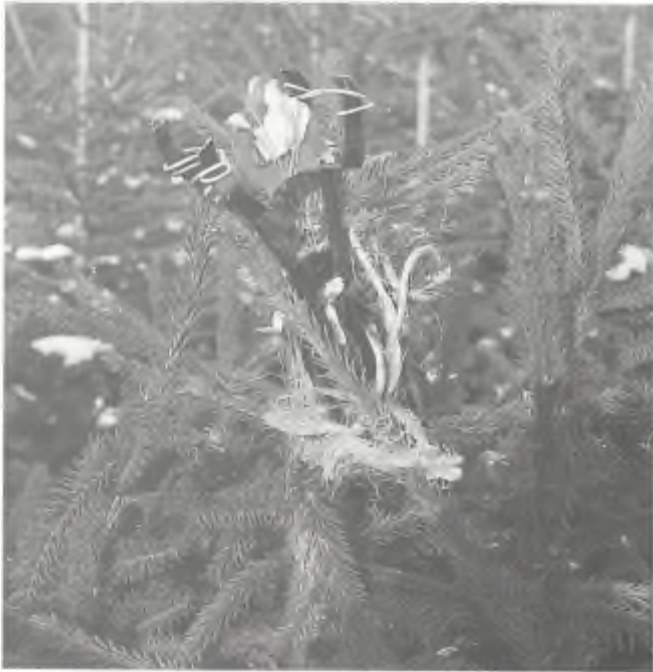
Klem in boom.

bewijs is, volgt hier nog een voorbeeld. In de Leeuwarder Courant van 25 november 1994 stond een foto van een buizerd in een klem. Een soortgelijke foto van dezelfde buizerd heeft ook op de omslag van Argus nummer 2 uit 1986 gestaan. De buizerd leefde nog toen hij werd gevonden, en de foto voor de omslag van de Argus werd genomen. Maar hij was er zeer slecht aan toe; zijn poten waren vrijwel geamputeerd. Hij moest door een dierenarts afgemaakt worden en werd vervolgens, met klem en al, in de diepvries gestopt. Later zijn er ten behoeve van de pers nog meer foto's van hem gemaakt. In het gebied, waar de buizerd met de molleklem rondfladderde, werden nog meer molleklemmen, gemonteerd op een verhoging en voorzien van aas, aangetroffen. De klemmen werden dus welbewust gebruikt om illegaal (roof)vogels mee te vangen.