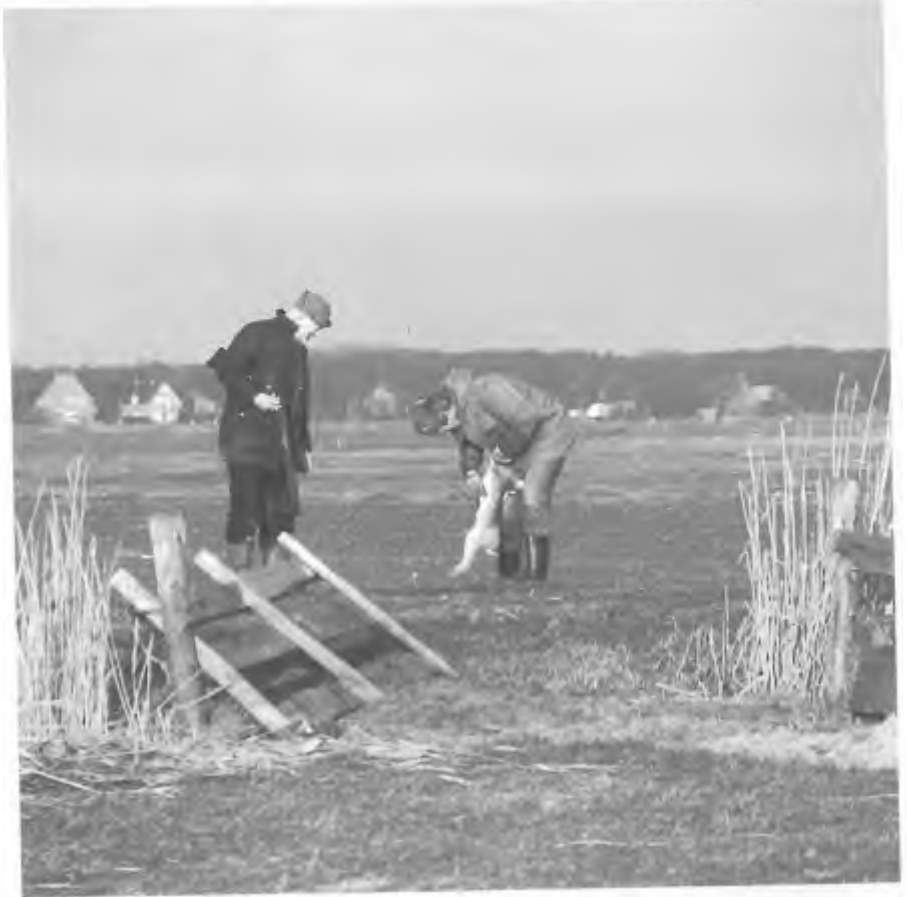
'Ja hoor, mijn volkstuin leeg gegeten'.