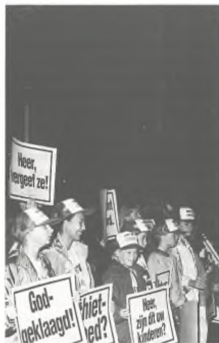
De 'kids' doen ook mee.

liturgieboekje met schietgebed, met daarin uiteraard de visie van het dier verwoord, werd aan de kerkgangers overhandigd.