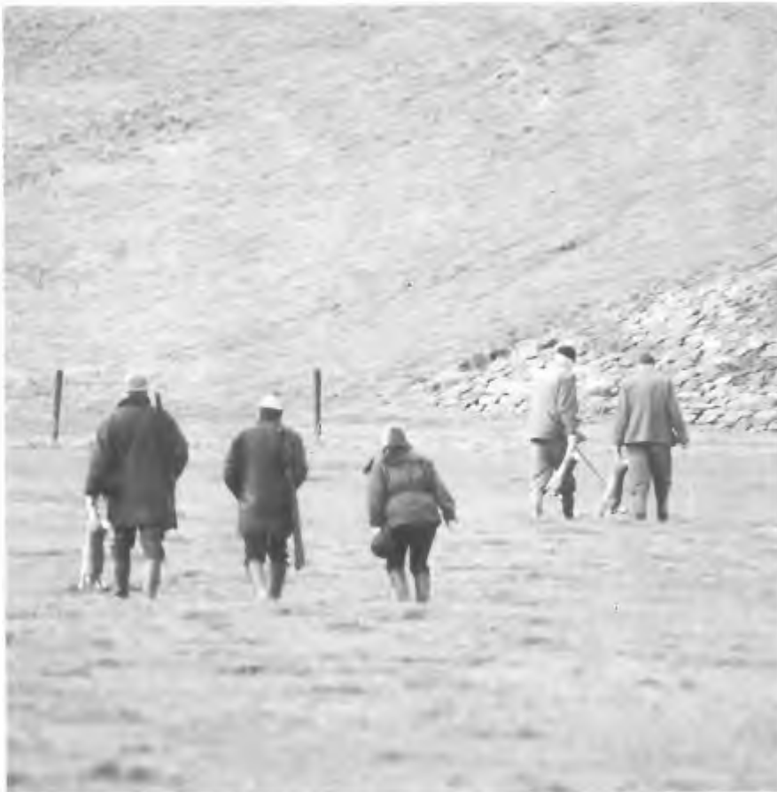
Op weg naar de PvdA?

De KNJV zal Minister van Aartsen vragen de Jachtwet niet te wijzigen maar het ontwerp van de Flora- en faunawet te herzien ten gunste van de jacht. Verder zullen VVV's benaderd worden om toeristen de gelegenheid te bieden aan WBE-werkzaamheden deel te nemen. Jagers zullen voorlichting geven op campings. Publicitair zullen de Game Fair, het wintervoederingsalarmnummer en botulismebestrijding kunnen scoren. Helaas is er geen geld voor een reclamecampagne of voor televisiespotjes. Als de Flora- en faunawet doorgaat zal echter alles op alles gezet worden een televisie-commercial te maken met steun van het bedrijfsleven.