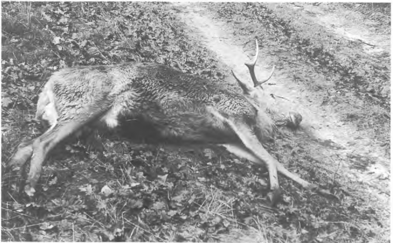
Niet meer op gronden van Defensie?.

Minder leuk is ook dat de hele jacht op de schietkamp nog steeds is verpacht, terwijl daar volgens de eigen richtlijnen van het ministerie geen reden meer toe is 3) . Jachthouder is een gepensioneerd stafid van de schietkamp. Deze werkt samen in WBE-verband met andere jachthouders op de Noord-Veluwe voor het voeren van een gezamenlijk jachtbeleid en het verdelen van de afschotvergunningen voor het grofwild.