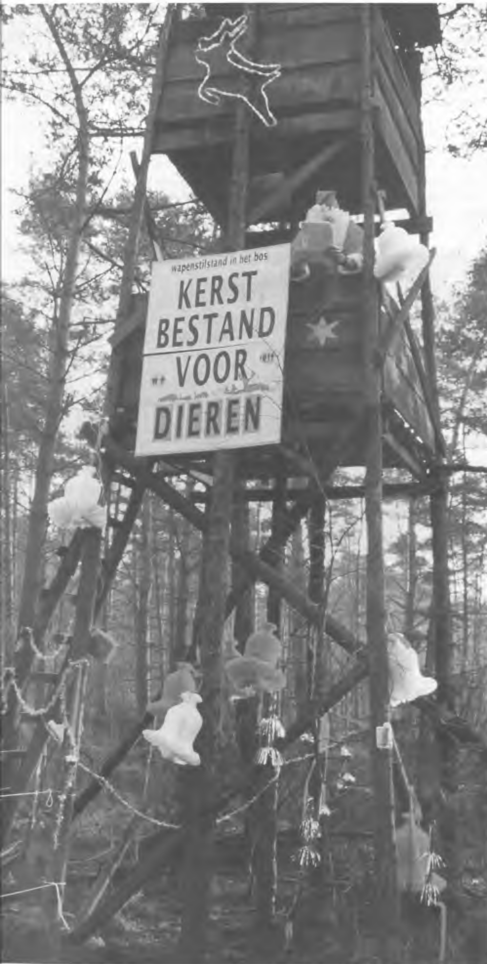
Het kerstbestand wordt afgekondigd.

jachtopzichter vrijwel elke dag tegen het vallen van de avond overvloedig wordt gevoerd. Het uitgestrooide voer bestaat uit voederbieten, maïs en dode kippen. De kippen zijn afkomstig van het proefdiercentrum Spelderholt in Beekbergen, een instituut dat nota bene onderdeel uitmaakt van het ministerie van Landbouw, Natuurbeheer en Visserij.