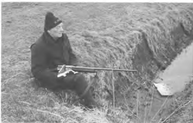
Zou hij van 'het bestand' afweten?

En dan is het woensdagmiddag 21 december, 14.00 uur. Op drie plaatsen tegelijk wordt de actie in gang gezet; in