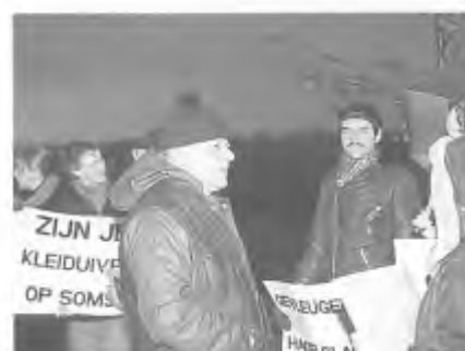
De discussie.