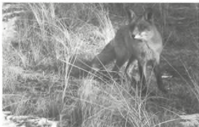
Vos in duinen. Buizerd in mollenklem.

voor haar jaarverslag over 1993 te versieren met een wel zeer suggestieve, om niet te zeggen demagogische afbeelding. Ook de Wildschadecommissie weet natuurlijk maar al te goed dat vossen er nog nooit op betrapt zijn een gezond schaap aangevallen te hebben. Toch moet deze tekening bij velen de overtuiging versterken dat dit aan de lopende band gebeurt, anders zet je zoiets niet op de omslag. Eigenlijk is dit nog kwalijker dan de Bergense boer S. Hoedjes die afgelopen herfst in een televisie uitzending over de 'vossenproblematiek' met het ultieme 'bewijs' kwam; een doodgeschoten vos, gedrapeerd over een dood schaap.