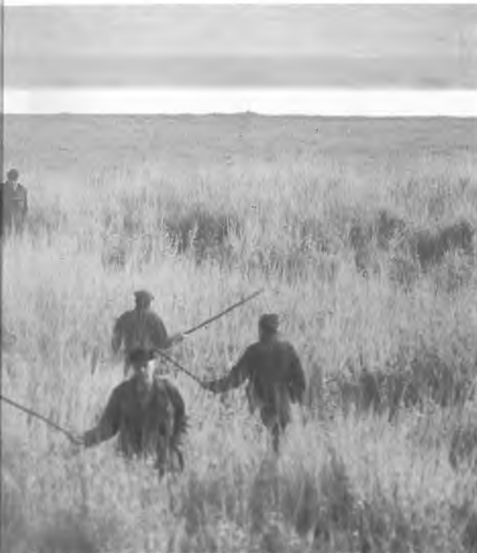
De schimmen aan het hobbyen.

overwegingen van oom Piet en keert hem voorgoed de rug toe.' Ander voorbeeld: 'Een boze boer vraagt enkele jagers om vier tamme ganzen, die overlast veroorzaken, op te ruimen. De jagers kwijten zich met veel machtsvertoon van die taak op zaterdagmorgen om 11.00 uur. In de krant staat 's maandags een sappig verhaal met foto. Omwonenden tonen onbegrip voor de gang van zaken.'