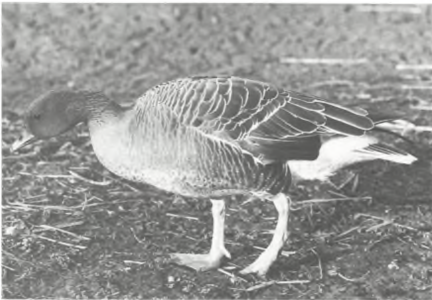
Kleine rietgans.