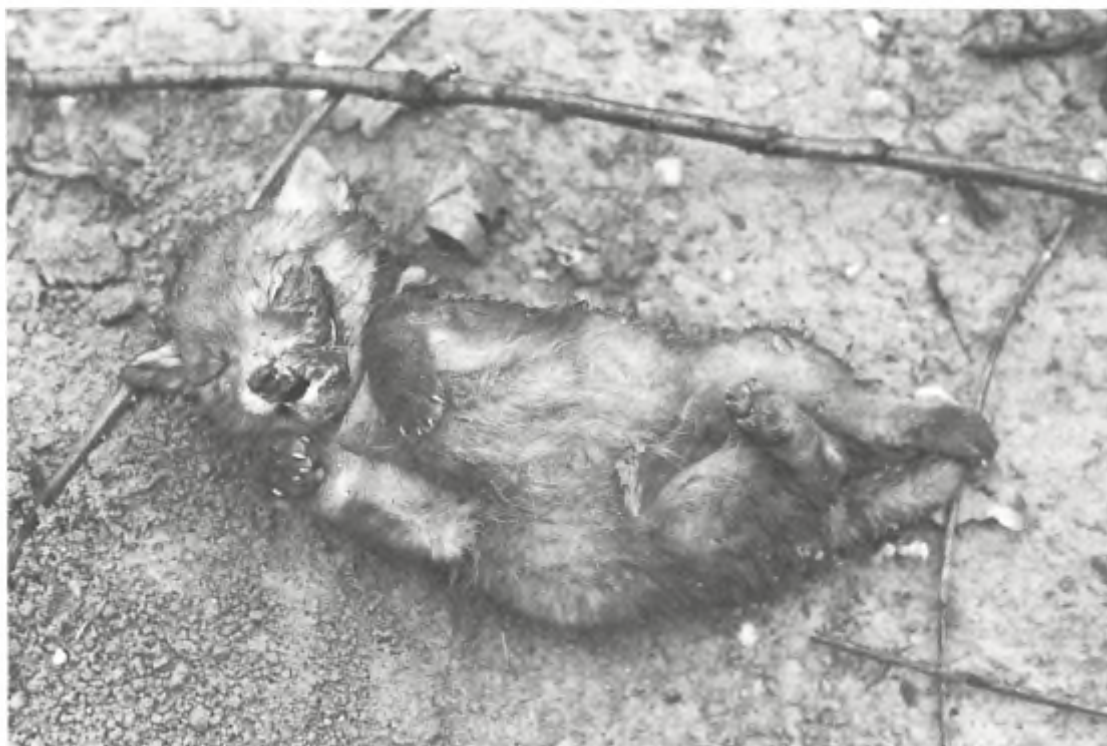
Doodgeslagen welpje.

holen had ik de laatste maanden een enkele keer een vos waargenomen. Door de hoge jachtdruk, vooral veel drijfjachten, krijgt de vos in dit gebied nauwelijks een kans zich te vestigen. Verbijsterd was ik toen ik plotsklaps voor mijn voeten een dood jong vosje zal liggen van ongeveer drie weken oud. Toen ik het diertje eens goed bekeek zag ik vers bloed in de nek, oren en bek. Vier meter verder lagen eveneens twee welpjes vlak bij de plek waar de oude vos de geboorteburcht had gegraven. Ook deze welpjes vertoonden bijtewonden in de nek en de kopjes waren verminkt. De conclusie was snel getrokken. Zoals dat in Nederland op zoveel plaatsen gebeurt zijn de jonge vossen met behulp van een hond uit de burcht gehaald en vervolgens tegen een boom doodgeslagen. In de directe nabijheid van de burcht lag een half opgevreten konijn, een karkas van een haas en een verse bastaard wilde eend. Prooi-resten in de directe omgeving van een burcht is een duidelijke aanwijzing dat een vos jongen heeft. Het aanschouwen van de lieflijke maar verminkte welpjes wekte mijn verontwaardiging en woede. Na een slechte nacht heb ik de volgende dag direct de Inspectiedienst van de Dierenbescherming op de hoogte gesteld. Omstreeks 12.00 uur waren wij ter plaatse en zijn de gruwelijkheden op foto en video vastgelegd. Ook journalisten van het dagblad De Limburger toonden belangstelling en maakten de