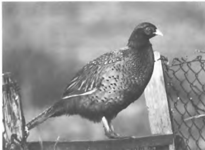
Fazant; uitgezet?

Waarschijnlijk heeft jacht meer met economie dan met beheer te maken.