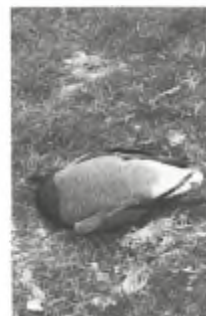
Geschoten rotgans.