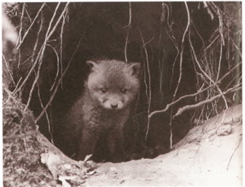
Jong vosje.