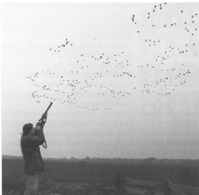
Jager schiet op groep rotganzen.

Door het Ministerie van Landbouw is op 30 maart j.l. een vergunning aan de Wildbeheereenheid Terschelling afgegeven om 'met behulp van het geweer' rotganzen te doden. Dit afschot wordt nodig geacht om de verjaging van deze dieren uit de landbouwgebieden effectiever te laten zijn. Reeds in 1981 tekende de Stichting Kritisch Faunabeheer beroep aan tegen de jacht op rotganzen. De telkens weer afgegeven vergunningen werden even zo vaak geschorst, waarna in 1990 de definitieve stopzetting van de jacht op deze trekvogels volgde. Vanwege de recent doorgevoerde reparatie van de Jachtwet meende het Ministerie van Landbouw dat het schieten van rotganzen wel weer mogelijk moest zijn. Door ons is vervolgens bezwaar aangetekend tegen deze vergunning en tevens verzoek om schorsing ingediend. Op 6 mei j.l. diende deze zaak voor de Rechtbank in Amsterdam. En tot onze vreugde heeft de voorzitter besloten de vergunning met onmiddellijke ingang, d.w.z. zaterdag 7 mei, te schorsen. Het betreft hier een voorlopige voorziening hetgeen betekent dat de uiteindelijke uitspraak later volgt. In ieder geval hebben wij dit vast gewonnen en aangezien de vergunning zou lopen tot eind mei zijn de rotganzen dit jaar veilig gesteld. Wij houden u van deze zaak op de hoogte.