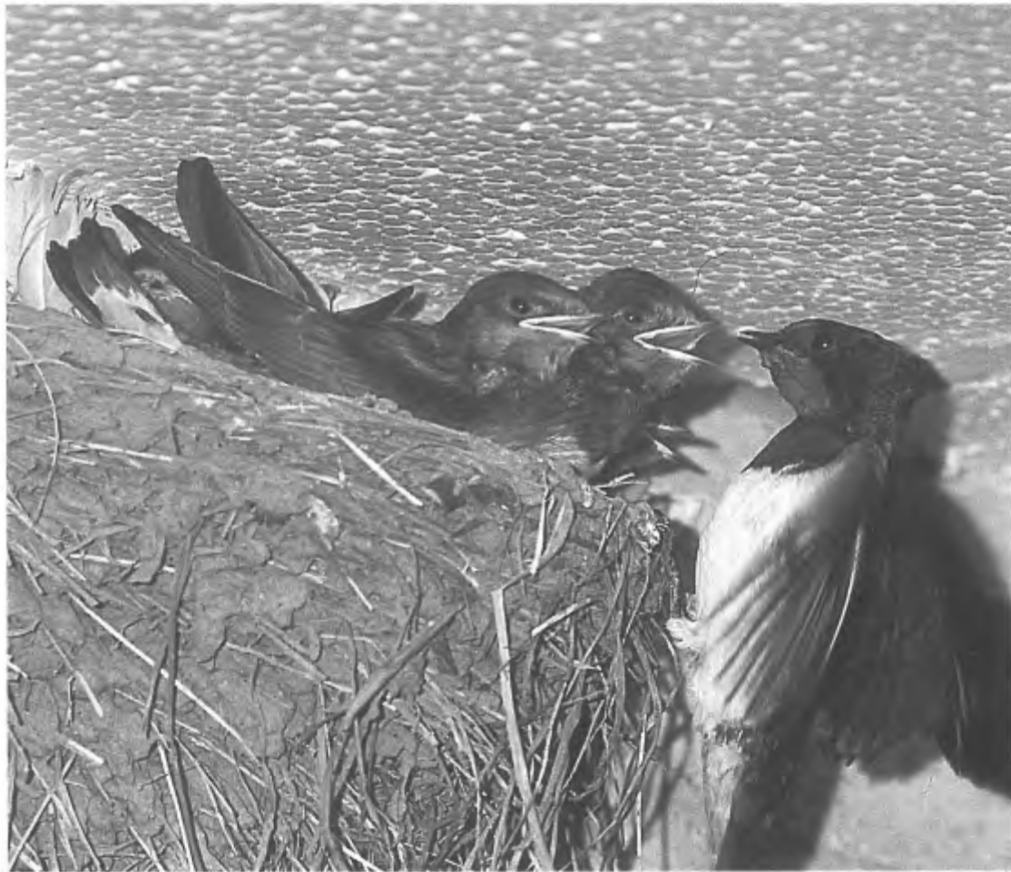
Boerenzwaluw, ekster-prooi (foto: Pieter Eibers).

Wat betreft het voedselaanbod zijn er mogelijk ook negatieve ontwikkelingen. Grotere insecten zijn mogelijk zeldzamer geworden omdat hier in de regio de veeteelt is teruggelopen ten gunste van boomkwekerijen, bloementeelt in kassen, stadsuitbreiding en dergelijke. Maar misschien liggen de problemen wel in de overwinteringsgebieden in Afrika; hebben de vogels daar nog wel genoeg te eten, nu de modernisering van de landbouw daar gevolgen zal hebben voor de natuur (ontwatering, ontbossing). Voor de gierzwaluwen gelden gedeeltelijk dezelfde problemen, alleen hebben deze vogels natuurlijk geen klei nodig voor hun nesten. Ook zijn ze minder afhankelijk van het voedselaanbod vlakbij huis, omdat ze gewend zijn grotere afstanden te vliegen om insecten te vangen. Het grote probleem voor de gierzwaluwen (een zogenaamde holenbroeder) is het vinden van geschikte broedgelegenheden. Moderne huizen zijn vaak potdicht gebouwd, en oude huizen blijken na renovatie steeds vaker ongeschikt te zijn voor de vogels. Kierende dakpannen en andere openingen zijn verdwenen, onder andere vanwege isolatiemaatregelen. Ook