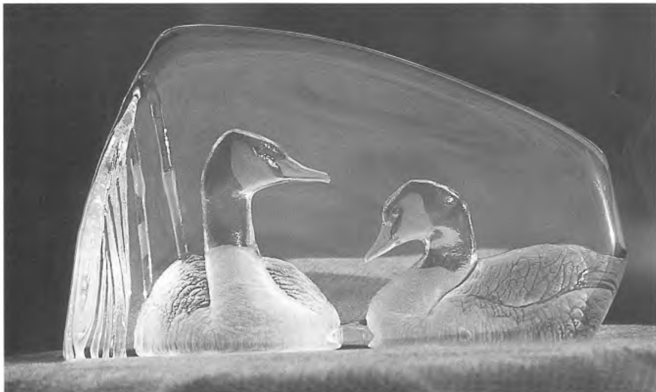
Ganzen op glas.