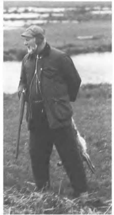
Haas is ook gemeenschapsbezit.

De verkiezingen zijn inmiddels voorbij maar de ontwikkeling in het beoogde faunabeleid van de verschillende partijen nog niet. Mede oorzaak van deze ontwikkelingen is de inzet van het Platform Verantwoord Faunabeleid.