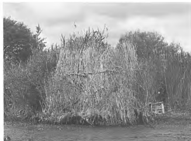
Jacht op uitsluitend waterwild mag worden uitgeoefend b.v. vanuit een bootje... ...of vanuit een jachthut die op allerlei tijdelijk of permanent natte plaatsen mag staan, maar in elk geval niet zomaar op het vasteland, (foto: Pieter Eibers)