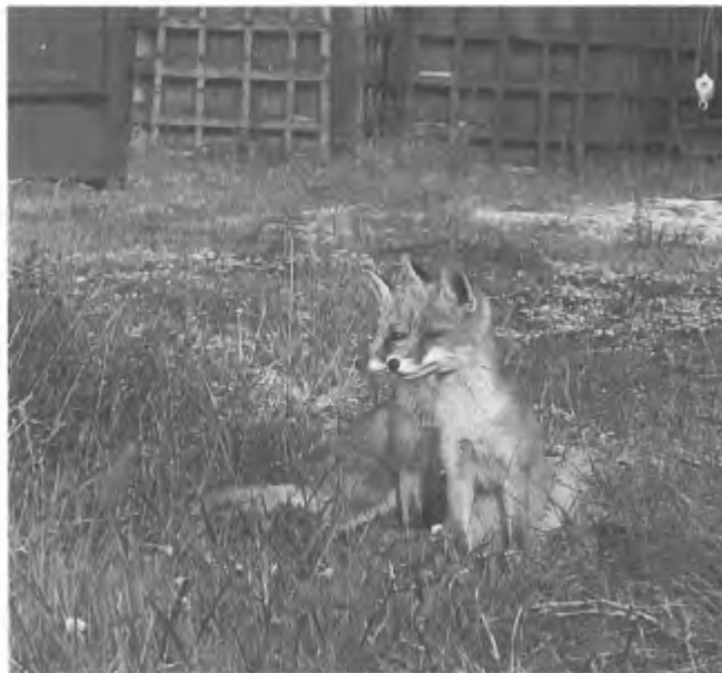
De grondgebruiker mag, volgens artikel 8, lid 1 van de Jachtwet, op eigen terrein (indien zonder jachtakte, dan zonder geweer) jagen op vossen,...

Het jachtveld geheel doorsnijdende wateren (ook die waartoe het 'genot van de jacht' zich uitstrekt) die niet over 2/3 van de lengte binnen dat jachtveld gedurende negen maanden per jaar minstens 10 m breed zijn, vormen ook geen scheiding (8). Er zijn echter jagers die vanaf de oevers schieten op watervogels in of boven openbare vaarwegen die door hun jachtveld lopen. Een watersporter die onlangs met zijn boot, twee net geschoten smienten (natuurlijk ter voorkoming van botulisme) uit een vaarwater viste, kon dus terecht vrolijk vaarwel zwaaien naar de met zijn apporteerhond op de oever staande schutter die onder het pseudoniem Meester in De Nederlandse jager leutert.