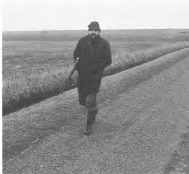
Jagers en jachtopzieners én politiemensen weten vaak niet, dat de jager zijn geweer dient te ontladen, voordat hij via de openbare weg van het ene deel van zijn jachtrevier naar het andere kuiert, (foto: Jan van Dieren)

Het is verboden zich met een geladen geweer te bevinden op