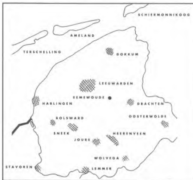
Ligging van Eernewoude in het hart van Friesland.

Recente inventarisaties tonen aan dat de genomen maatregelen succes hebben, met name voor de plantendiversiteit. In It Bil (Oude Venen) ontwikkelt zich een rijke waterplantenbegroeiing: zes verschillende soorten fonteinkruid, kranswieren, en andere zeldzame waterplanten doen het uitstekend in het zuivere water.