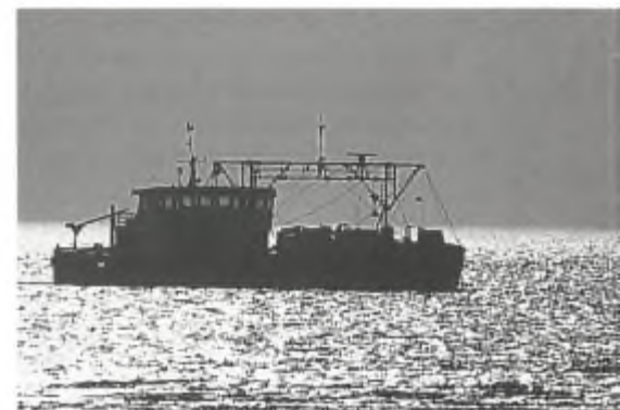
...geen rust...