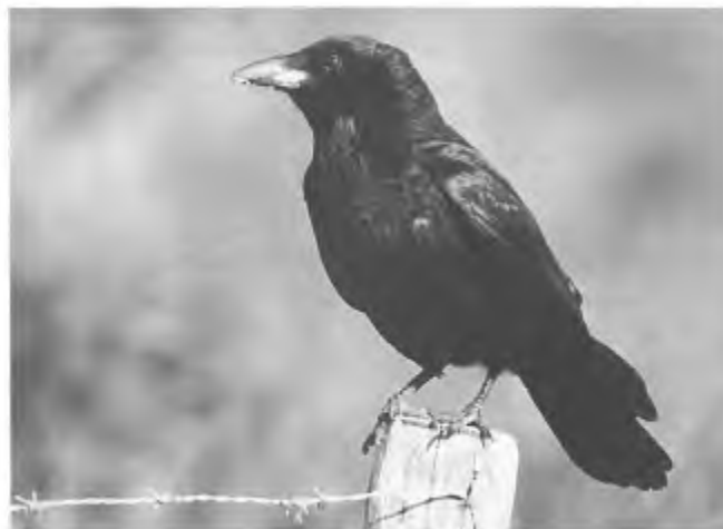
...kraaien en een reeks van andere dieren, en dit 'genot' eventueel overdragen aan een ongelimiteerde reeks van door hem begunstigen (b.v. oompjes agent!), (foto: Pieter Eibers)