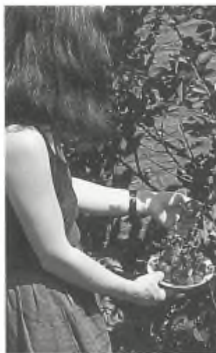
Oogst... .. Rooien, (foto's: Pieter Eibers)

- Antwoord: Hierbij maakt men graag een vergelijking met het plukken van vruchten. Zo onschadelijk is jacht natuurlijk niet. Het is beter haar te vergelijken met het rooien van een appelboom in plaats van met het plukken van de appels. Ze gaat altijd gepaard met aanzienlijke ecologische schade en ergernis voor normale natuurgenieters.