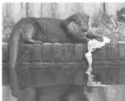
Adam met kippebout! - De opvanggelegenheden van het otterstation zal nog wel geruime tijd nodig blijven, (foto: Adriana Faber)