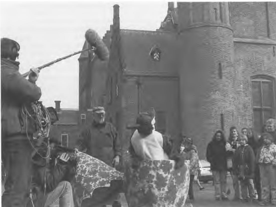
Voor het oog van het publiek en de tv-camera's komt de SKF-kievit op het Binnenhof uit het ei.