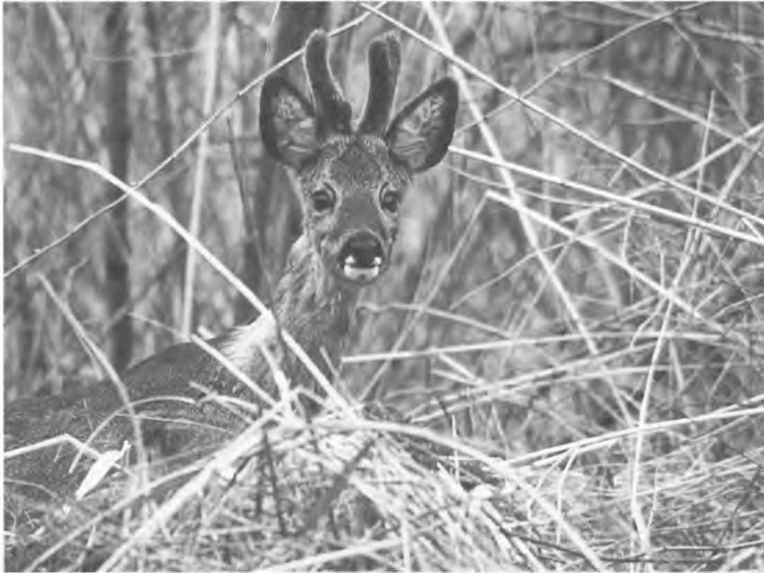
Hoe ingewikkelder, hoe mooier: Komen in een gemengd nat en droog gebied naast 'waterwild' ook b.v. reeën voor, dan wordt voor de oppervlakteberekening het water-areaal niet meegeteld. Is echter het droog oppervlak minstens 40 ha per jachtgerechtigde, dan mag er weer wel op dat 'waterwild' worden geschoten, (foto: Bas Weetink)

gronden waarop men niet bevoegd is te jagen - dus ook niet met een gebroken geweer dat nog patronen bevat. Het merendeel van de jagers denkt wél dat je daarmee over openbare wegen kunt paraderen, die gelegen zijn tussen jachtvelden. Ook jagend politiepersoneel en jachttopzichters menen vaak recht te hebben op dit genoeg. Zelf heb ik dit bijna aan den lijve ondervonden, toen een politiemann die op een openbare asfaltweg stond, zijn geweer leegvuurde op een overstekende haas, terwijl ik tussenin liep.