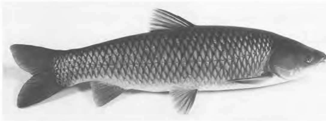
Kan het zijn dat een bewindsman minder gevoel heeft dan een vis? - graskarper