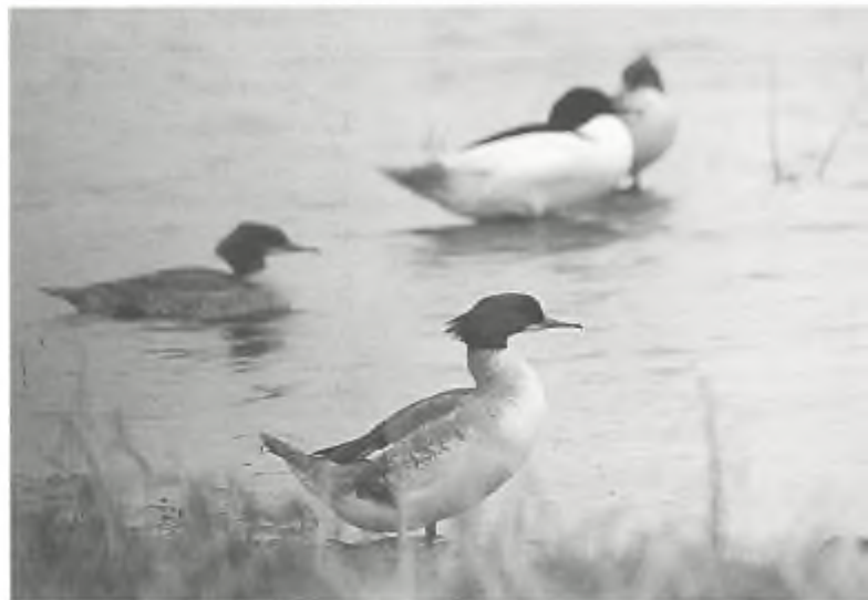
'Oosterse bouten' (waarop de jacht overigens wel is gesloten), (foto: Pieter Eibers)

hoogzit: zitje bovenaan ladder tegen boom