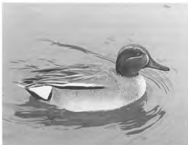
EG-Vogelrichtlijn als dode letter: de volstrekt onschadelijke wintertaling mag nog steeds bejaagd worden, (foto: Mike Weston)