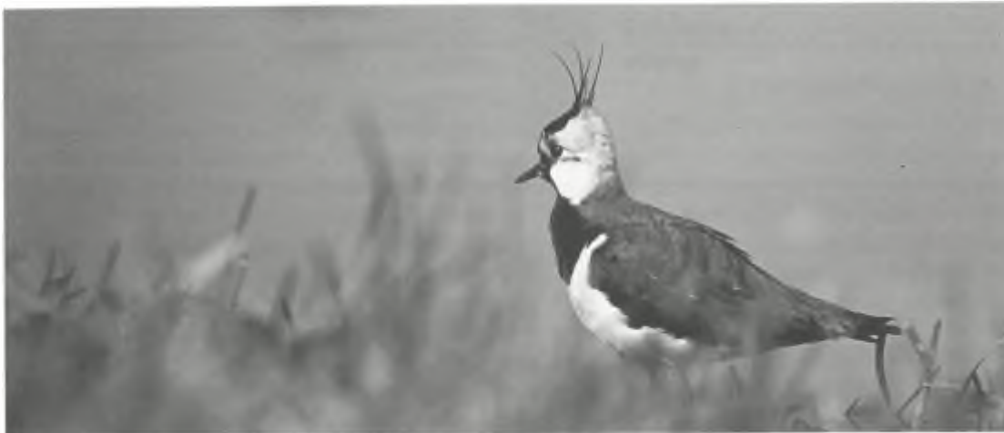
De kievit laat zich niet raden, (foto: Pieter Eibers)