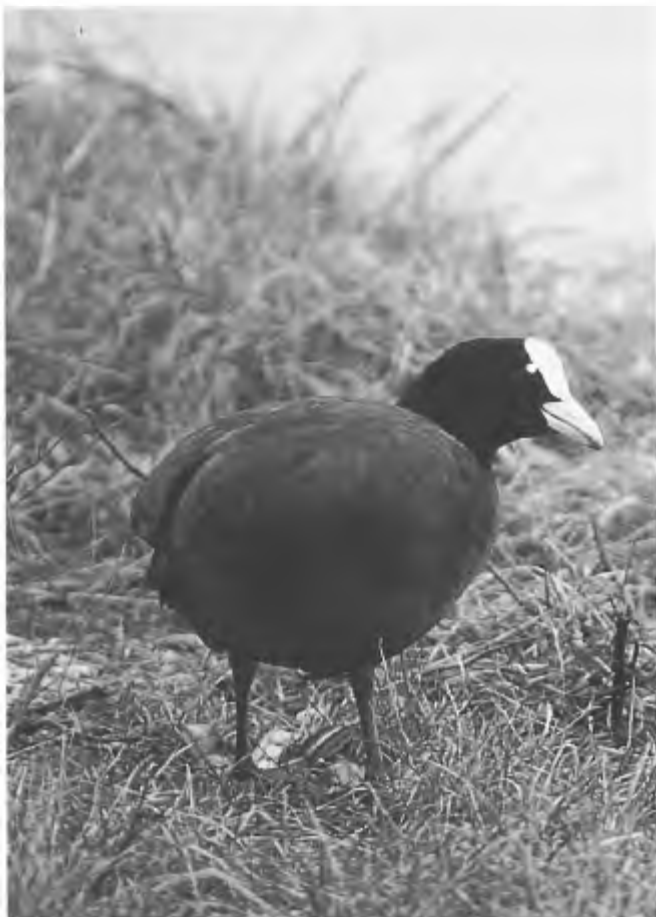
Schade door meerkoeten is gemakkelijk te voorkomen,

Uit de discussie kwam naar voren, dat jacht zeker invloed heeft op de populatiesamenstelling. Moderne landbouwmethoden eisen hun tol: meer dan tweemaal maaien, intensieve onkruidbestrijding in een al verarmd ecosysteem enz. Hoe platgeslagener en uitgekleder de biotoop wordt, hoe groter de kansen voor predatoren, die de laatste vluchthoekjes van (jonge) haasjes wel weten te vinden. Hier kan niet ook nog eens de (a-selectieve!) jacht bij.