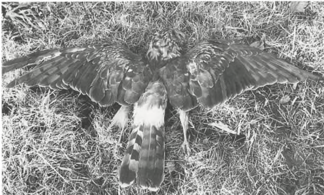
Vergiftigde blauwe kiekendief.

Klemmen. Vergif. A-selectieve middelen? - Wie eenmaal de wet in eigen hand neemt, heeft meestal weinig scrupules ten aanzien van bedoelde of onbedoelde slachtoffers.