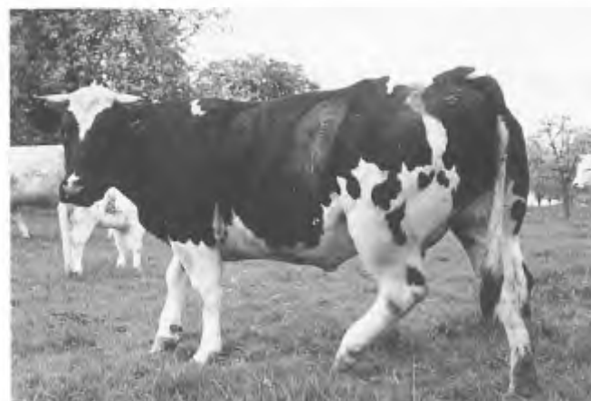
Fokken van dieren met onnatuurlijke verhoudingen: uit een dikbil komt meer biefstuk, (foto: Rogier Steege)