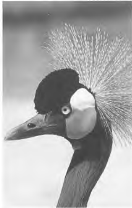
Wie er lol in heeft eens een schoonheid van een dier het leven uit te schieten, kan met grof geld bijna overal ter wereld terecht

door de dieren bij te voeren, door de natuurlijke predatoren ongelimiteerd te vervolgen, door de vegetatie aan te passen of door bepaalde planten op akkers e.d. aan te planten. Daarnaast veroorzaken jagers door hun aanwezigheid de verstoring van de gehele natuur en maakt deze de dieren schuw. Hierdoor wordt de natuurbeleving van anderen geschaad. De jacht heeft eveneens vervuiling tot gevolg vanwege het achterblijven van patronen en hulzen in het landschap.