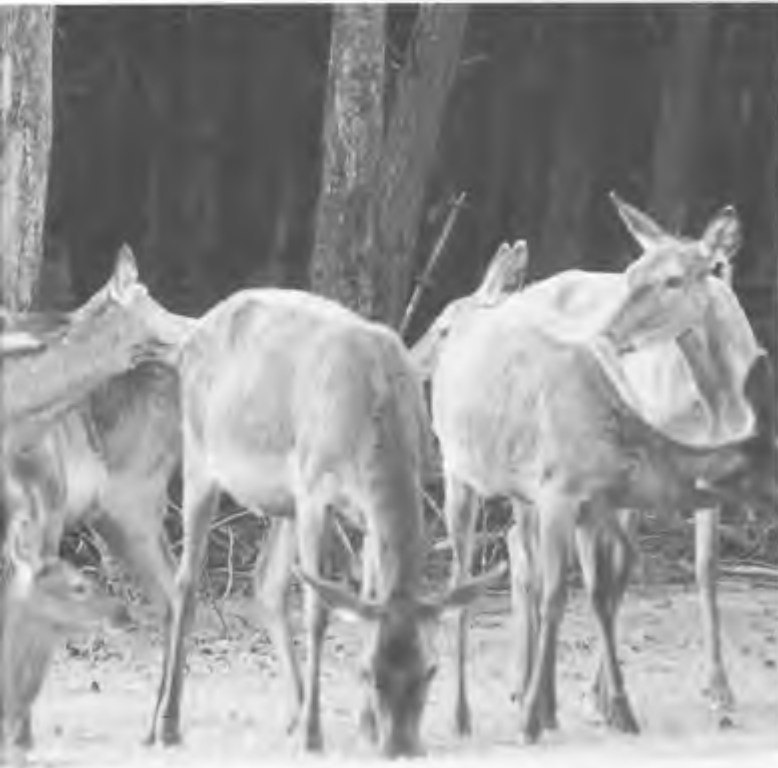
Jacht tijdens de bronst schijnt jagers een speciale kick te geven; deze periode wordt dan ook in jachtreisfolders druk aanbevolen.