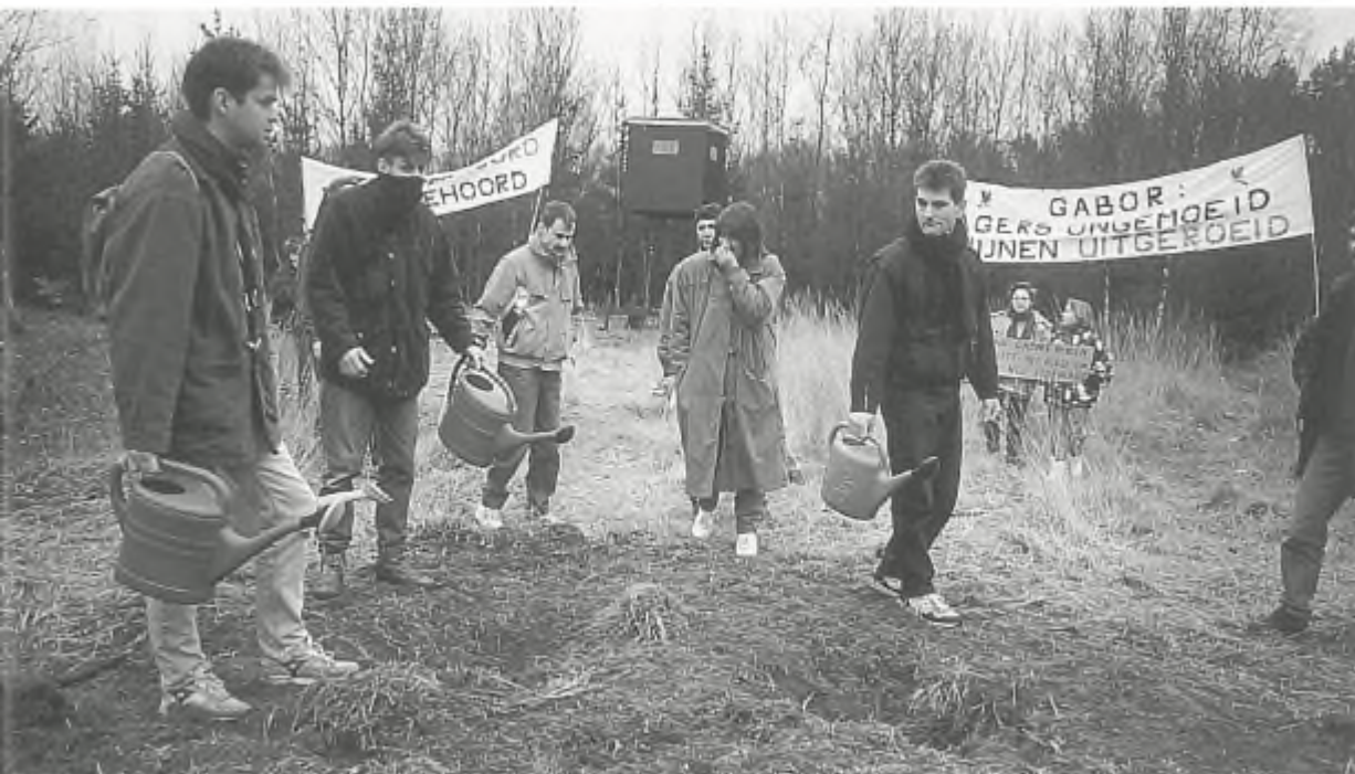
Nieuwe betekenis van 'plasje plegen': urine sprenkelen tot redding van de zwijnen.

was van een onnatuurlijke leeftijdsopbouw. Zo berekende het RIN dat in het Nederlands-Duitse natuurgebied een voorjaarspopulatie van ongeveer 200 dieren als geheel beheerd zou moeten worden. Tot op heden is er geen noemenswaardig overleg tussen de betrokken Nederlandse en Duitse instanties tot stand gekomen.