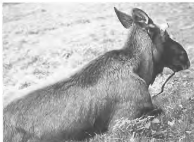
Amputeren van lichaamsdelen: in wildparken wordt vaak het gewei van elandstieren afgezaagd, (foto: Pieter Eibers)

De auteur citeert een passage uit Bonhoeffers Ethica , waarvan ik een zin overneem: 'De rechten van natuurlijk leven zijn in het midden van de gevallen wereld de weerschijn van de glorie van Gods schepping.' Natuurlijk betreft dat ook de dieren. Terecht maken wij aanspraak op rechten voor onszelf en voor de dieren op grond van Gods recht, dat geëerd en gerespecteerd moet