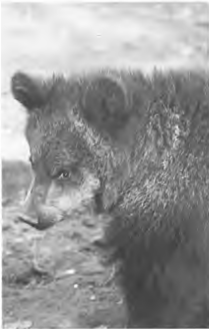
In Afrika staan (lieren als leeuw en luipaard nog steeds op het jacht-programma