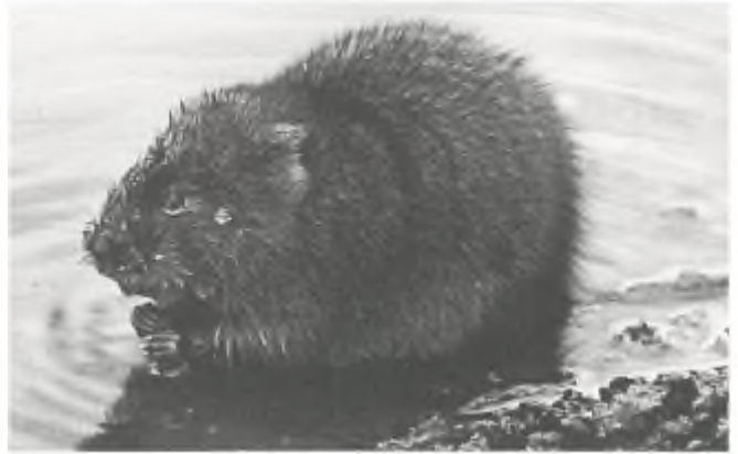
Muskusrat, dwergbever, zondebok: een succes-introductie, die zich niet even laat wegtreiteren, (foto: Mike Weston)

Maar zelfs als dat gevaar wel bestond, wat denken de muskusrattenbestrijders er eigenlijk tegen te kunnen doen? Denken, ja, heel veel, maar kennis van de eenvoudigste