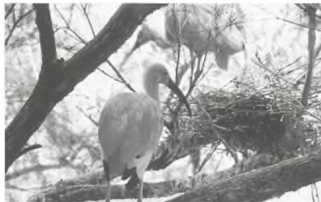
Rode ibis, (foto: Pieter Eibers)

Dr. C.M. Perrins e.a.: Geïllustreerde encyclopedie van de vogels, Een compleet overzicht van alle vogelsoorten ter wereld; 420 blz., 1200 kleurenillustraties; uitgeverij M & P, Weert, i.s.m. ICBP; ISBN 90 5112 204 7; prijs fl. 99,-.