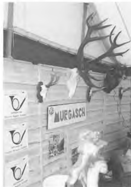
De jager die zelf een jachtreisbureau opricht kan het 'nuttige' en het 'aangename' fiscaal aantrekkelijk verenigen.

In het derde artikel in deze reeks wil ik ondermeer aandacht schenken aan de spelmiddelen voor de jacht sport, te weten wapens, kleding enz.