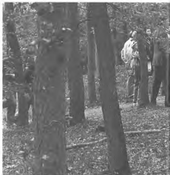
Vertrek- en verzamelpunt De Koperen Kop

Een positief punt met betrekking tot het bosbeheer is wel te noemen. Een klein perceel, gelegen in de noordelijke punt, wordt als bosreservaat behandeld. Dit betekent dat er in dit stuk terrein, Siberië genaamd, 'niets' gebeurt,