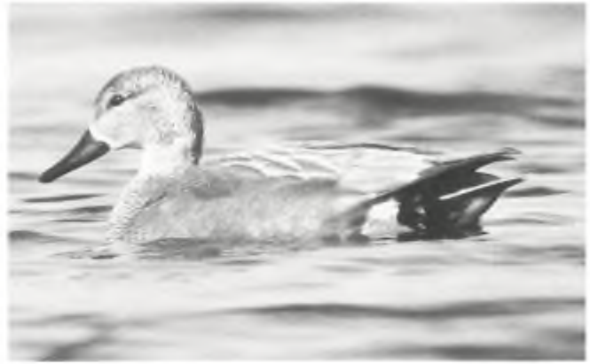
De kraakeend wordt kogelvrij, zij het op basis van een zwakke argumentatie.

Aantasting van in het wild levende dierpopulaties moet zoveel mogelijk voorkomen worden; daarover bestaat geen