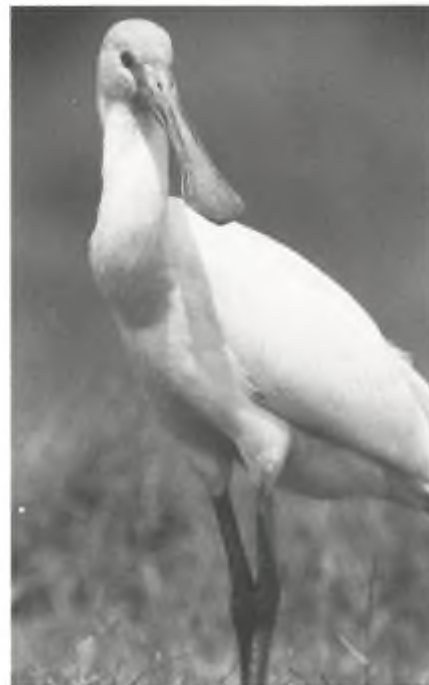
Uit de hoek van Rijkswaterstaat klinkt tegenwoordig ook het bekende jagersverhaal over de vos en de lepelaar.

Jagers krijgen bij hun ideeën steun van het Ministerie van Landbouw, Natuurbeheer en Visserij. Als uitgangspunt in het Meerjarenprogramma Natuur en Landschap 1992-1996 wordt gesteld: Wild wordt beschouwd als natuurwaarde! Dieren zijn aldus niets meer dan een stukje landschap. Naar mijn mening zijn zij echter, als levende wezens, heel wat meer dan nuttige gebruiksvoorwerpen. Dieren bezitten intrinsieke waarde, dus een waarde los van hun relatie ten opzichte van de mens.