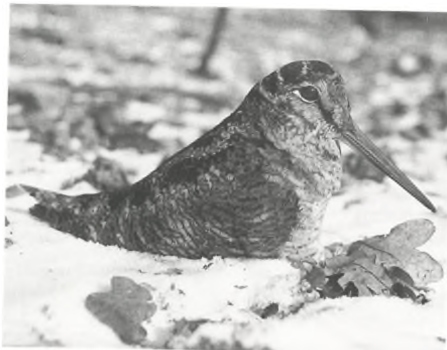
De houtsnip werd de afgelopen 25 jaar in Z.-Flevoland in principe niet bejaagd. Hoe lang nog...?

verslag en het achterliggende beleid. De verslechtering van het beheer, waarvan wij vreesden dat die in 1992 zou optreden, blijkt dus al zeker in 1990 haar intrede te hebben gedaan. Daardoor zal de overgang naar het beheer door de SJWIJ minder groot zijn dan wij oorspronkelijk dachten. Dit betekent echter wel dat de fauna nu de negatieve gevolgen van de commerciële jacht al aan den lijve ondervindt. De tussen 1986 en 1990 dramatisch gestegen afschotcijfers van de meest getroffen soorten spreken voor zich: eenden 1545/2655, houtduif 2068/5167, konijn 656/1187 en ganzen 210/366 - gemiddelde stijging: 109%! Uit het jaarverslag blijkt verder dat de toename van predatoren als ongewenste ontwikkeling wordt beschouwd en dat er alles aan zal worden gedaan hun aantallen zo veel mogelijk te beperken. Deze opstelling kan de positieve ontwikkeling van de natuur in dit gebied weleens doen omslaan in het tegendeel.