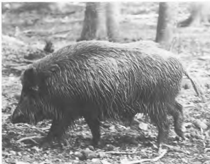
Het 'genot van de jacht' op wilde zwijnen vergt jaarlijks een offer van zo'n f 130,- per ha.