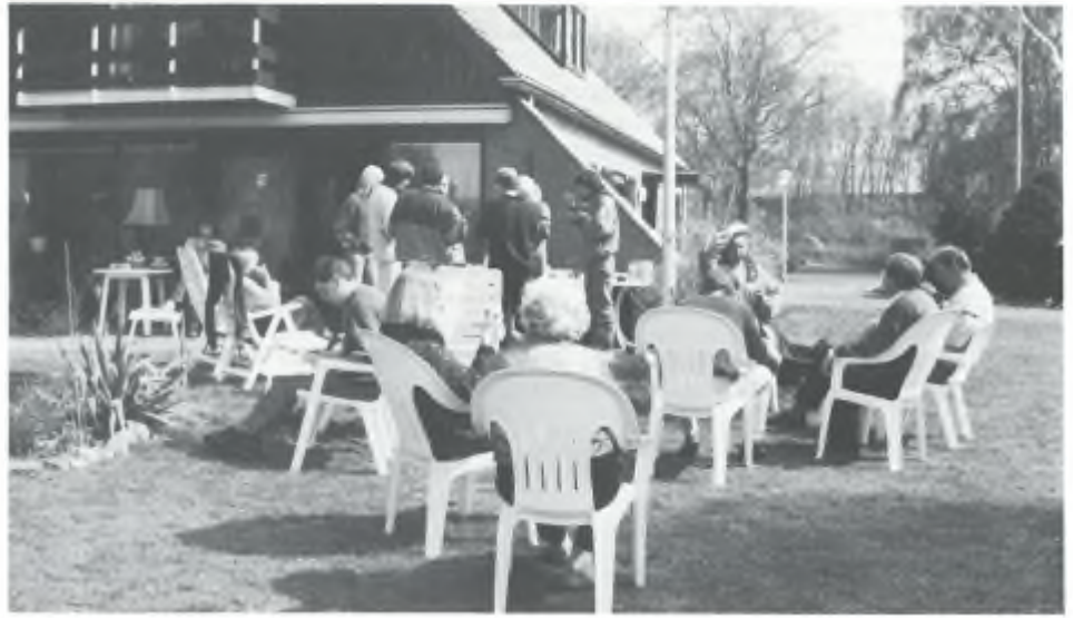
Kaderdag SKF

Ugilec, de stof die de PCB's moet vervangen en vooral wordt toegepast in de Westduitse mijnbouw, blijkt dezelfde toxicologische eigenschappen te hebben als PCB's, zoals verhoogde kans op tumoren, verminderde immunologische weerstand en negatief effect op de voorplanting van veel zoogdieren. Bovendien hoopt het zich ook op in vissen. Dit zijn de conclusies van een workshop van de Landbouw Adviescommissie. De Commissie zal haar conclusies o.a. voorleggen aan de Europese Gemeenschap. Ook zal druk worden uitgeoefend om de toepassing van deze stof op zo kort mogelijke termijn te verbieden. In Nederland is zo'n verbod al van kracht.