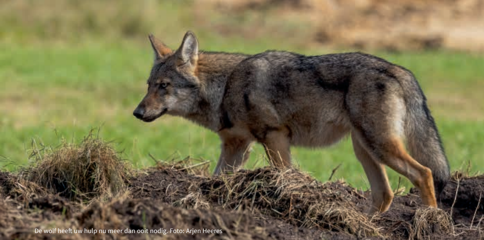
De wolf heeft uw hulp nu meer dan ooit nodig.

derd werden door een wolf was er nooit sprake van een aangelijnde hond. Waar wolven dichtbij mensen kwamen, was er altijd sprake van dieren, die bijgevoerd waren (in Ermelo bijvoorbeeld met hamburgers en frikandellen om van dichtbij een mooie foto te kunnen maken van een wolf) of van mensen, die met loslopende honden in wolvengebied liepen. Er is in Nederland nergens een mens door een wolf aangevallen in de 21e eeuw.