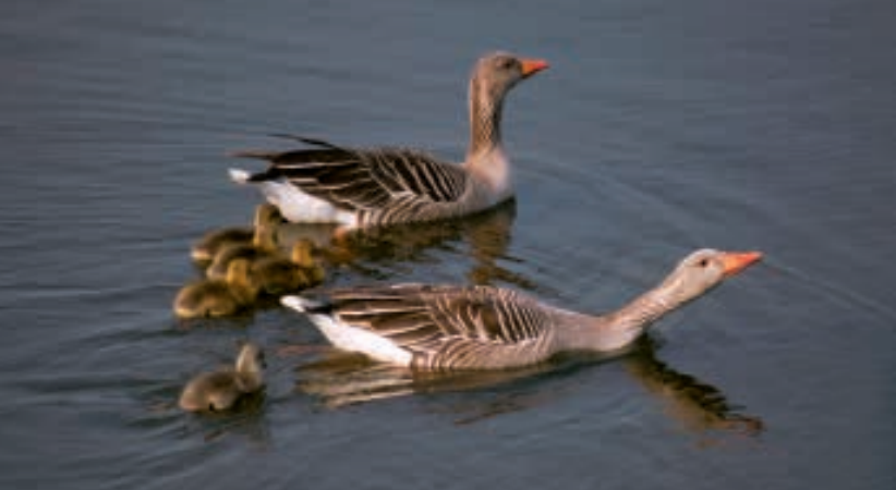
De massale bestrijding van grauwe ganzen levert geen enkel resultaat op.