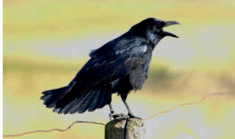
De bestrijding van kraaiachtigen en vossen werkt zo goed dat de aantallen zelf toenemen.

optreden tegen die soort vrijwel altijd verbieden en de verleende ontheffing vernietigen. Daarbij in toenemende mate gebruik makend van een onafhankelijk advies van de StAB, de Stichting Advisering Bestuursrecht. Helaas bestaat een organisatie als SOVON niet voor zoogdieren, de zelfbenoemde deskundigen buitelen bij juridische procedures dan ook over elkaar heen. Ook daarin zou voorzien moeten worden bij een stelselwijziging.