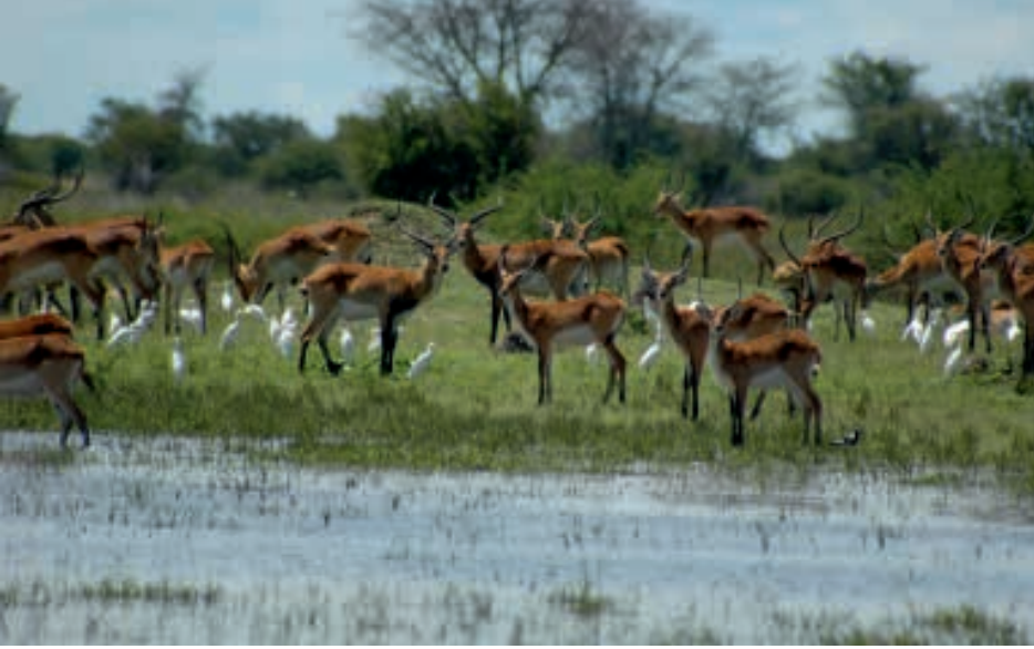
Kafue Litschiewaterbok in Lochinvar NP, Zambia. Eén van de vele soorten antilopen waarvan de trofeeënjager liever een kop met hoorns op een plank ziet dan dat hij anderen ervan laat genieten.

dieren worden gefokt met als doel later op gejaagd te worden 9, 10 .