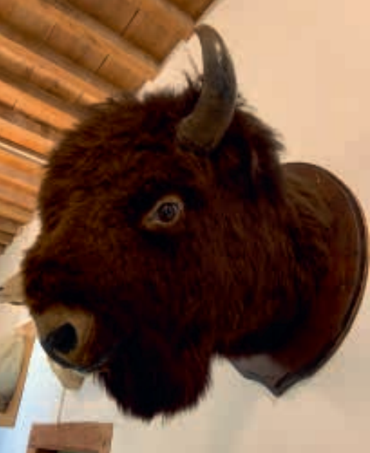
Het enige dat ontbreekt is een jager op een eikenhouten plank.