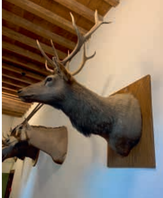
Tegen de muur gespijkerde trofeeën als bewijs van het disrespect jegens andere soorten.

niet langer het eigendom van de landheer. Het zijn “onze” dieren geworden. De jacht staat ter discussie. Een brede maatschappelijke discussie. Aldus gesterkt werd de laatste wenteltrap naar de zolder beklommen, waar de traditionele jagersexpositie zonder scrupules een levensgrote geschoten beer en dito leeuw, meteen de realiteit afvuurt. Rijen geschoten vogels in vitrines visualiseren de verhalen van de weidmannen. Hier heerst