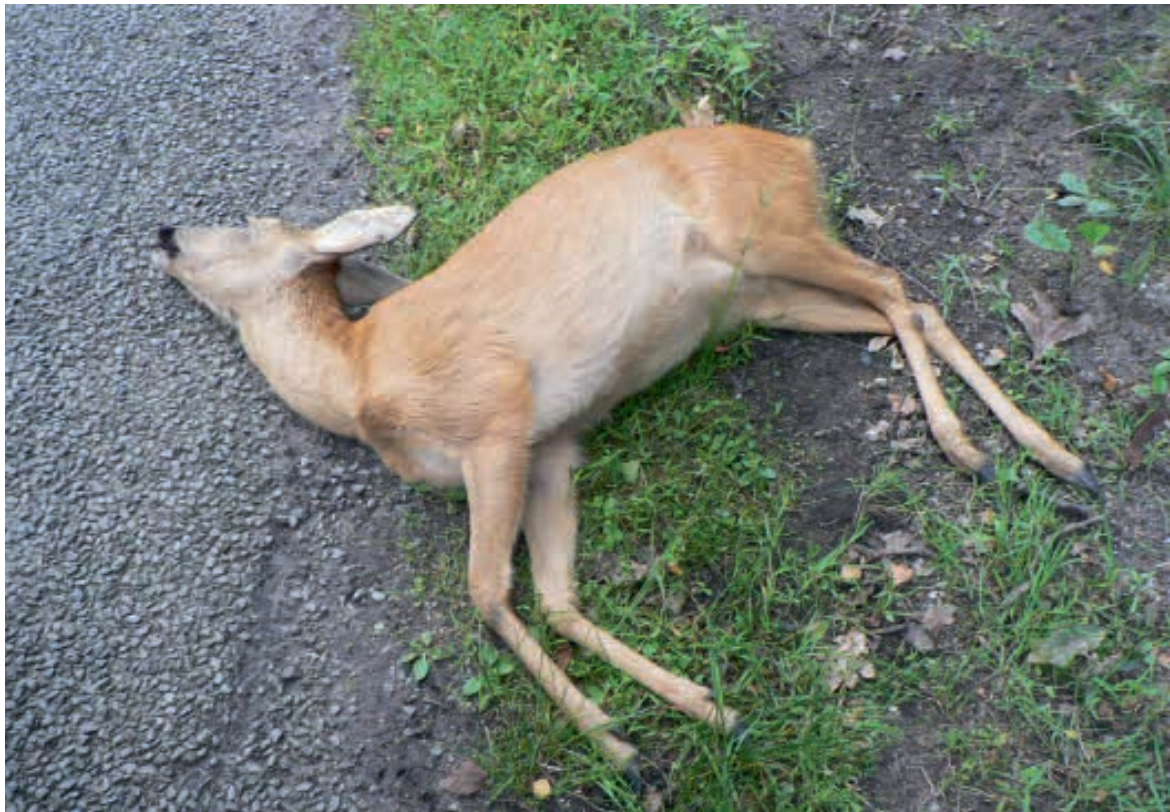
Verkeersveiligheid wordt vaak ten onrechte gebruikt om het afschot van reeën te vergoelijken.