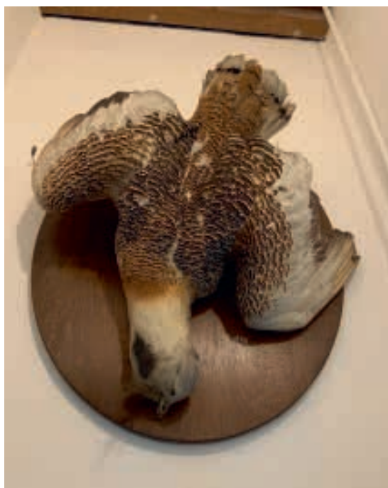
Beter een vogel op een plank dan 10 in de lucht?