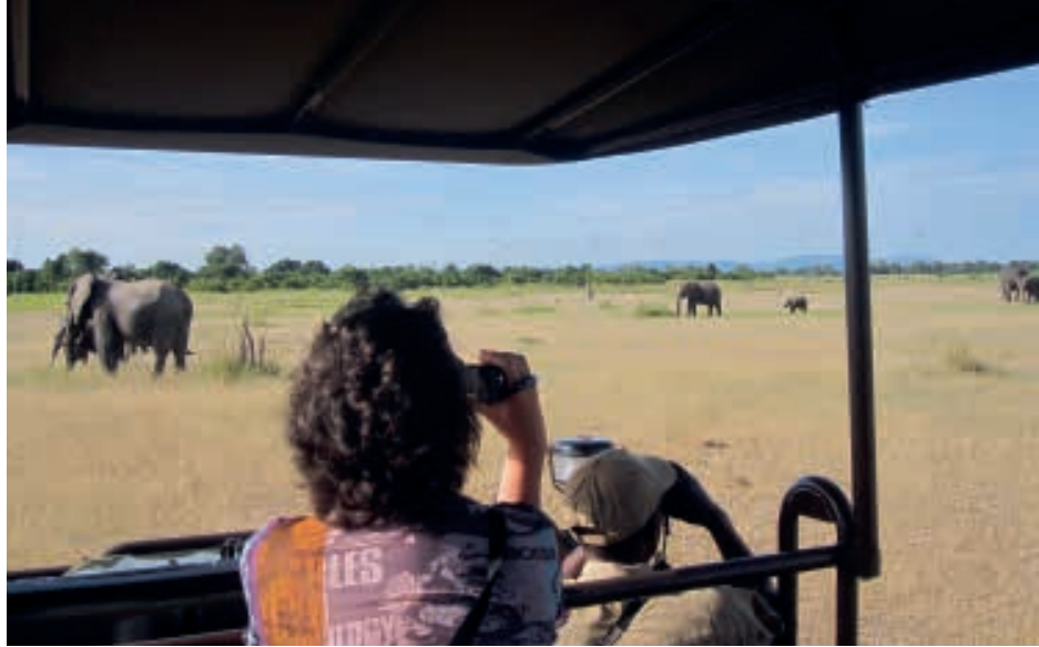
Ecotoerisme kan vele malen meer opbrengen dan het destructieve jachttoerisme.

Echter toen de oprichters van Born Free hun natuurfilms maakten over Elsa de leeuwin, konden ze waarschijnlijk niet bevroeden dat toeristen zich als sprinkhanen over de wereld zouden verspreiden, een spoor van ecologische vernieling achter zich aan trekkend. Dieren moeten in ieder geval worden gewaardeerd om hun intrinsieke waarde en het doden van dieren voor recreatie