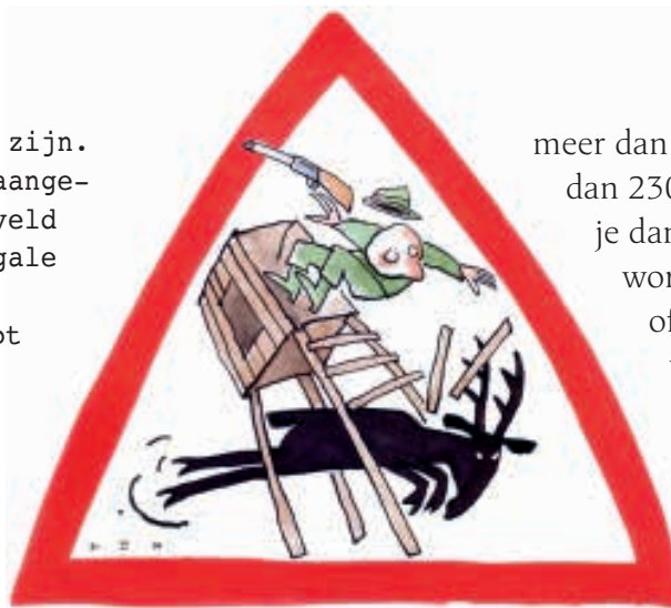
Logo/Cartoon: Len Munnik

De Faunabescherming roept het publiek op alert te zijn op illegale schiethutten en bezwaar te maken tegen de aanleg van permanente hoogzitten in natuurgebieden.