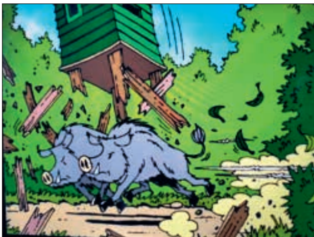
Logo/Cartoon: Martin Man

Tot grote verbazing van het publiek bleek er na het wegtrekken van het kleed een 'overspannen jager' in de hut te zitten. Hij waarschuwde de aanwezigen voor hel en verdoemenis als men de jagers zou blijven tegenwerken en de voederplaatsen van 'wild' zou blijven verstoren.