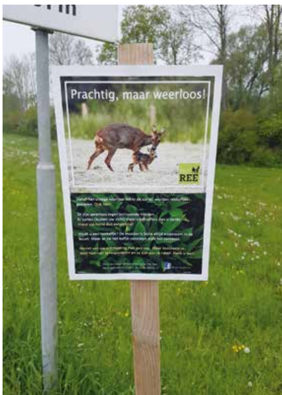
Poster van vereniging het reewild. Foto: Harry Voss.

om in de toekomst een meer diervriendelijke poster eraast te hangen. Ideeën zijn welkom. Bron: hetree.nl