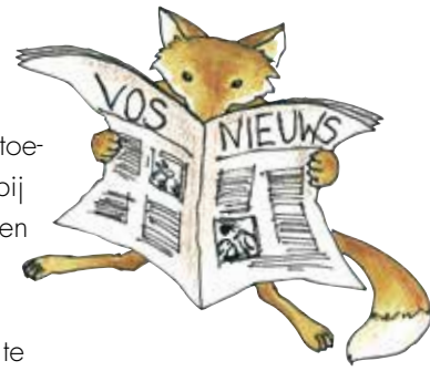
Cartoon: Frans Bijvank.

bestrijding" wordt dit veelal toegepast. Het gebeurt vooral bij jacht op duiven, kraaiachtigen en ganzen.