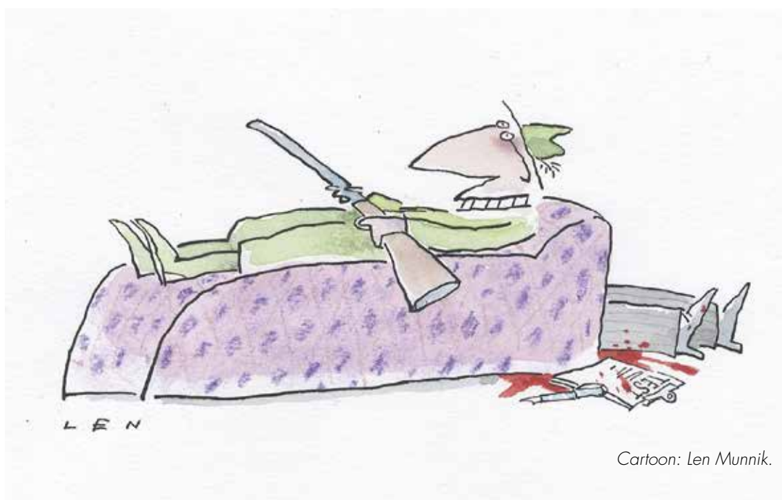
Cartoon: Len Munnik.