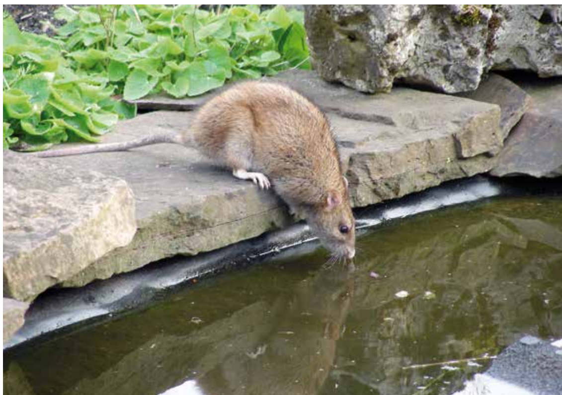
Bruine rat, foto's Ineke van den Abeele.

van roofvogels, uilen, kraaiachtigen, meeuwen, egels, kleine marterachtigen en dergelijke. Erger nog, vergiftigde ratten kunnen met opzet worden neergelegd om roofvogels te bestrijden. Ratten en muizen zijn hele intelligente en leuke diersoorten, zoals veel mensen uit ervaring hebben ondervonden, die een belangrijke functie in de natuur hebben te vervullen. Zij vormen het stapelvoedsel van veel predatoren en ruimen veel van onze rotzooi op.