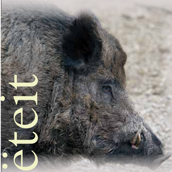
Aad van der Waal

Zo'n kroondomein drie maanden reserveren lijkt inderdaad een tikkie arrogant Maar mijdt u toch 't voorbarig concluderen! Ik toon u een markant causaal verband