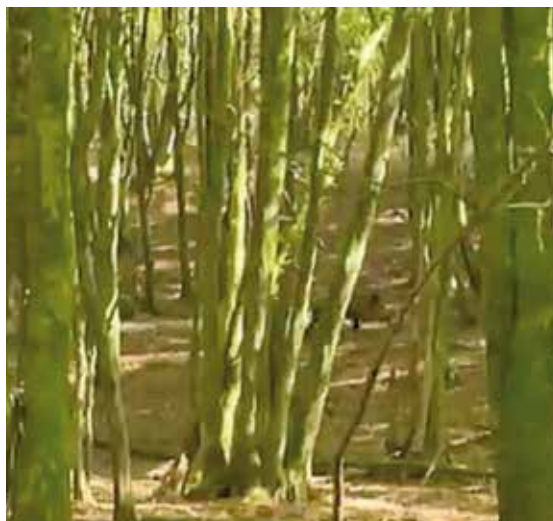
'Wild zwijn in bossen bij Lagland', still, RTBF.

Al sinds in september vorig jaar de eerste besmettingen met AVP bij wilde zwijnen aan het licht kwamen, circuleren er geruchten dat jagers (of militairen) hiervoor verantwoordelijk