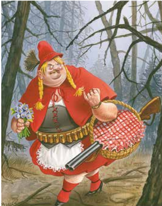
Illustratie Bruno Haberzettl

E lk jaar worden tijdens de plezierjacht weer zo'n twee miljoen in het wild levende dieren geschoten alleen voor de lol. De meeste mensen zijn tegen deze jacht, maar jagers doen er alles aan om het draagvlak voor de jacht te verhogen.