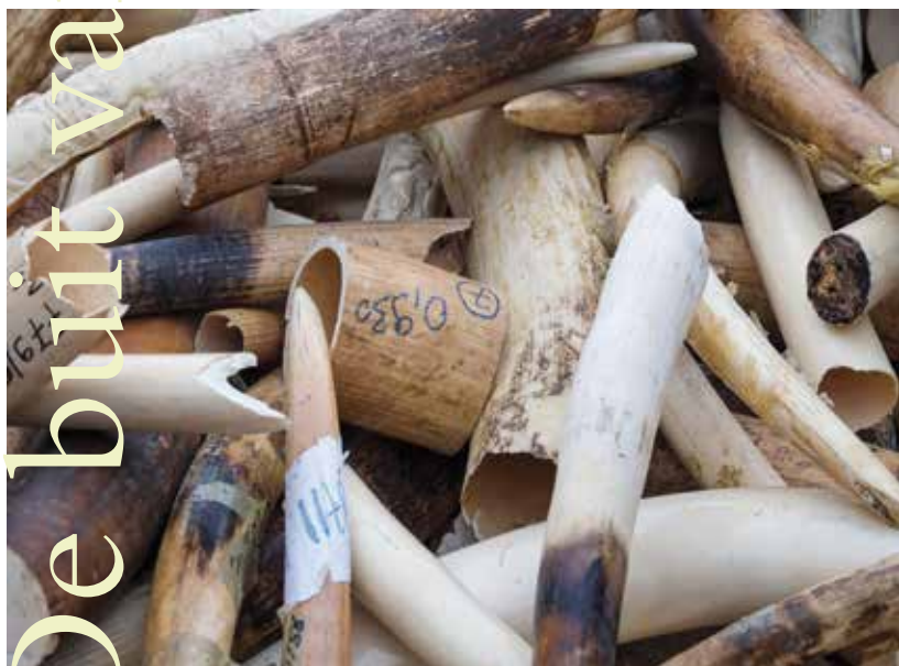
In beslag genomen illegaal ivoor.

Er blijkt in Nederland veel illegaal ivoor in om-