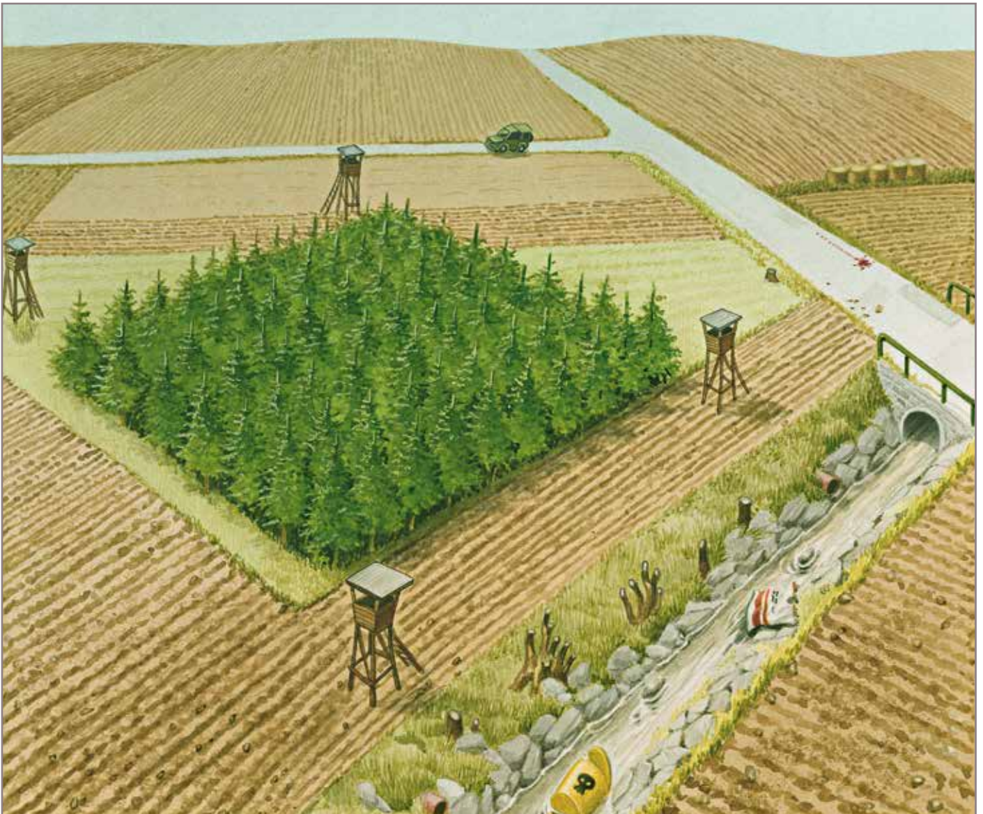
Bruno Habertzettl - Die atemberaubende Schönheit der Natur [De adembenemende schoonheid van de natuur]

'Precies. Iemand met koorts is ziek. Daarom op de cover van het boek Brunos Jagdfieber de Sigmund Freud scene met het wild zwijn als psychiater en de jager als patiënt.'