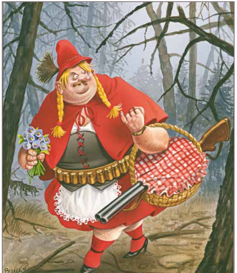
Bruno Haberzettl - Freies Geleit für Meister Isegrim [Vrijgeleide voor Isegrim]

Freies Geleit für Meister Isegrim is een cartoon waarin je de jager opvoert verkleed als Roodkapje.