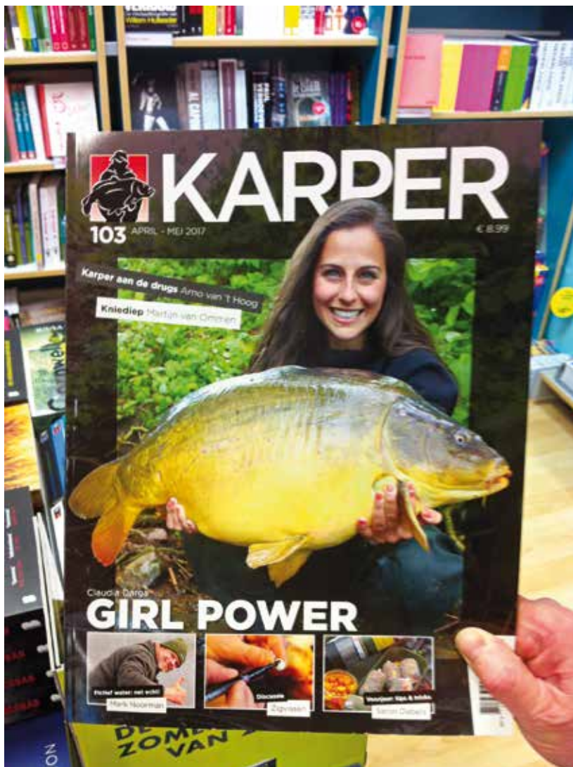
Net zo trendy als jagen voor dames?

V an jongs af aan ben ik gefascineerd door vissen. Ik kan me nog goed herinneren hoe ik ooit onder de indruk was, toen ik een van mijn oudere buurjongens een baars zag vangen. Vanaf dat moment ging ik vaker mee, ook om zelf te vissen. Naarmate ik ouder werd, leerde ik meer over verschillende technieken en kwam er meer geld beschikbaar om aan de hobby te spenderen.